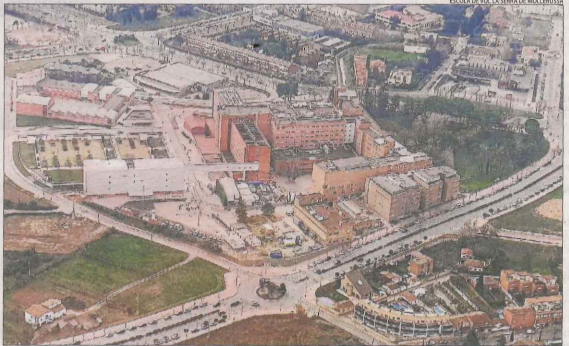
Imatge aèria de l'hospital Arnau i del nou edifici i la passarel·la de connexió, de color blanc.