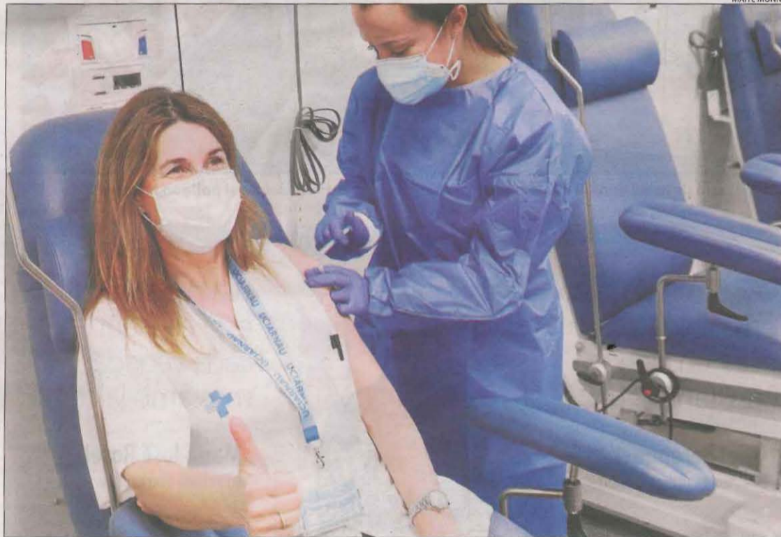
Imatge d'arxiu d'una professional sanitària al rebre la vacuna de Moderna.

Pel que fa al conjunt de Catalunya, la velocitat de contagis també continua a la baixa i ahir era de 0,89, dos centèsimes menys. El risc de rebrot també va disminuir 26 punts i se situava en 431. La conselleria de Salut va notificar 47 nous defuncions més, per la qual cosa el total s'eleva a 19.743. Així mateix, es