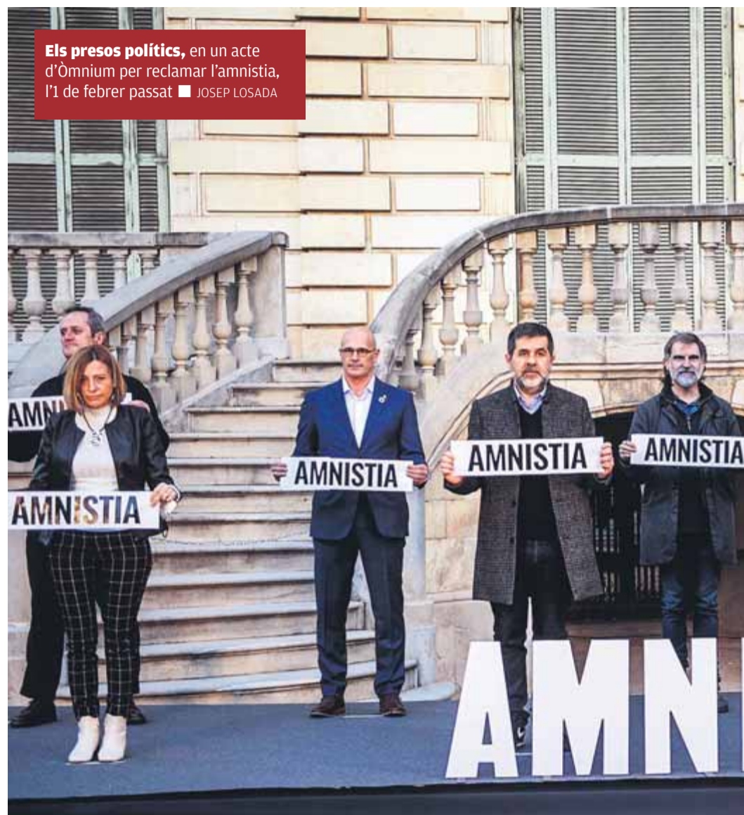
Els presos polítics, en un acte d'Òmnium per reclamar l'amnistia, l'1 de febrer passat

En el recurs contra la semilibertat del president d'Òmnium, Jordi Cuixart, condemnat a nou anys de presó, la fiscalia insisteix que en entrevistes a mitjans de comunicació continua amb el seu lema Ho tornarem a fer , tot i que la fiscalia no aprofundeix en el seu significat. I, tal com indicava el Suprem, detalla per què ha d'estar més temps tancat, com ara per "una falta de canvi de la personalitat relativa a l'activitat delictiva", ja que, per la fiscalia, Cuixart, com la resta de presos, "reconeix els fets, però no que siguin delictes", i, per tant, considera que "l'evolució del tractament és nul·la", sense aclarir què hauria de fer en l'exigència que respecti la llei. El fet que Cuixart, amb la semilibertat, torni a la vida laboral i a la responsabilitat paternofamiliar no és valorat.