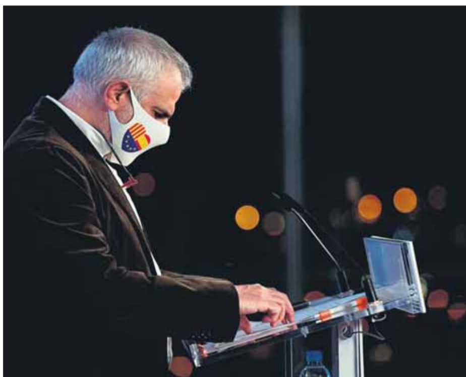
Carlos Carrizosa en la seva intervenció als mitjans la nit del 14 de febrer