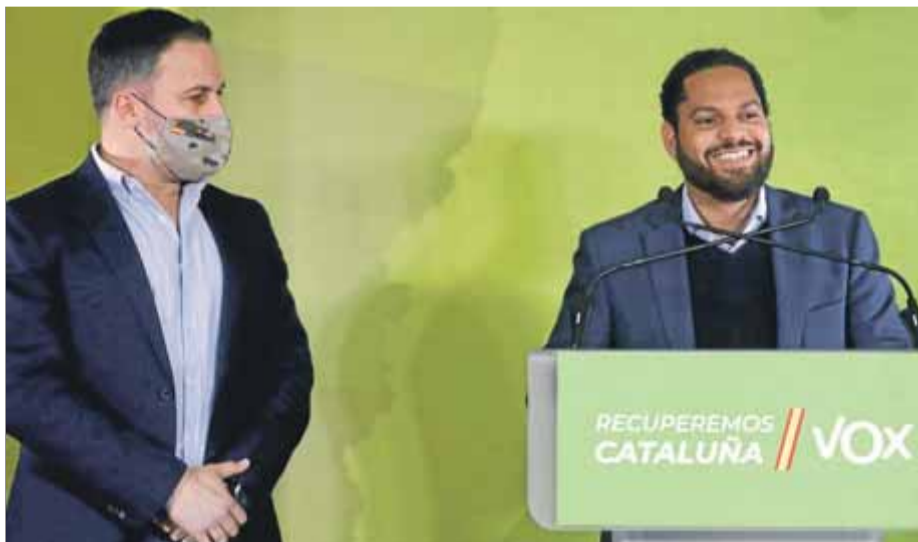
D'esquerra a dreta, Santiago Abascal i Ignacio Garriga, ahir

Vox ha obtingut el 7.69% del total de vots a Catalunya, amb més presència a les demarcacions