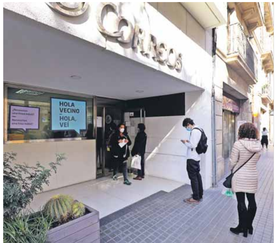
Ciutadans fent cua a l'oficina de correus del carrer València de Barcelona

La xifra d'excuses presentades a les juntes per no ser membres de les meses continua creixent. Segons informava ahir el TSJC, almenys 30.631 persones han demanat no ser presidents o vocals, una xifra que representa un 37% del total de 82.000 escollits per sorteig. Precisament, la titular del jutjat contenciós administratiu 7 de Barcelona ha eximit d'acudir a la constitució de les meses del 14-F una suplent d'una vocal que va aduir problemes de salut (no han transcendit), malgrat que la junta electoral de zona havia rebutjat les seves al·legacions. La magistrada accepta les mesures cautelarrissimes sol·licitades per la dona i obliga la junta de Barcelona a rellevar-la. ■