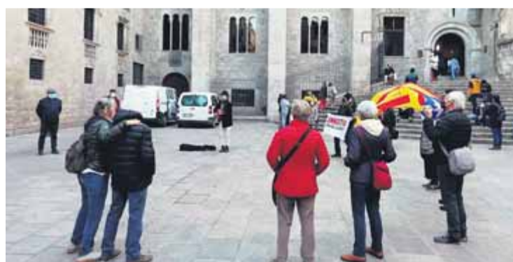
La concentració 'il·legal' que va tenir lloc a la plaça del Rei