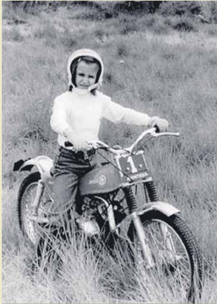
Laura Borràs, fotografiada de ben petita quan practicava trial conjuntament amb altres esports com ara la gimnàstica rítmica

Borràs assegura que la perseverança és una bona actitud per a l'èxit dels projectes, però malauradament també hi ha qui li recorda que el que planteja en el programa es considera sedició i l'Estat ho castiga amb anys de presó. "Sort que tenim un govern progressista que vol modificar el Codi Penal i adaptar un delictes que no existeix en les democràcies consolidades del nostre entorn", ironitza. Arronsa el nas i el front quan sent parlar de presó. Des del primer dia intenta defugir el "marc mental espanyol" que ja no amenaça, sinó que imposa penes de presó per sedició quan el que un vol és posar les urnes o que obre investigacions per corrupció. Ella s'hi rebota. "No podem estar colonitzats per l'imaginari espanyol", sentència, i aposta perquè el canvi de sobirania política també es traslladi al camp de la sobirania mental, potser per això el seu horitzó més desitjat és aquell que li permeti tornar als llibres i a la literatura d'on prové perquè això significarà que ha aconseguit fer realitat el seu projecte independentista. I, si bé l'assaig, la poesia i el teatre s'arregleren al seu espai de lectura i formen part de les seves aficions i dedicacions, no cal oblidar que, molts cops, diuen, la realitat pot superar la ficció. Ella, però, assegura que l'afronta amb la "consciència tranquil·la" per la feina feta des que va accedir a la Generalitat des de l'Institut d'Estudis Catalans, primer, i més tard des de la conselleria de Cultura en aquesta nova etapa política.