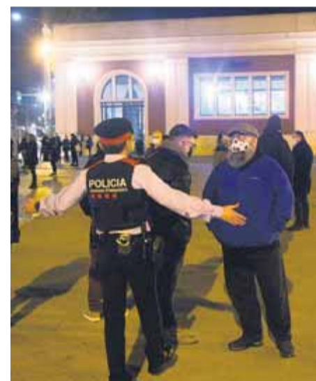
Un policia comunicant ahir als manifestants que l'acte estava prohibit