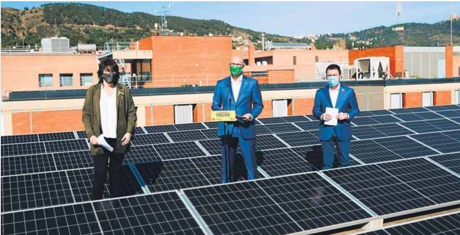
L'eurodiputada Diana Riba, l'exconseller Raül Romeva i el candidat d'ERC, Pere Aragonès, ahir en un acte sobre transició ecològica a la UPC