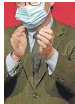
Salvador Illa, candidat del PSC

El candidat del PSC per al 14-F, Salvador Illa, va acusar ahir els últims governs catalans d’haver descurat els serveis públics i va deplorar que partits “que es diuen d’esquerres”, en al·lusió a ERC, hagin anteposat “buscar repúbliques imaginàries” a la sanitat o l’educació, “com si en una Catalunya independent aquests problemes s’haguessin de resoldre “per art de màgia”. El president dels socialistes, que ahir va presentar les seves propostes en matèria de sanitat, educació i serveis socials, va assegurar que una de les conseqüències més nefastes de la “dècada perduda” que ha suposat el procés ha estat la degradació dels serveis públics, que han sofert la mala gestió de successius governs “amb prioritats equivocades” quan encara es dolien de les “retallades” aplicades durant la crisi financera.