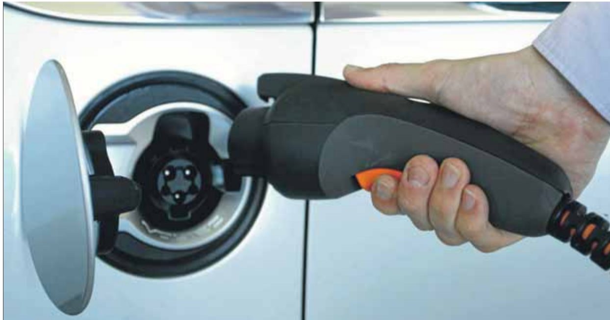
Els projectes triats engloben activitats com ara la producció de bateries elèctriques, entre d'altres ■ LLUÍS SERRAT

La fuetada que infligirà la crisi del coronavirus sobre les economies de la gran majoria dels països europeus, per no dir tots, ha fet que les autoritats comunitàries hagin mobilitzat una quantitat ingent de recursos —el que es coneix com a fons Next Generation EU— que han de servir d'estímul de xoc. Parlem, en total, d'uns 750.000 milions d'euros en ajudes, dels quals uns 150.000 aniran a parar a l'Estat espanyol. I el govern de la Generalitat ja ha fet la seva part dels deures seleccionant un paquet de 27 projectes que es podrien beneficiar d'una picossada d'aquesta injecció pressupostària. Han estat triats per un grup d'experts entre 542 propostes, que, per concepte, haurien d'ajudar a reactivar, i a transformar si cal, el teixit productiu del país aplicant criteris com ara la sosteni-