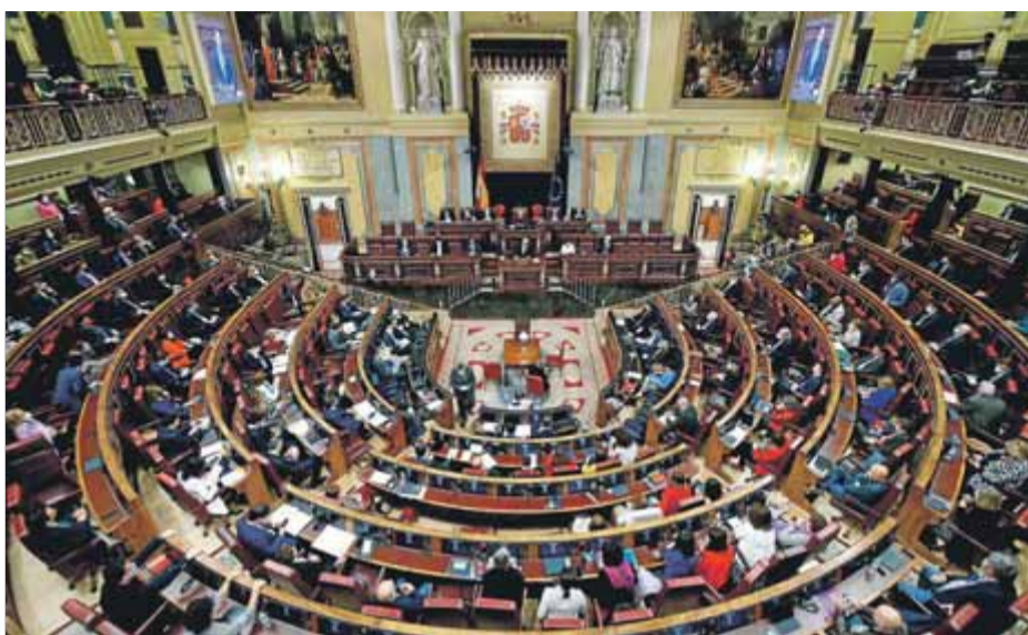
El Congrés va debatre ahir i donarà llum verd demà a la moció d'ERC sobre la taula de diàleg ■ EFE