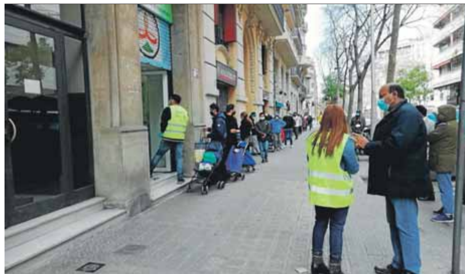
La cua d'usuaris al centre cultural indi de Barcelona en espera de rebre aliments ■ J. PANYELLA