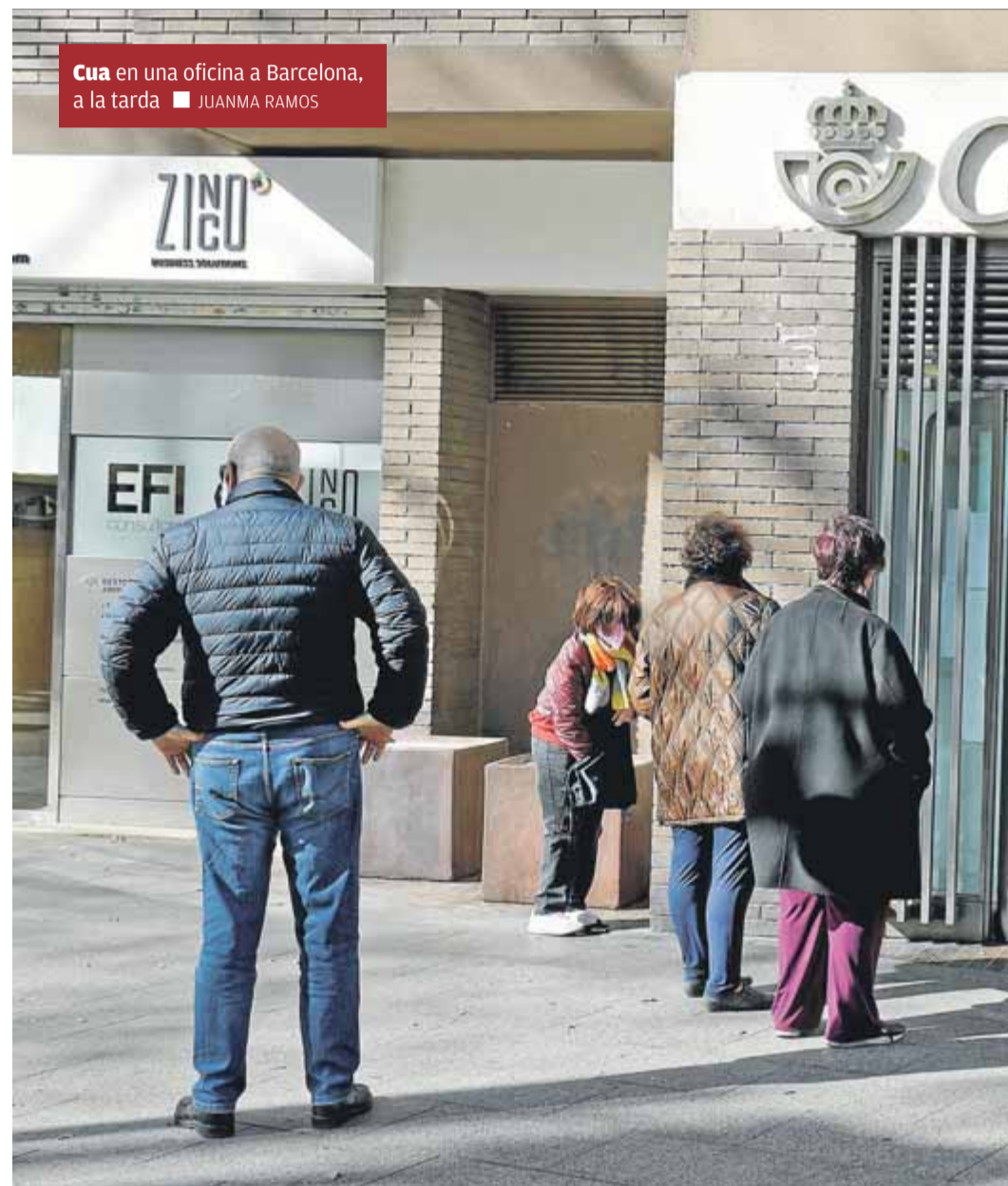
Cua en una oficina a Barcelona, a la tarda

Una probabilitat, la de trobar-se al domicili, que també s'ha incrementat amb la proliferació del teletreball a causa de la