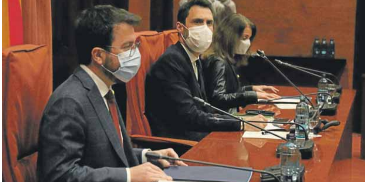
Aragonès, Torrent i Budó, presidint la Taula de Partits al Parlament, el 15 de gener passat

“No hi ha una causa de força major que justifiqui l'ajornament de les eleccions”, i per tant “s'ha vulnerat el dret a vot”, i especialment perquè amb la data alternativa del 30 de maig “hi ha un període prolongat de provisionalitat de les institucions de Catalunya”. És la conclusió del TSJC, que ahir va fer pública la sentència –la resolució definitiva de la qual ja va avançar divendres passat amb l'inici de la campanya–, en què declara la nul·litat del decret 1/2021 que suspèn les eleccions del 14-F i les ajornava fins al 30-M, si les condicions sanitàries ho permetien. Dels set magistrats de la secció cinquena de la sala contenciosa administrativa del TSJC, el jutge José Manuel de Soler, va mantenir el seu vot particular en contra, en defensar que sí que s'hauria d'haver permès l'ajornament.