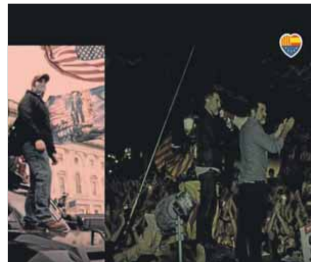
Un fragment del vídeo que enllaça les imatges de Cuixart i Sànchez amb la de manifestants pro Trump

demont i Quim Torra. Durant la presentació ahir del vídeo, la presidenta de Ciutadans, Inés Arrimadas, va manifestar que la comparació entre tots dos episodis "és òbvia", i després va afegir: "L'assalt al Capitoli ha fet que molta gent s'adoni de la gravetat del que hem viscut a Catalunya." ■