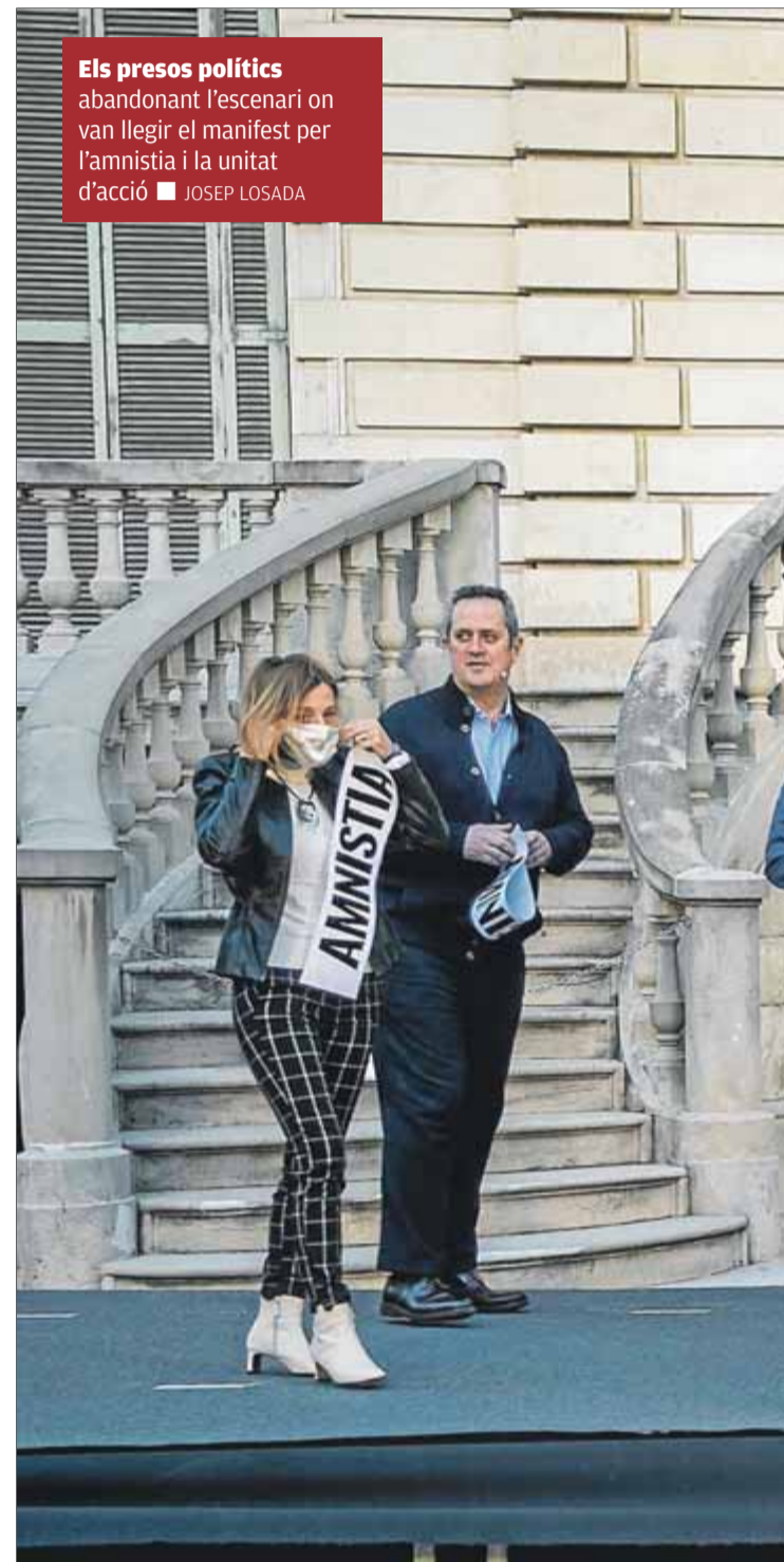
Els presos polítics abandonant l'escenari on van llegir el manifest per l'amnistia i la unitat d'acció

Amb l'obligatorietat d'anar a votar, tot i la pandè-