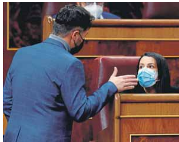
Ruffián (ERC) i Inés Arrimadas (Cs), conversant a l'hemicicle del Congrés durant l'últim ple ■

Una setmana després de negar-li el suport al de-