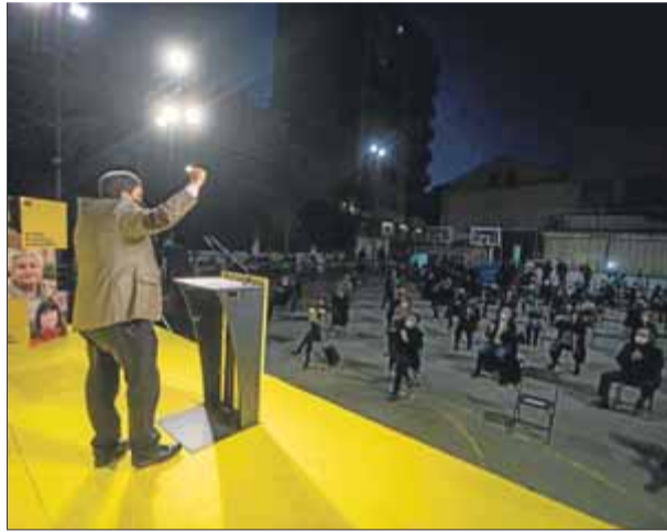
Junqueras, ahir a la tarda a l'Hospitalet

Les intervencions, des de la primera, d'Oriol Junqueras, van tenir com a fil conductor la corrupció. El