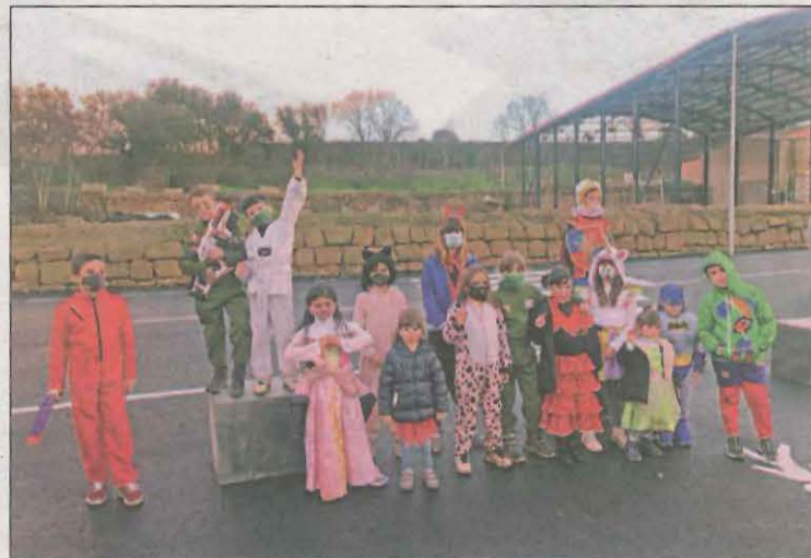
Imatge dels nens i nenes de l'escola disfressats

El municipi de Montgai, a la Noguera, va celebrar el seu carnestoltes, tot respectant les mesures de seguretat decretades pel Departament de Salut per evitar la propagació del coronavirus. Alguns dels que van decidir participar en aquesta festa van ser els alumnes de l'escola La Colomina de la població.