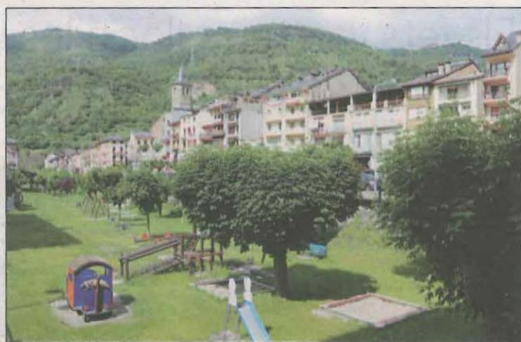
Sort és una de les localitats que s'ha adherit al programa

Concretament, del Pirineu hi opten municipis de l'Alta Ribagorça (el Pont de Suert), de l'Alt Urgell (Peramola i Josa i Tuixén), del Pallars Jussà (Isona i Conca Dellà i la Torre de Cabdella), del Pallars Sobirà (Alins, Alt Àneu, Baix Pallars, Lladorre, Soriguera, Sort i la Guingueta d'Àneu), la Cerdanya (Lles i Prats i Sansor) i de la Val d'Aran (Vilamòs). Pel que fa a la Plana de Lleida, s'hi han adherit municipis de la Noguera (la Sen-