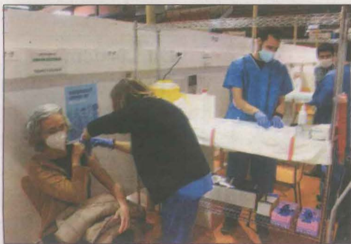
Vacunació de personal docent ahir a Lleida

L'Escola de Tartareu ZER Montsec de les Avellaneres i Santa Linya continua tancada, amb el seu únic grup confinat, i l'Escola Vedruna de Mollerussa, tot i que està oberta, és la que té més grups confinats, amb sis.