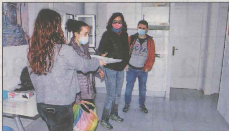
Prova de com repartir el menjar de forma segura