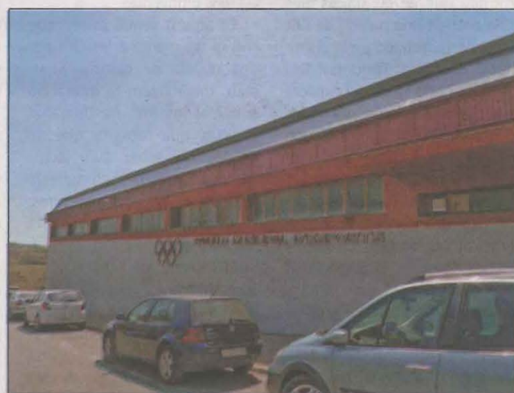
El pavelló municipal de Solsona, tancat des d'ahir

227 denúncies per no dur la mascareta adequadament posada, 3 en la darrera setmana. Pel que fa a l'incompliment de la mobilitat, s'han posat un total de 139 denúncies, mentre que pel que fa a infringir la normativa de reunions s'han posat un total de 9 denúncies des que va entrar en vigor. Quant a les actes aixecades a bars per incompliment de la normativa, se n'han posat un total de 19, onze a titulars d'establiments i vuit a clientela.