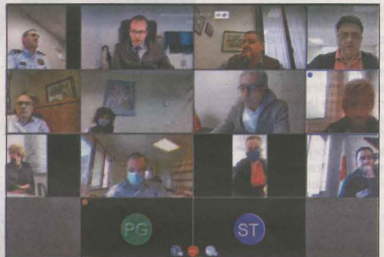
Reunió telemàtica del Comitè d'Emergència

en relleu que actualment a Mollerussa hi ha tretze grups escolars confinats, 8 a Primària i 5 a Secundària, situació que també preocupa. En aquest sentit, des del CAP de Mollerussa es torna a insistir en la necessitat de fer bé les quarantenes que determinen els professionals sanitaris, ja que s'ha detectat que hi ha incompliment en determinats casos.