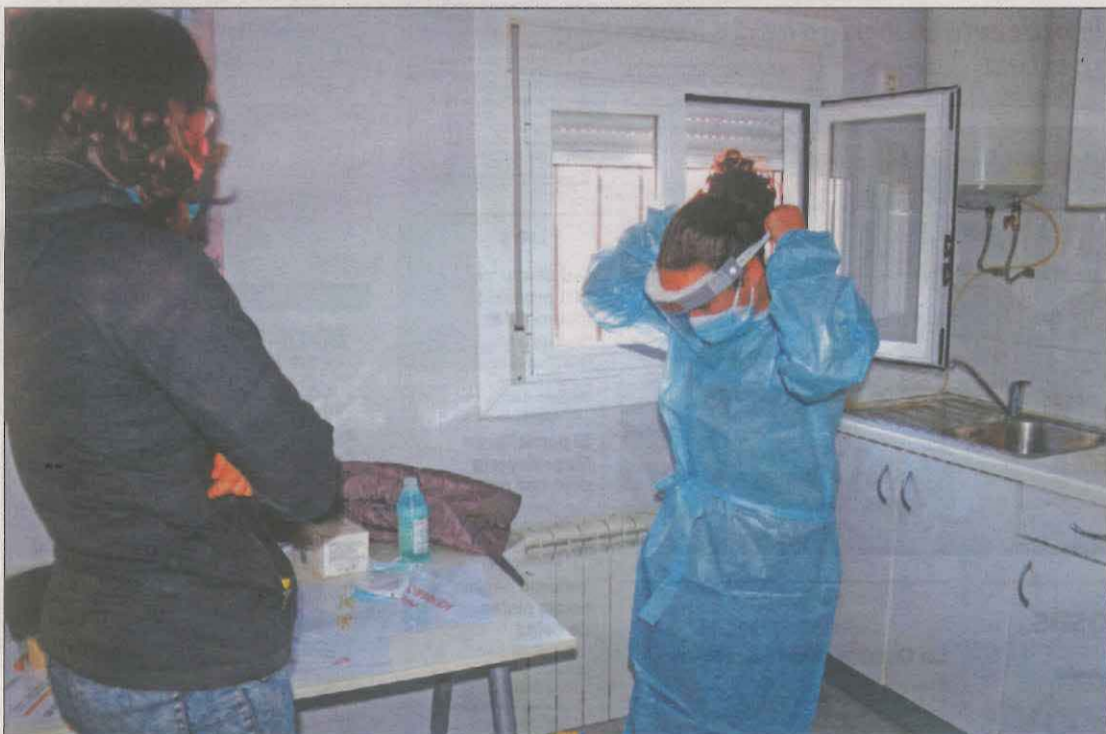
Técnicos de residencias participaron ayer en una formación para prevenir el Covid-19

La Audiencia confirmó ayer dos años y medio por amenazas a un testigo en un juicio. Por otra parte, el juez dejó en libertad provisional a los siete detenidos el martes. Ayer no hubo que lamentar incidentes en Lleida. LOCAL | PÁG. 11