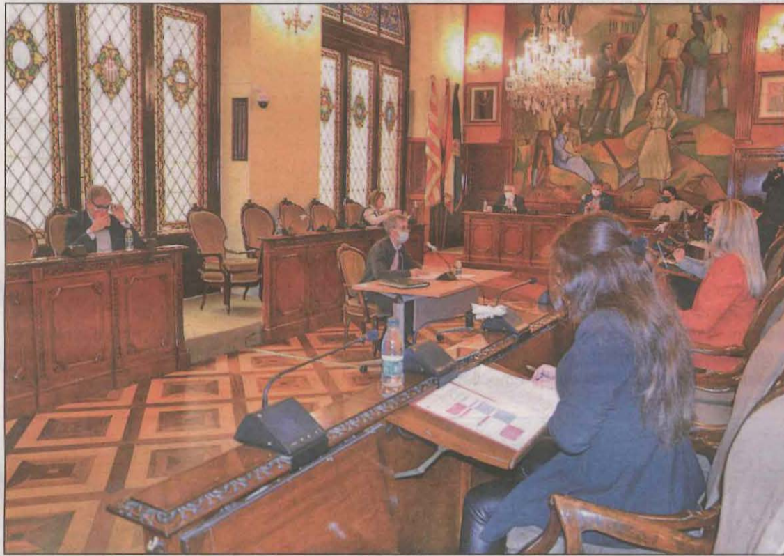
Imatge de la sessió plenària del mes de febrer celebrada ahir