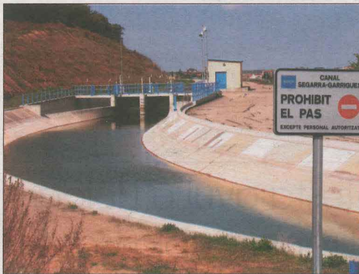
Creuen que s'està produint una inflació del preu de la terra