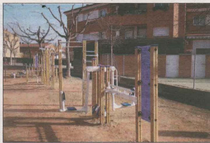
L'equipament vol potenciar l'exercici físic de la població

L'Ajuntament de Solsona i la Fundació Volem Feina han renovat el conveni per regular el trànsit a les escoles amb agents cívics. La Fundació té contractades algunes persones que, una vegada han rebut una formació teòrica i pràctica específica per part de la Policia Local, exerceixen d'agents cívics per regular el trànsit a les entrades i sortides escoles de primària de Solsona. L'Ajuntament i l'entitat han renovat el conveni fins al 2022, inclòs, per donar continuïtat als acords sobre la figura del'agent cívic, creada el 2014.