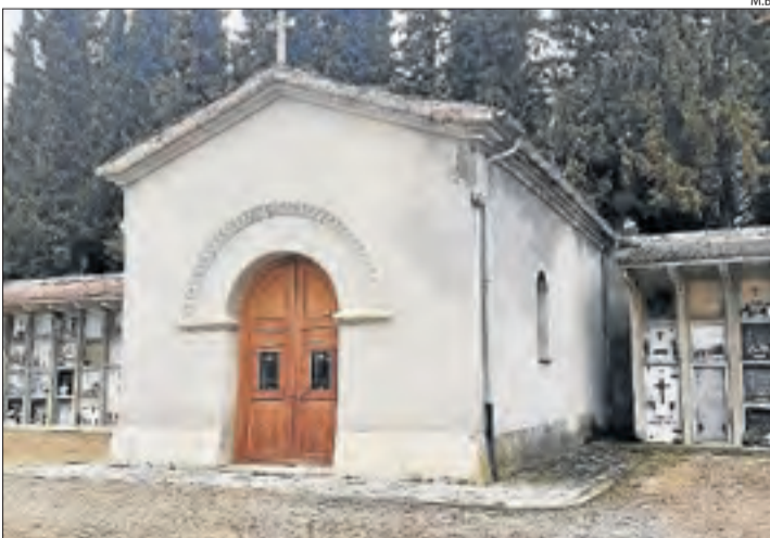
La capella que s'habilitarà com a sala aconfessional.