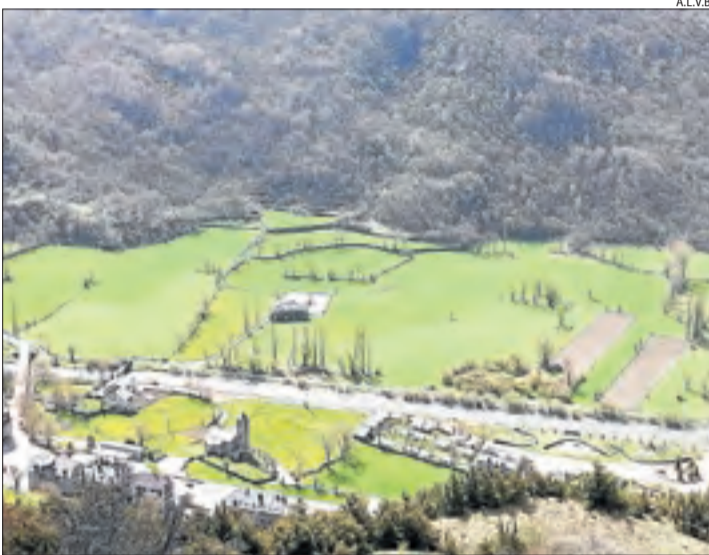
Les pastures on se celebrarà el concurs.

En aquest sentit, acollirà tallers i demostracions dedicats al maneig dels ramats i al pasturatge de vaques, així com xarrades sobre activitats