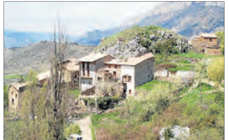
L'escola d'Espluga de Serra està confinada.

Tancada l'escola Espluga de Serra de Tremp || Ja són quatre els centres confinats a Lleida