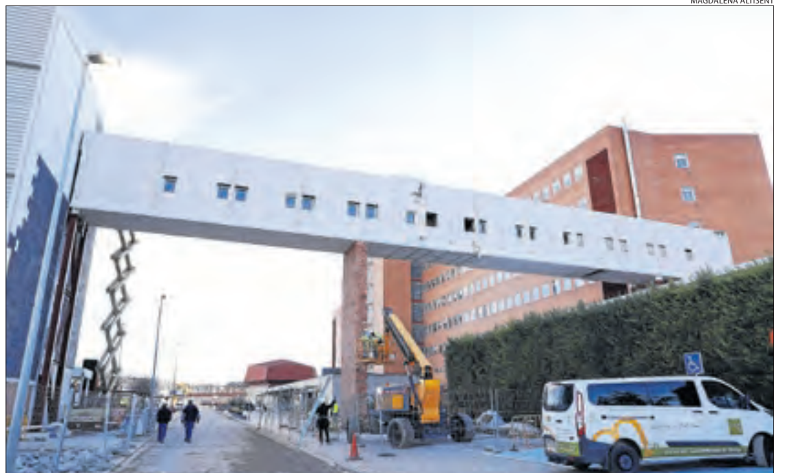
Obres d'instal·lació de la passarel·la que connecta el nou edifici amb el principal de l'Arnau.

(2) 629 segons l'estadística d'AQuAS (3) Amb la segona dosi