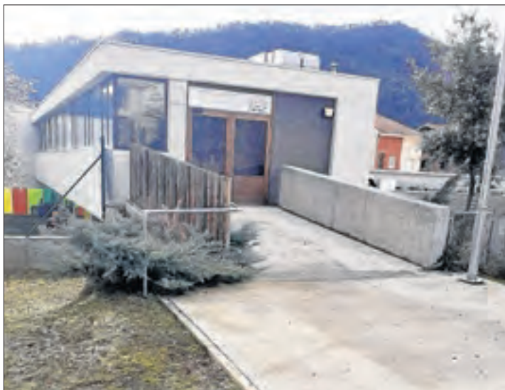
Les instal·lacions de la ludoteca, tancades en l'actualitat.