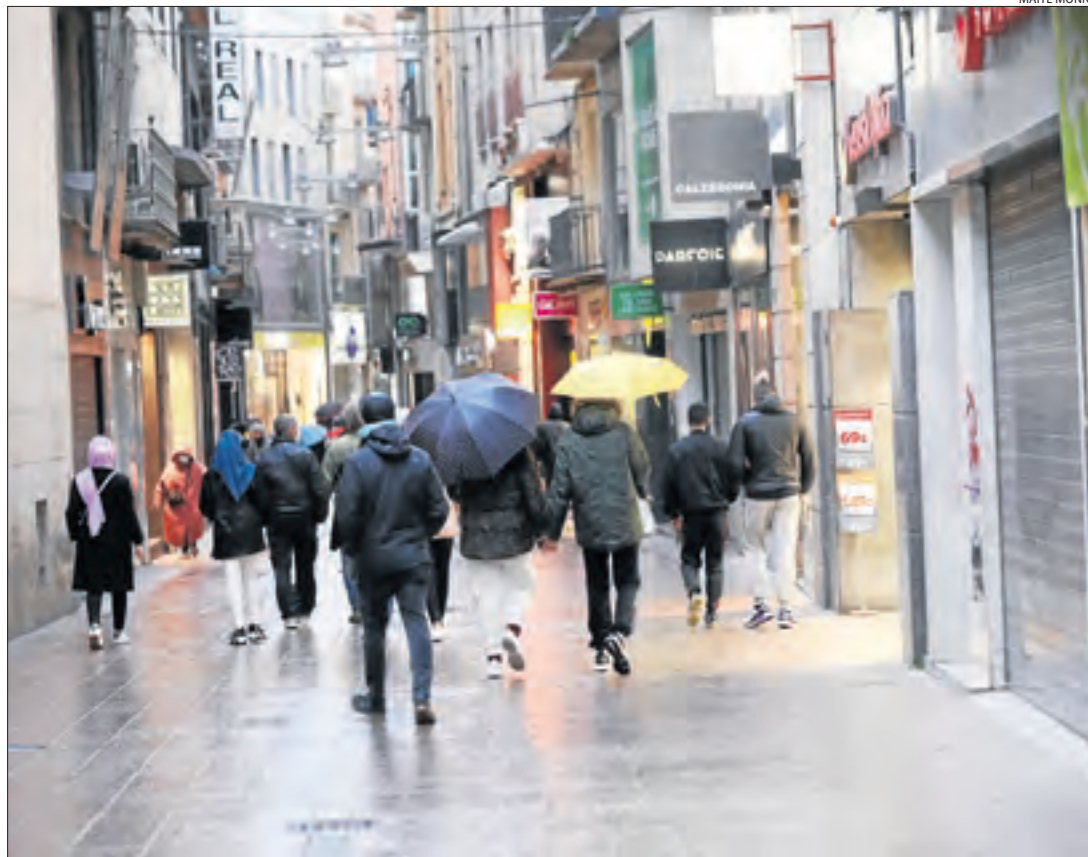
L'Eix Comercial de Lleida, ahir a la tarda amb la gran majoria d'establiments tancats.

Associacions del sector alerten que poden perdre per sempre part de la clientela || Qualifiquen la situació de “desesperant”