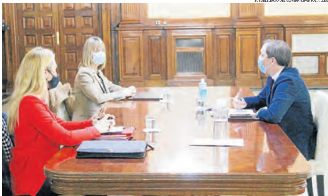
SUBDELEGACIÓ DEL GOVERN ESPANYOL A LLEIDA

A les oficines de Lleida, Balaguer i Tàrraga ja hi havia el servei de vigilància, però no a les de Solsona, Tremp, la Seu d'Urgell i Vielha, on es va haver de crear des de zero. De tal manera que, des de mitjans de juny de l'any passat, quan van reobrir els serveis d'ocupació, fins al