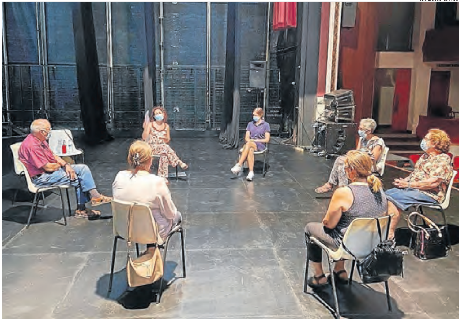
Una de les sessions presencials organitzades pel grup de Servei al Dol de Ponent, en aquest cas a Mollerussa.