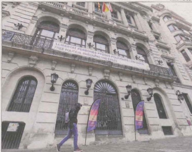
Pancarta que la Paeria ha de retirar fins després de les eleccions.

R. R. |LLEIDA| La Paeria de Lleida i els ajuntaments d'Alcarràs, Torrefarrera i Almatret estan obligats a retirar dels seus edificis pancartes que reclamen la llibertat dels presos i exiliats del procés. Resolucions de la junta electoral de zona de Lleida els van donar ahir 48 hores per fer-ho, arran de recursos que va presentar Cs al considerar que són "símbols partidistes". Com ha succeït en comicis anteriors, podran tornar a desplegar-les una vegada acabïn les eleccions al Parlament.