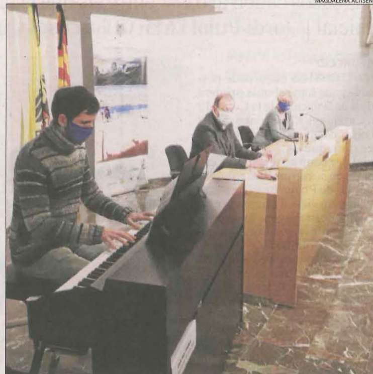
Imatge dels representants institucionals que van participar en l'homenatge a les víctimes del Jussà.