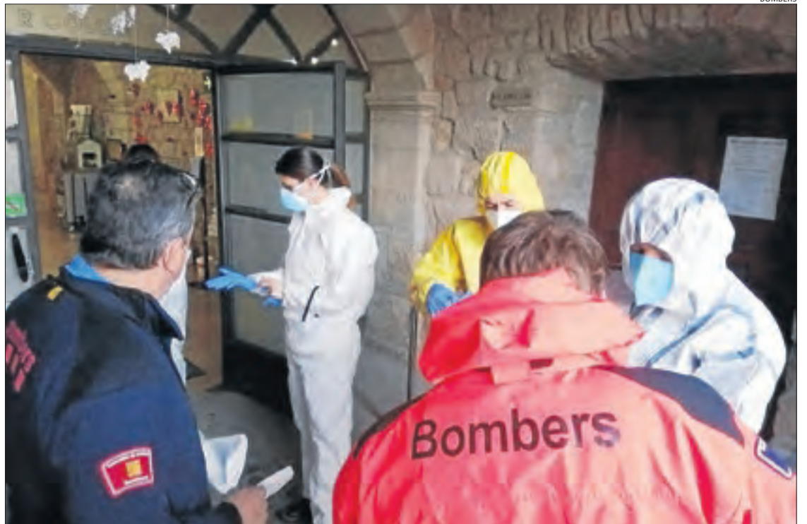
Els bombers van anar dilluns a la residència de gent gran de Solsona.

■ D'altra banda, només 6 residències de Lleida, totes a les comarques del pla, tenen positius, però estan sota control, i el centre està sectoritzat.