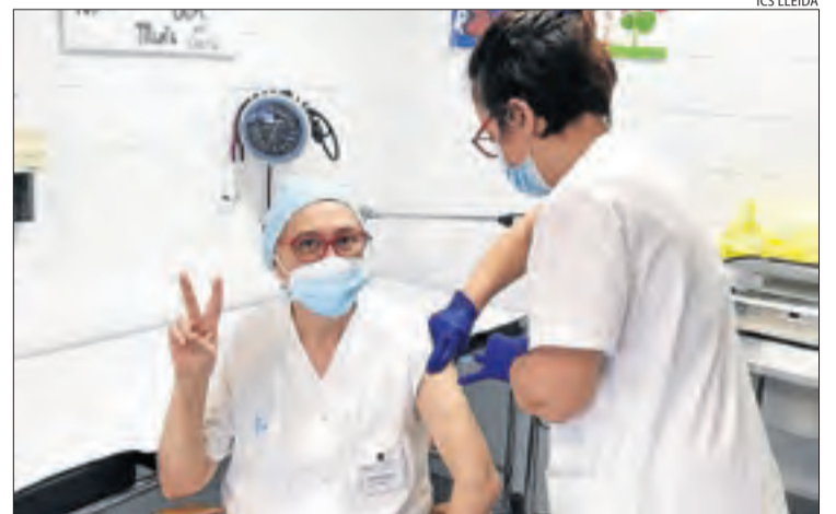
Una sanitària del CAP d'Almacelles celebra rebre la vacuna.