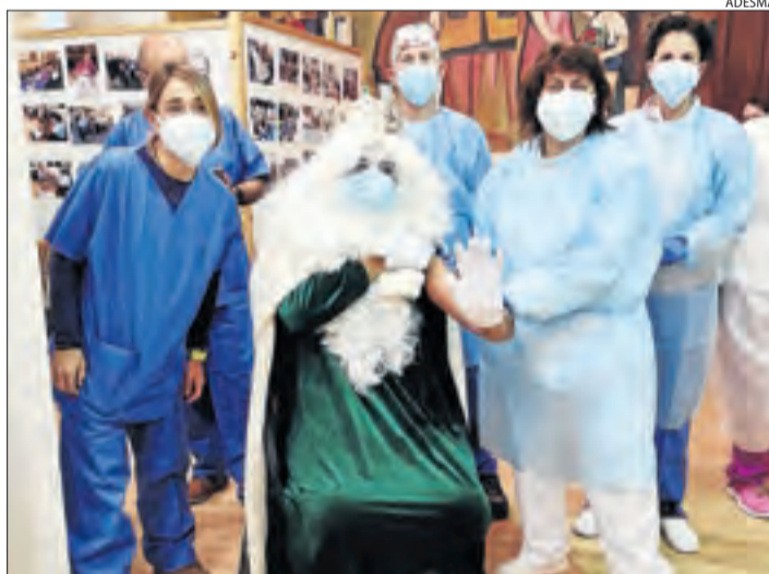
El rei Melcior vacunant-se a la residència d'Adesma.