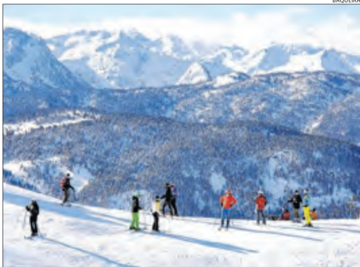
Esquiadors a Baqueira durant les festes de Nadal.

pació del sector davant les noves mesures. En aquesta línia, Baqueira va dir que continuarà oberta, però des de dilluns només estarà operatiu el sector de Baqueira amb 33 pistes. Quan s'aixequin les noves mesures estudiaran reobrir. Tavascan obrirà, així com Boi Taüll, Espot i Port Ainé.