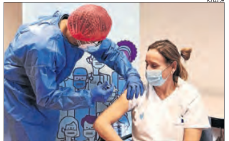
Els professionals del CAP de la Pobla van ser vacunats.