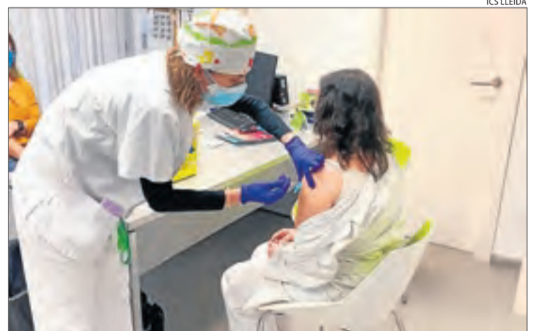
Personal del CAP de les Borges també va rebre ahir la vacuna.