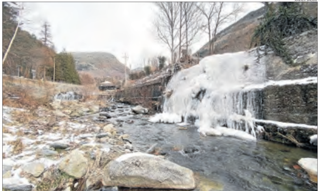
Estalactites al curs del riu Flamisell, a la Pobla de Segur, on es van registrar 9 graus sota zero.