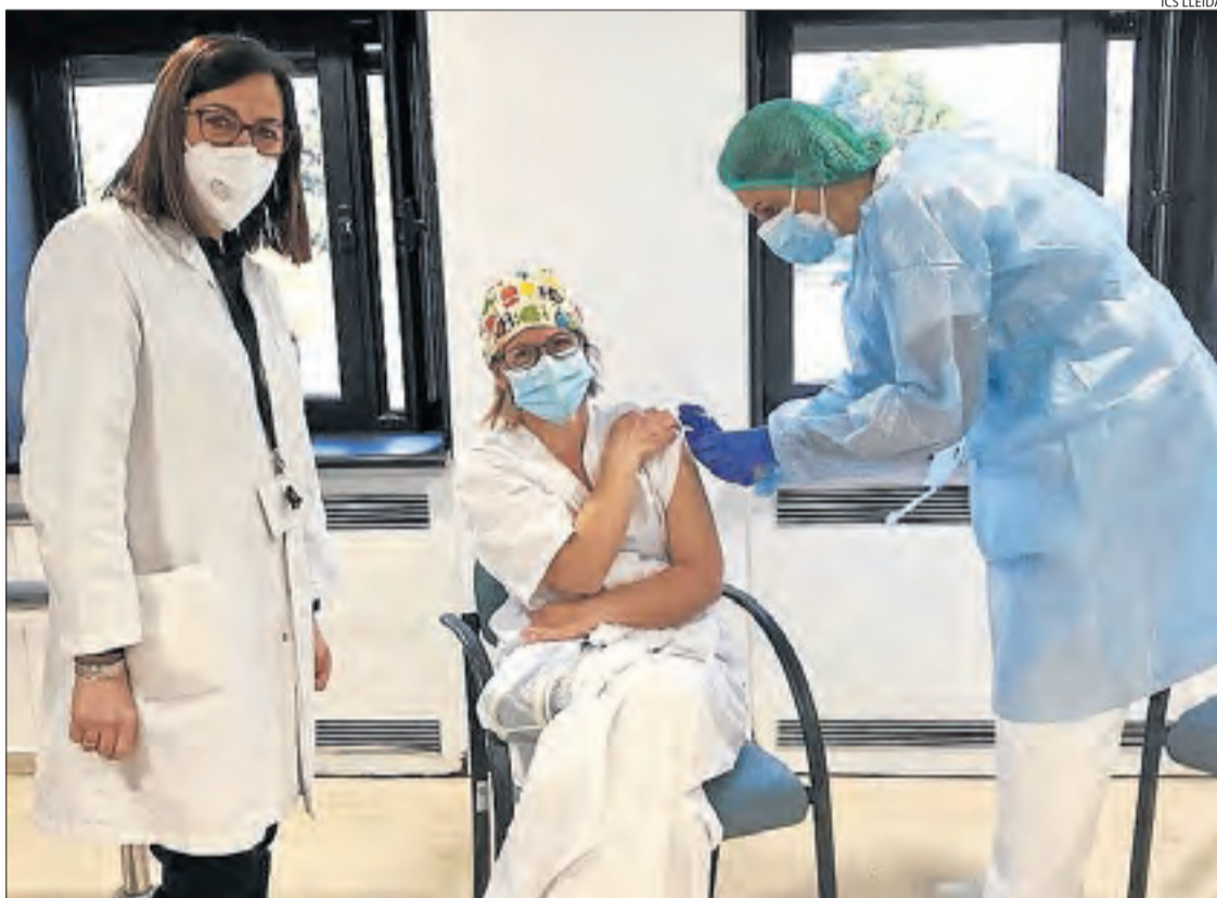
Una sanitària del Santa Maria rep la seva primera dosi de la vacuna.

Més de 1.440 professionals d'hospitals i Atenció Primària demanen rebre la dosi