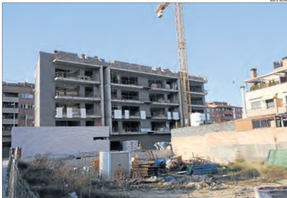
Un edifici en construcció a la ciutat de Lleida.

Quant a les vendes, el balanç dels promotors determina que en els primers nou mesos del 2020 van baixar una mitjana del 17% a la demarcació de Lleida. Per tipologia, hi va haver 437 vendes de pisos d'obra nova, la qual cosa significa un 24,7% menys que en el mateix període de l'any anterior, quan n'hi va haver 580. A la capital van ser 233, un 27,9% menys (323). Les de segona mà van ser moltes més, 1.986, però també