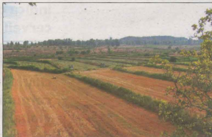
Trenca / Imatge d'arxiu de la finca de Torrerià

El projecte se centrarà en dos dels espais protegits més valuosos de la Plana de Lleida, la finca agrària de Torrerià i la Timoneda d'Alfés, tots dos pertanyents a la Xarxa Natura 2000. El primer és l'última àrea de cria a la península ibèrica de la trenca, un petit ocell migrador considerat el més escàs de la fauna ibèrica. El segon, on se situava l'antic aeròdrom d'Alfés, és un ecosistema