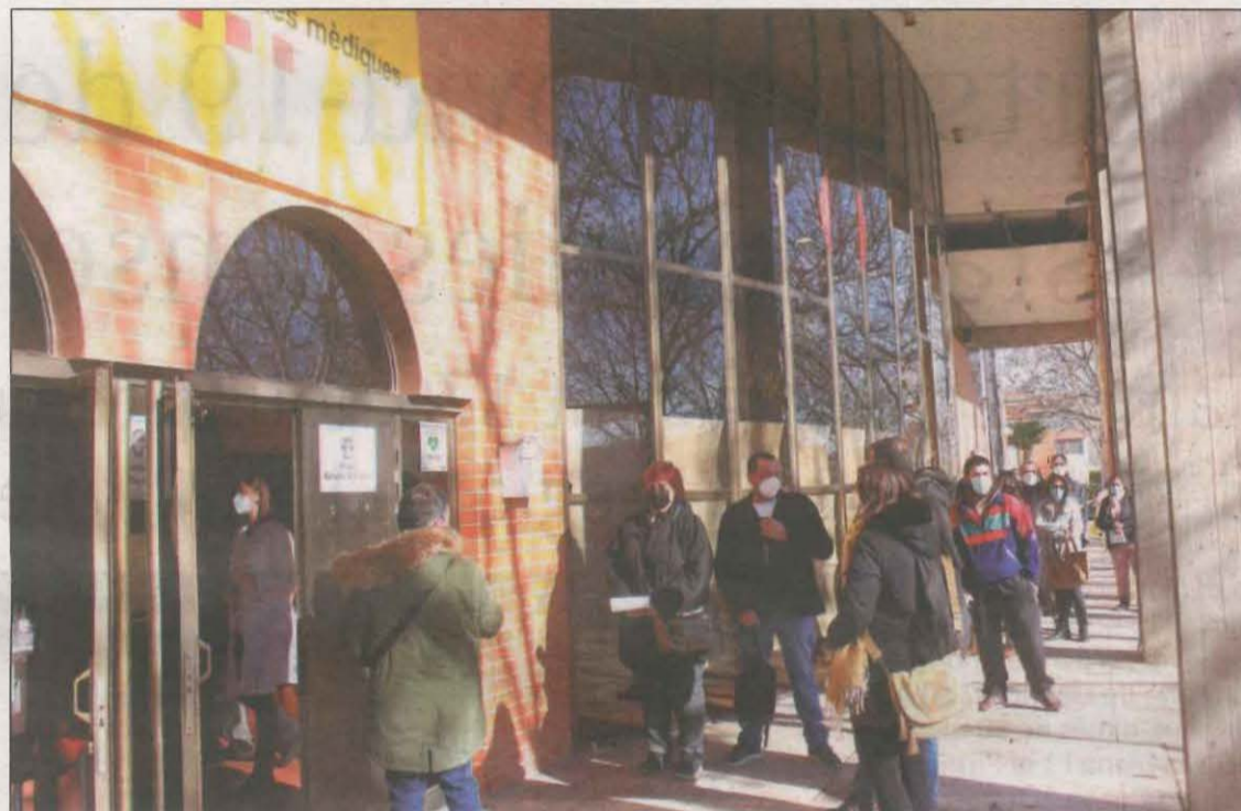
Treballadors de residències i personal sanitari fent cua per vacunar-se al pavelló

Farreny també va agrair la disposició de la Paeria, que ha decidit prorrogar la cessió de l'equipament a Salut fins al pròxim mes de setembre per facilitar la campanya de vacunació i continuar amb els cribratges als grups escolars. Cal recordar que des del mes d'abril, aquest equipament municipal s'ha dedicat exclusivament a usos sanitaris per fer front a la pandèmia. Al mes d'abril, s'hi van ubicar 45 llits per acollir pacients si el nombre d'ingressats