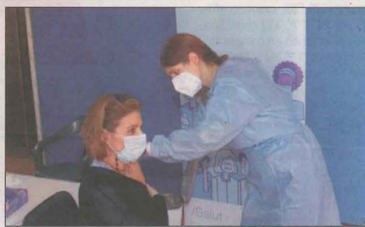
Una dona rebent el vaccí contra el Covid-19