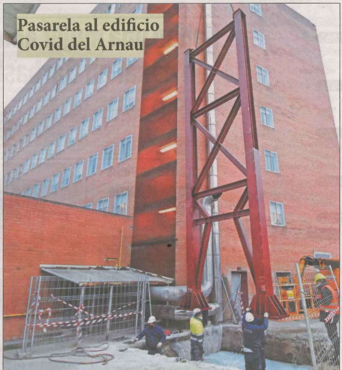
Unos operarios colocaban ayer la primera columna de la nueva infraestructura del hospital

Arranca la Marató de Donants de Sang con 65 participantes