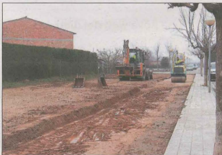
El passeig tindrà 15.000 m2 de zona verda

Torrefarrera tindrà un nou espai a l'aire lliure gràcies al passeig verd que l'Ajuntament està adequant en un terreny ubicat al límit oriental del nucli urbà, paral·lel al carrer Mossèn Cinto, en una zona qualificada com a verda. El passeig tindrà 15.000 m2 de zona verda i el cost de la primera fase és 30.000 €.