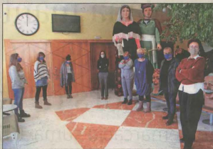
Minut de silenci al vestíbul de l'Ajuntament de Tremp

Al vestíbul de l'Ajuntament de Tremp, aquest divendres, es va celebrar un minut de silenci i es va animar a tots els veïns a fer el mateix al seu lloc de treball a les dotze del migdia. El consistori va decretar tres dies de dol oficial i des d'aquest dijous al balcó de l'Ajuntament hi llueix l'escut de Tremp amb un crespó negre.