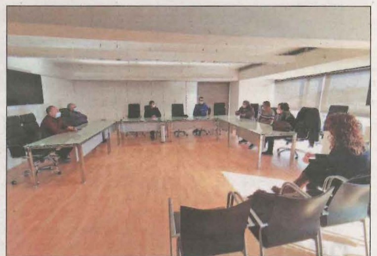
Imatge de la reunió que va tenir lloc ahir a Alcarràs

La trobada d'aquest 8 de gener arriba després de trametre el consistori a finals de desembre un seguit de cartes dirigides al vicepresident de la Generalitat i a diverses institucions. "Tenim clar que cal recuperar el llegat del President Macià al nostre poble, però ens fa falta l'ajuda d'altres administracions perquè no podem fer-ho sols. La situació que ens vam trobar les finances municipals és la que és i, per posar en valor la Casa de Vallmanya i mantenir alhora els serveis, necessitem un compromís d'inversió per part de les administracions".