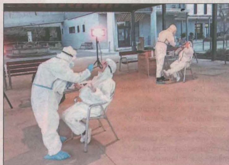
Imatges del cribratge al personal del centre geriàtric

Des del comitè de seguiment del brot estan estudiant l'oferiment del Gremi d'Hostaleria del Solsonès que els hi ha ofert places d'allotjament dels seus establiments associats en cas que facin falta llits per atendre els