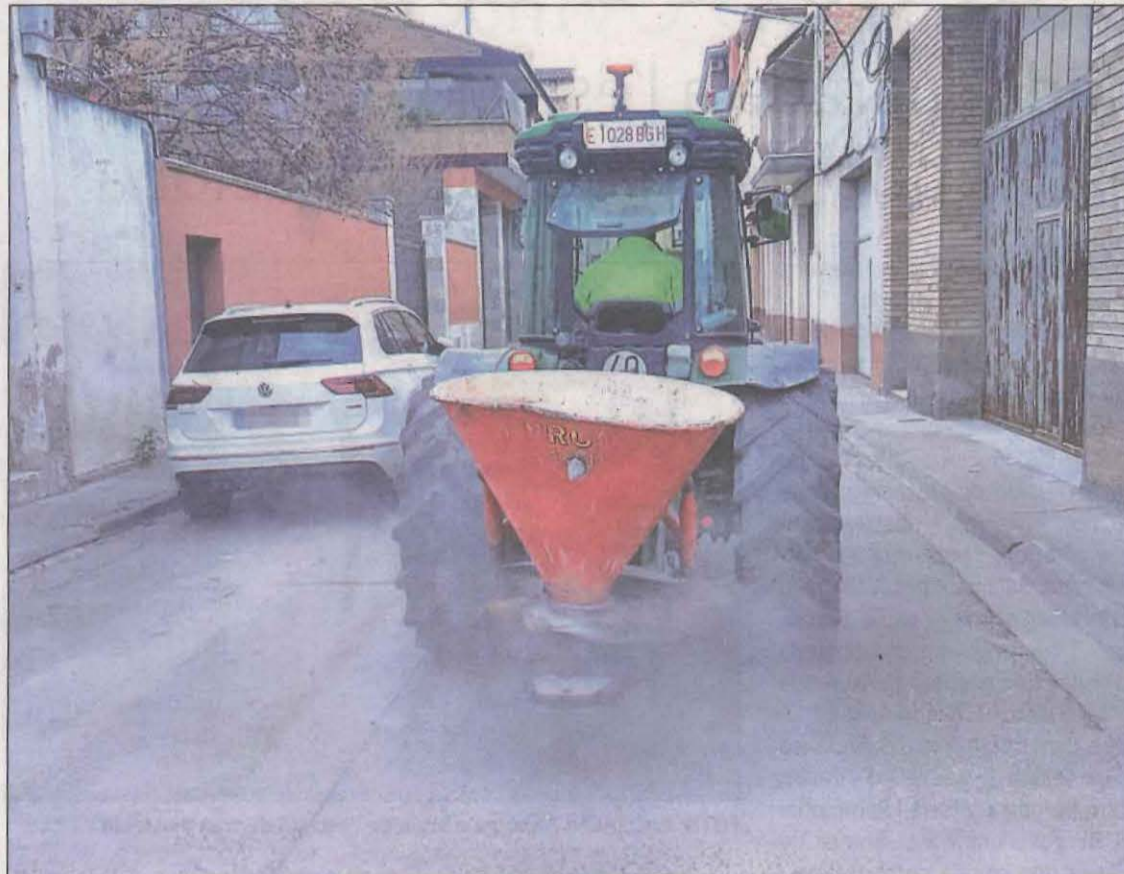
FOTO: A. d'Aitona / Moment en què un tractor llançava sal pels carrer d'Aitona davant la possible nevada

S'espera que els gruijos de neu superin els 30 cm a les muntanyes de Tarragona. A la resta de zones de muntanya se superaran els 20 o els 30 cm i en general, a l'interior, gruijos acumulats d'entre 5 i 15 cm de neu. Al nord de Ponent i comarques de Barcelona i Girona es podran acumular gruijos de neu de més de 2 cm per damunt dels 300 metres i més de