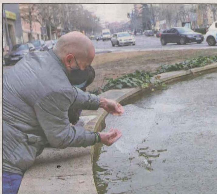
La fuente de Lluís Companys, totalmente helada