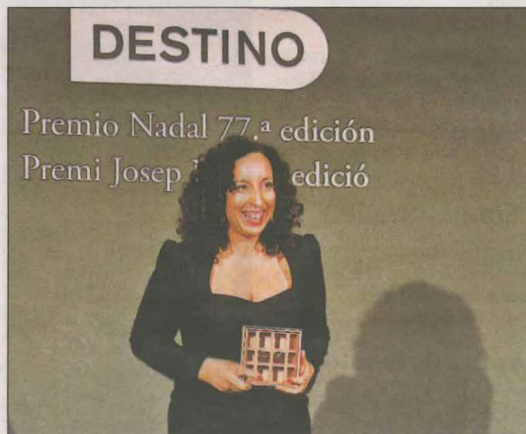
Les dues obres es publicaran al mes de febrer

Les especials circumstàncies que es viuen i que han fet que s'acceptessin només obres en format digital, la convocatòria d'enguany ha aconseguit una altíssima participació, amb una xifra rècord de 1.044 obres al Premi Nadal, dotat amb 18.000 euros, i una seixantena al Premi Josep Pla, que té una dotació econòmica de 6.000 euros.