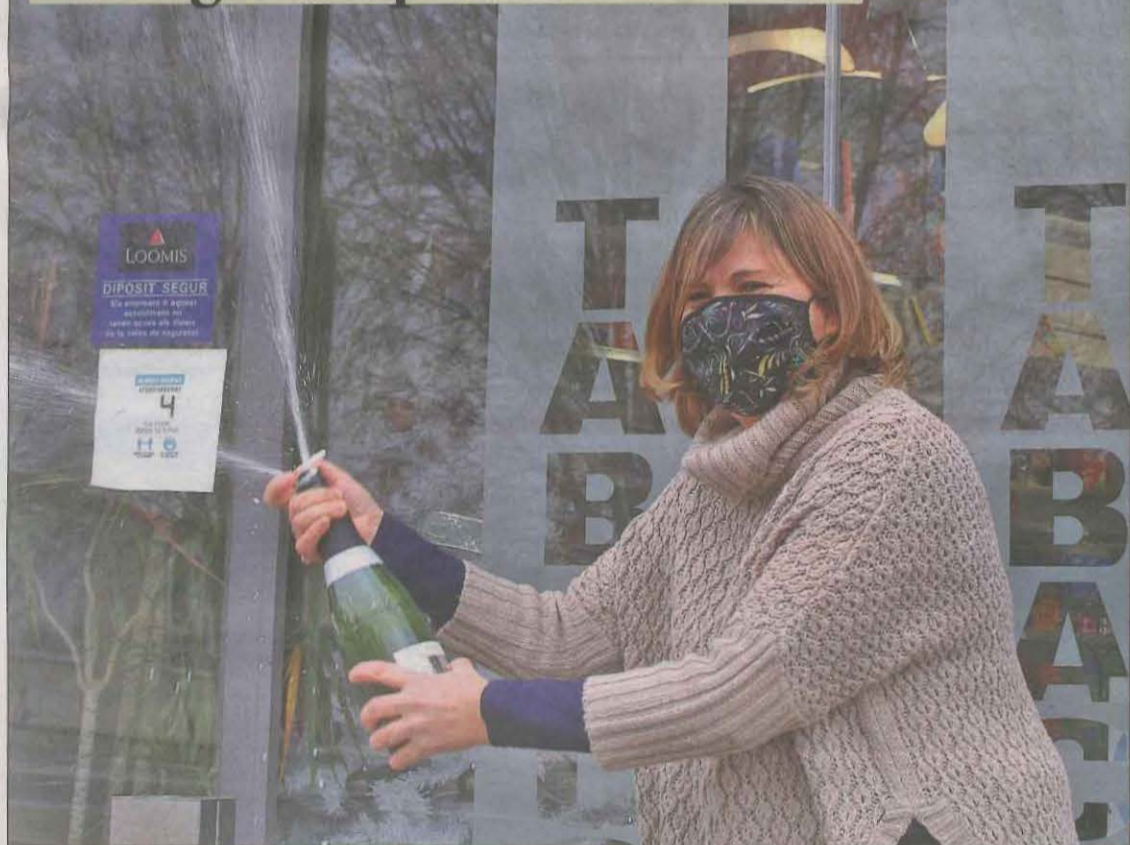
Además de Magraners también se vendió el tercero en el Carrefour y Les LLEIDA | PÁG.10-11