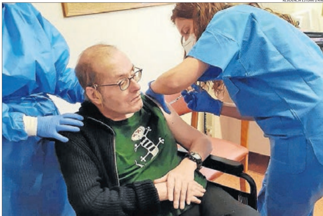
Una infermera subministra una dosi de la vacuna a un usuari de la residència d'Esterrí d'Àneu, ahir.