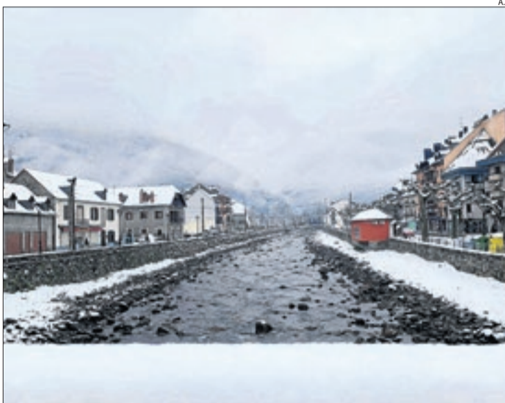
Vista de Bossòst i del riu Garona ahir.