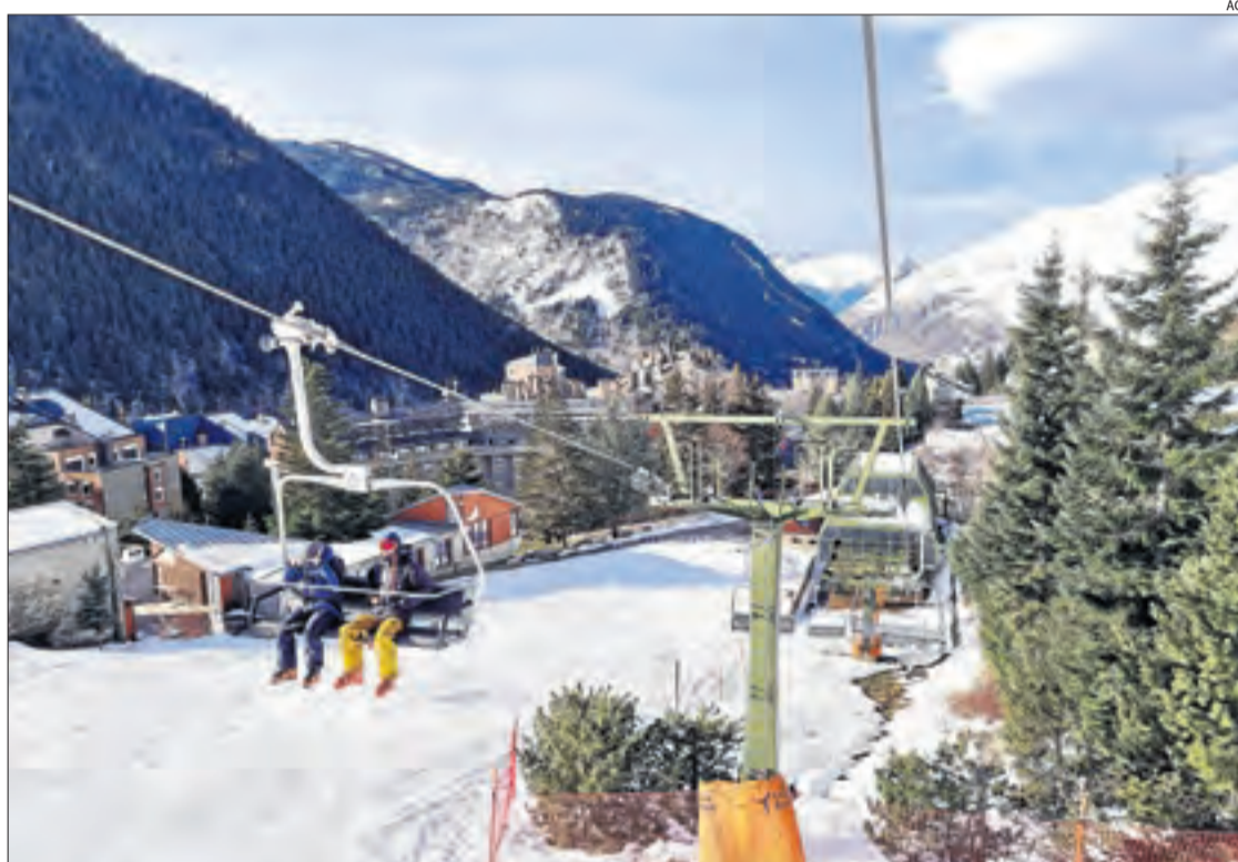
Imatge recent de Baqueira, que ha obert fins ara la meitat del domini esquiable.

Baqueira té de moment la meitat del domini esquiable obert i va afirmar que ha incorporat fins ara el 70% de la seua plantilla habitual durant la temporada. Va puntualitzar que ha inclòs la resta en un ERTO "a l'espera que es pugui incorporar amb el retorn gradual de l'estació a la normalitat". L'objectiu, va recordar, és "obrir progressivament l'oferta de neu i serveis a mesura que la desescalada de les restriccions es faci efectiva". Les limitacions actuals a la mobilitat impedeixen l'arribada d'esquiadors de Madrid, el País Basc i França, els seus principals clients. Al marge de l'estació, hotels de la Val d'Aran com els de les