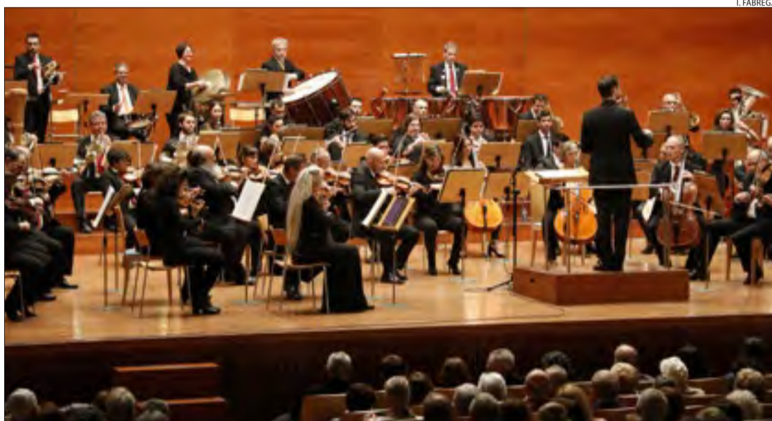
La Simfònica del Vallès se centrarà enguany en la transició de l'òpera vienesa a la sarsuela catalana.

Quant a un altre equipament lleidatà, La Llotja, aposta pel circ i la fantasia. El 27, Producció Nacional de Circ portarà a escena Estat d'Emergència , que pretén mostrar a través del circ una visió del món i com els joves artistes afronten els problemes d'un planeta a punt de col·lapsar-se.