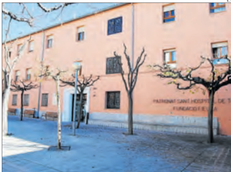
Imatge del passat dia 2 de la residència Fiella de Tremp.