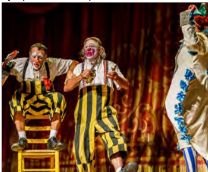
Tortell Poltrona ret homenatge als pallasos clàssics.

Emprant objectes de proporcions impossibles, la Cia. Manolo Alcántara proposa un muntatge que difumina fronteres entre realitat i fantasia