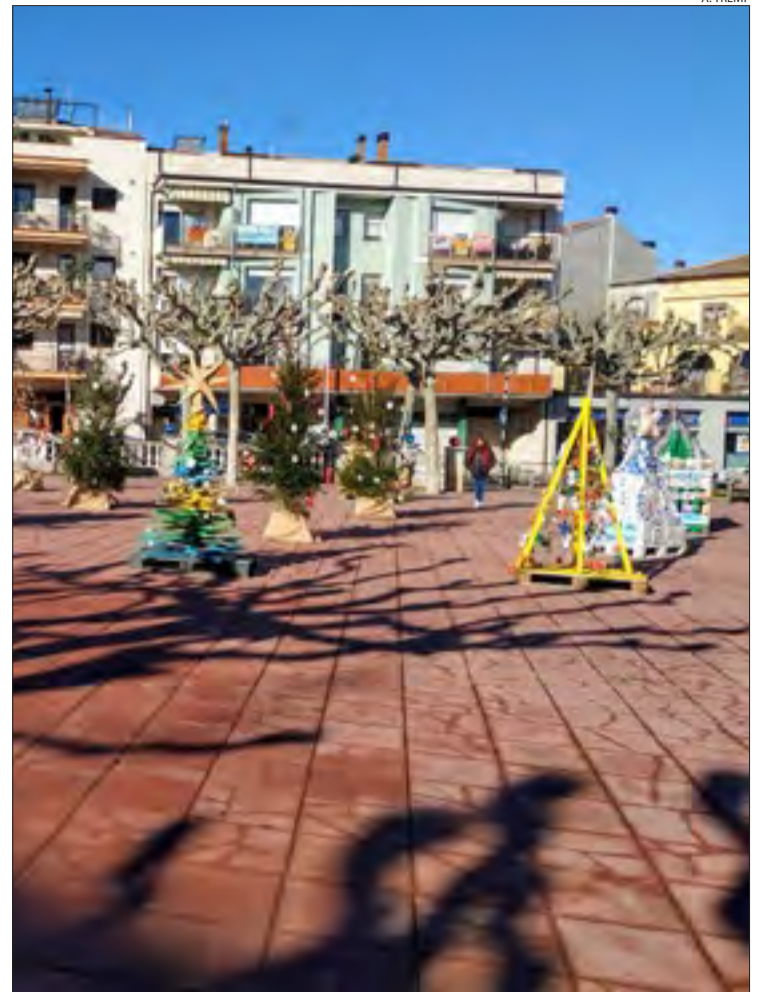
A Tremp, el bosc dels desitjos està configurat amb peces reciclades.

ra fons per a La Marató de TV3. Qui vulgui una alternativa més mogudeta, a Cervera li espera el mateix dia 3 una gimcana familiar (i el 28 una infantil) que permetrà descobrir els racons de la ciutat. Una descoberta urbana que comparteix amb la ruta guiada gratuïta, programada a Sort els dies 2 i 3. O les visites comentades a l'església de Sant Víctor a Saurí (dia 27). Solsona munta visites guiades del 26 al 31, per descobrir els indrets més emblemàtics. Apel·la a la història Bellpuig, amb una ofrena floral a la memòria històrica i a les víctimes de la Guerra Civil programada per al dia 4.