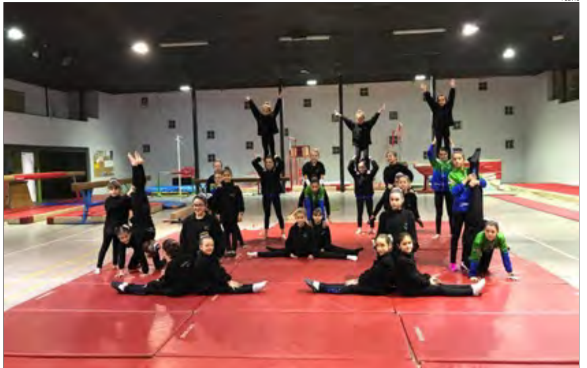
Fedac convida a endinsar-se al món de la gimnàstica rítmica.

proposta semblant és la de la secció del Sícoris Club, amb dos torns, del 22 al 24 i del 28 al 31. Un altre centre, l'Ekke, proposa unes estades plenes de diversió, esport i salut als nens d'entre 3 i 12 anys. Als escolars també està encarat el campus de Trèvol, on se'ls convida a treure tot el suc al pàdel, les piscines, multiesports i a fer manualitats. Obre portes des del 22 fins al 7 de gener.