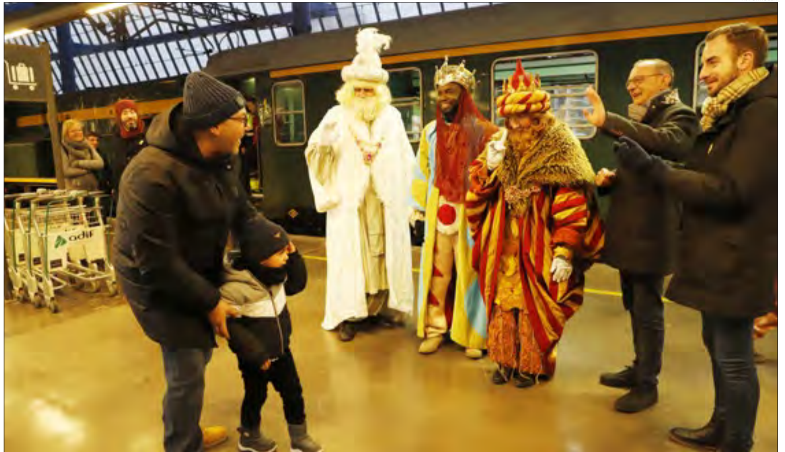
Enguany no està previst organitzar la Cavalcada de Reis, si bé s'ha treballat per garantir l'arribada de ses Majestats de manera segura.

Malgrat que els pessebres vivents han desaparegut d'escena per efecte de la Covid, altres tradicions lluiten per mantindre's. És el cas del Cant de la Sibila, que ressonarà a aquesta nit a la catedral de Santa Maria de la Seu d'Urgell, acompanyada de la missa del gall. Prèviament, a les set, se celebrarà la versió destinada als més petits, batejada com a Cant de la Sibilleta i Missa del Pollet. Té un punt més lúdic s l'Aixecada del Ninot, que puntual a la seua cita anual, arriba el dia dels Sants Innocents a la pista del Juncar de Tremp. Cal, però, inscriure's prèviament.