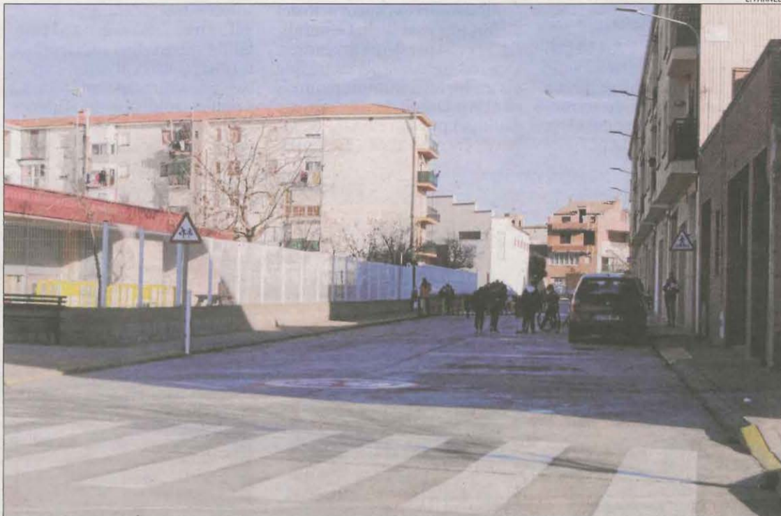
Només la meitat dels alumnes del col·legi van assistir ahir a les classes com a mesura de prevenció.

Segons Mases, la situació "encara està descontrolada i va apel·lar a la responsabilitat per frenar els contagis". Va demanar al Procicat que no es flexibilitzin mesures divendres