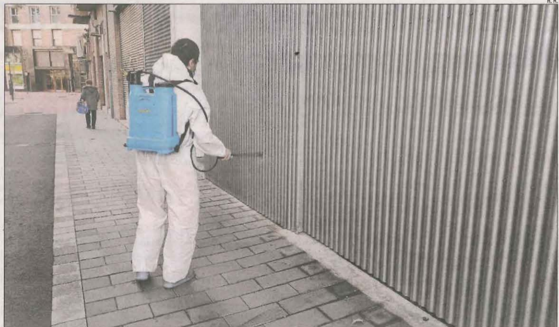
Desinfecció preventiva ahir de l'exterior d'una residència per a la tercera edat de Lleida ciutat.

D'altra banda, Agramunt ha donat per "controlat" el brot de-