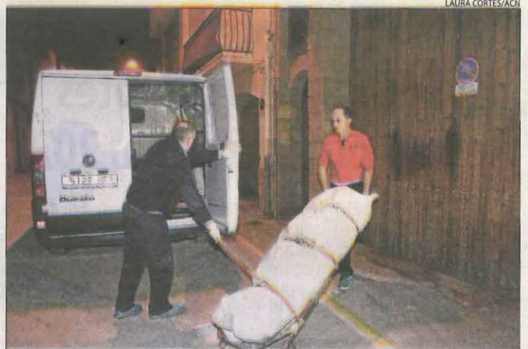
El crim va tenir lloc el desembre del 2018 a Artesa de Segre.