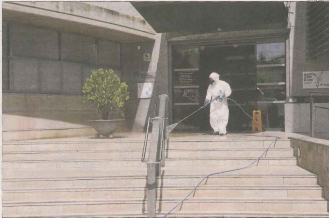
Imatge del mes d'abril passat, quan es desinfectaven de manera periòdica els hospitals.

Des del comitè d'empresa "no van entendre" com s'han pogut contagiar els treballadors, "ja que seguim totes les mesures de prevenció amb els equips de protecció" i també van denun-