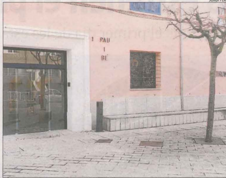
Imatge de la façana de la residència de la Fundació Fiella a Tremp.

rien "desaïllaments parcials" entre els usuaris, després que una primera usuària se n'anés amb la seua família la setmana passada al recuperar-se de la Covid. La consellera Alba Vergés va afirmar en roda de premsa que "encara no parlem de desconfinat" i que els 68 positius al centre "seguiran en aïllament". El primer cas es va registrar a la residència Fiella el 19 de novembre i no va ser fins al 29, deu dies més tard, quan es va organitzar una desinfecció a càrrec dels bombers.