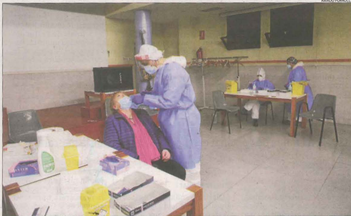
Una dona se sotmet a la prova al local social de la Mariola, ahir a la tarda.

LLEIDA | El complex de sales de cine JCA Alpicat del Grup Principal de Lleida va anunciar ahir a la pàgina web que tornarà a projectar pel·lícules a partir de divendres que ve, 18 de desembre. Encara que els cines i altres equipaments culturals podien reobrir portes des del passat 23 de novembre, el manteniment del confinament municipal de cap de setmana va frustrar tots els preparatius d'aquesta empresa lleidatana, ja que va considerar inviable econòmicament les projeccions de divendres a diumenge només per a veïns d'Alpicat. L'estrena ahir de les noves mesures anunciades pel Procicat, que comporten que el confinament de cap de setmana passa a ser de caràcter comarcal, dona d'aquesta forma llum verda per reobrir les sales de cine, que reben sobretot públic de la capital del Segrià. Val a destacar que el principal complex d'exhibició cinematogràfica de Lleida suma pràcticament cinc mesos de tancament des de la declaració de l'estat d'alarma a mitjans de març per la pandèmia. Va poder reobrir les sales el 26 de juny però va tornar a tancar el 13 de juliol amb el nou confinament del Segrià. El 4 d'agost va tornar a l'activitat, que es va frenar de nou el passat dia 30 d'octubre.