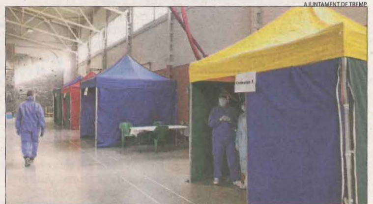
Nova jornada de tests a la capital del Pallars Jussà.