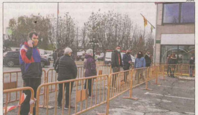
A Bellpuig ahir hi va haver cues i els tests segueixen aquest dimarts.

disposava ahir del nombre de proves), Bellpuig (650) i Tremp (235). En aquest últim cas la setmana passada ja es va portar a terme un altre cribratge davant de l'increment de contagis a la capital del Jussà.