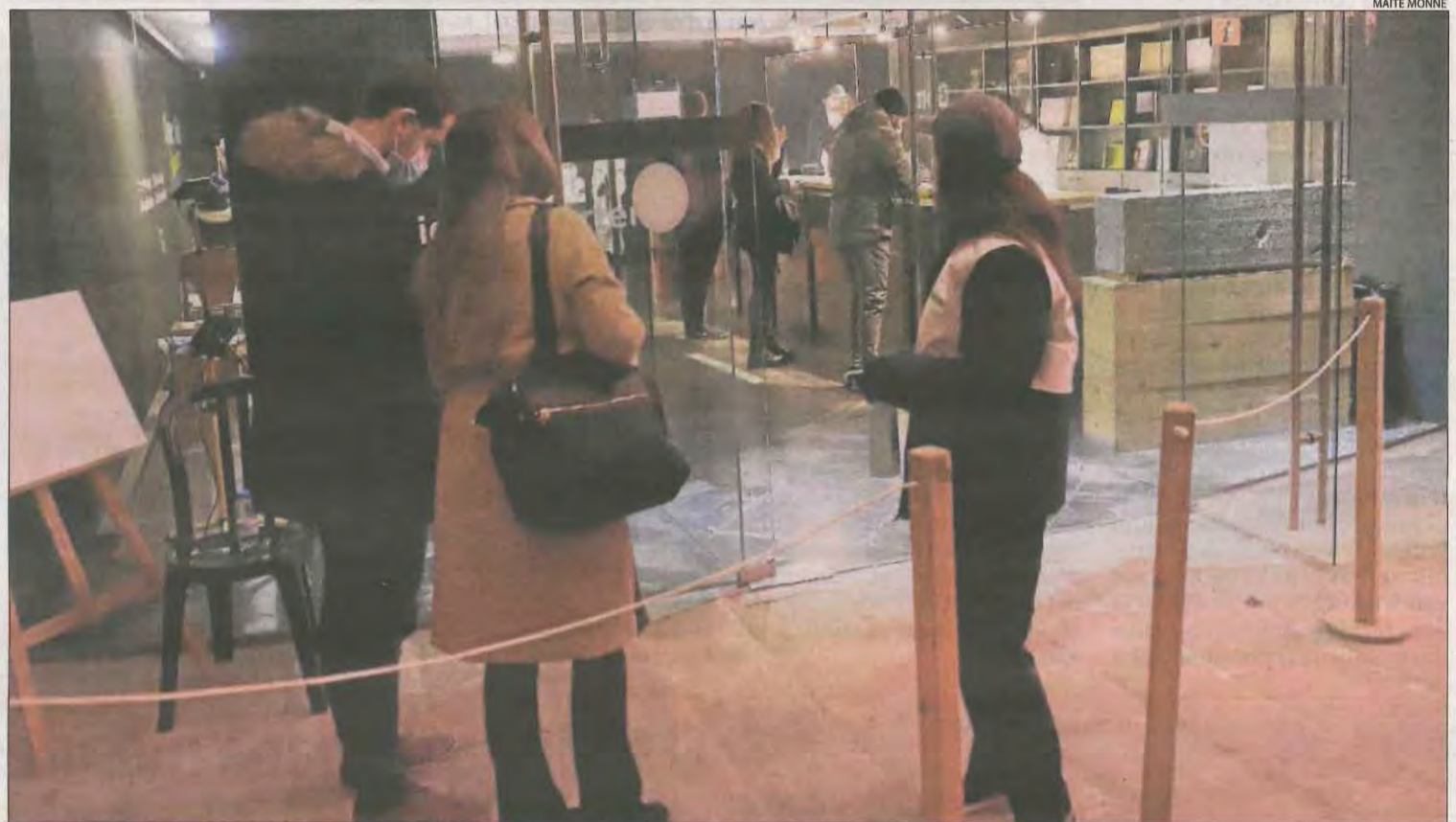
Imatge del segon dia del cribatge que es va dur a terme ahir a l'Institut d'Estudis Ilerdencs de Lleida ciutat.

Els segueixen Solsona (1,79), Mollerussa (1,7) i Tremp (1,6). Val a destacar que a mitjans de novembre eren 44 les localitats que tenien una velocitat de contagis superior a 1.