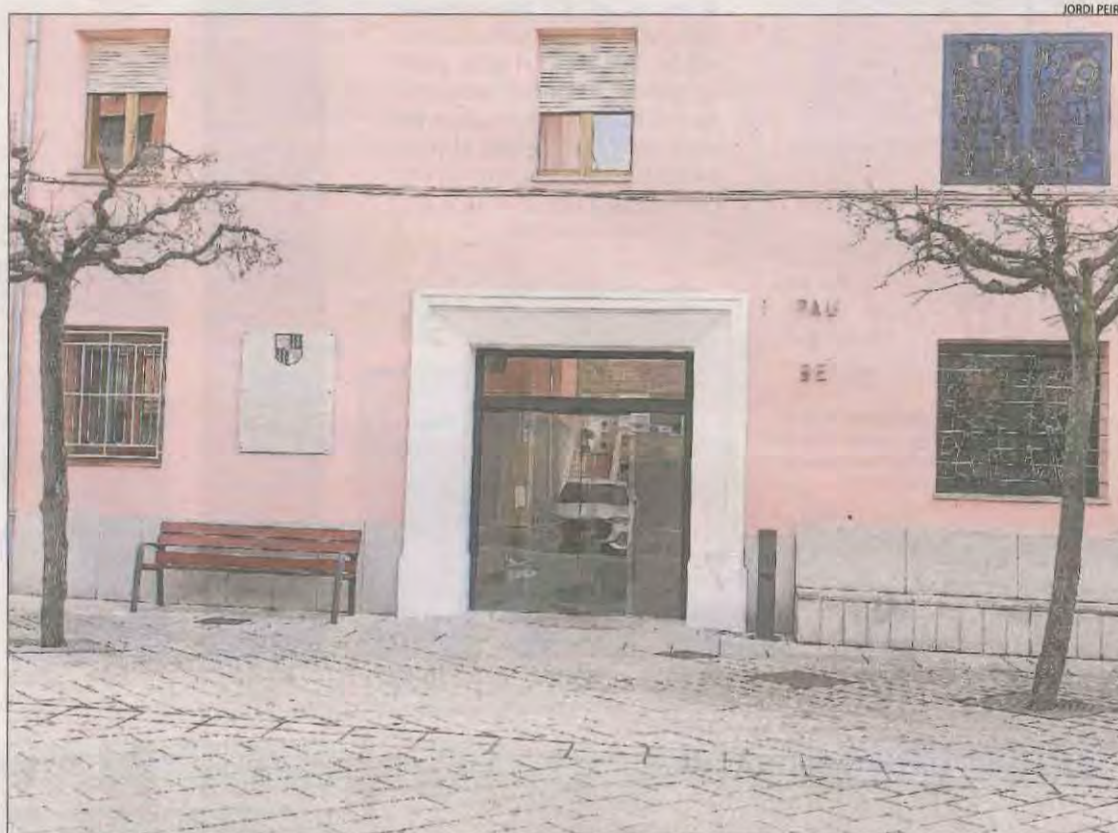
Imatge de l'exterior de la residència de Tremp, ahir.

■ Només hi ha 5 usuaris d'aquest geriàtric que han donat negatiu. Un d'aquests es troba a la residència a causa del seu delicat estat de salut i els altres 4 van ser traslladats (3 a la Pobla de Segur i 1 a Guissona).