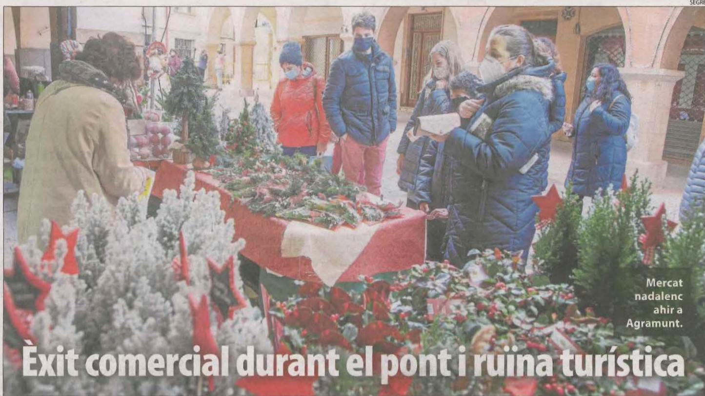
Mercat nadalenc ahir a Agramunt.

La residència Fiella de Tremp és la que acumula un major nombre de morts a Lleida per Covid, al sumar-ne ahir sis més, cosa que eleva ja a 40 el nombre total de defuncions.