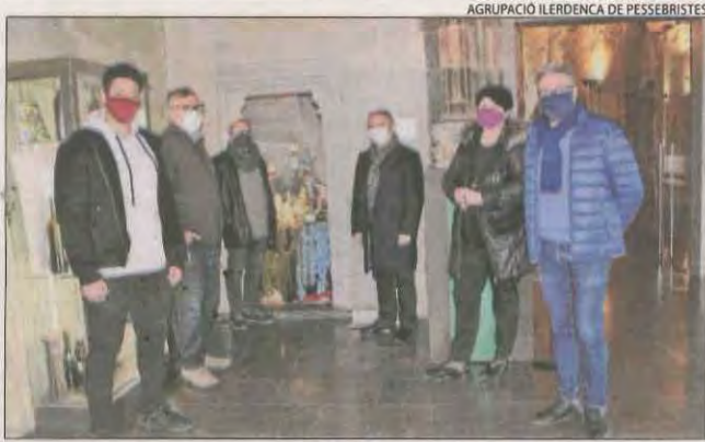
AGRUPACIÓ ILLERDENA DE PESSEBRISTES