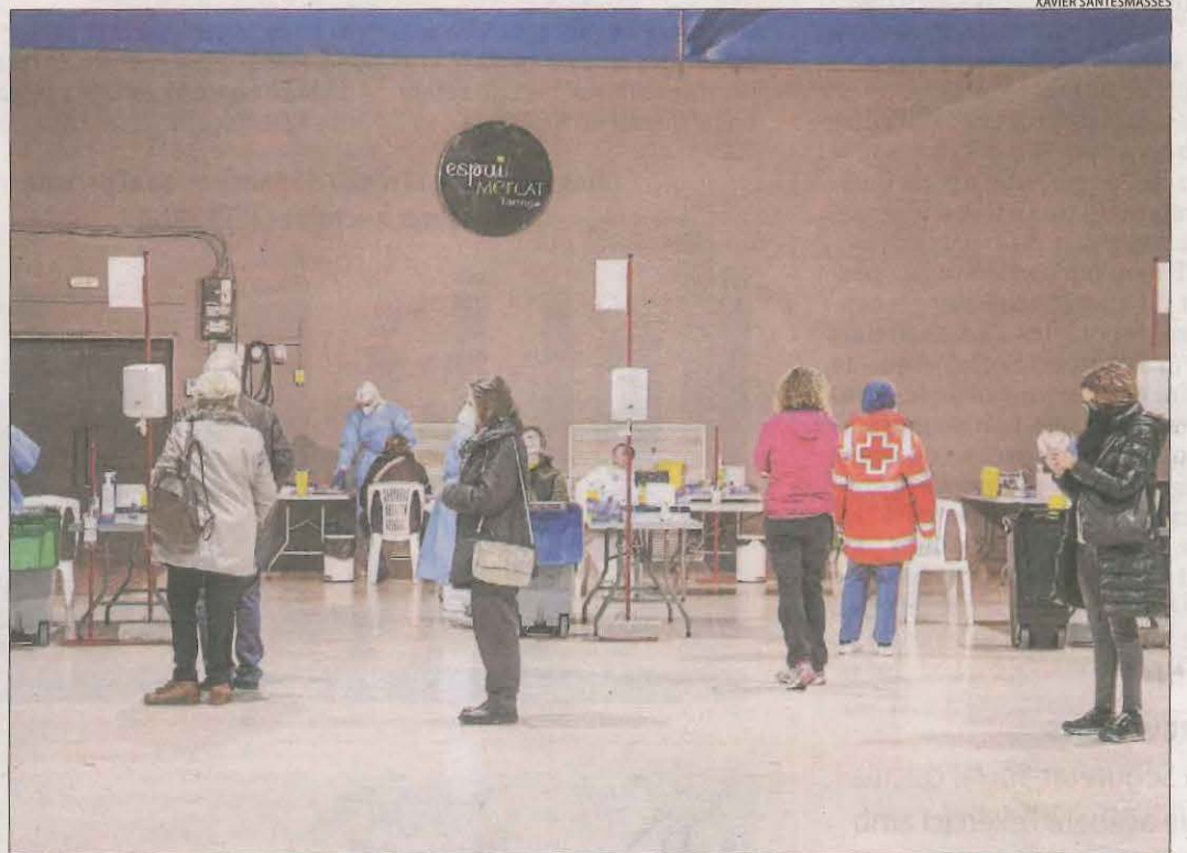
L'Espai MerCAT de Tàrrrega va acollir ahir de nou tests ràpids d'antígens.

En total, hi ha una persona menys a l'UCI. Així mateix, s'incrementa la xifra d'hospitalitzats al Pirineu, amb 24 (tres més), dels quals 12 a l'hospital de Tremp, tres a la unitat de semicrítics.