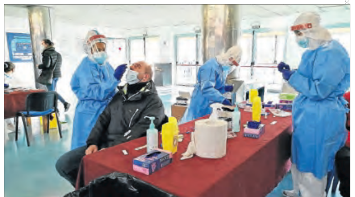
El pavelló Barris Nord de Lleida va acollir ahir tests d'antígens per detectar asimptomàtics.