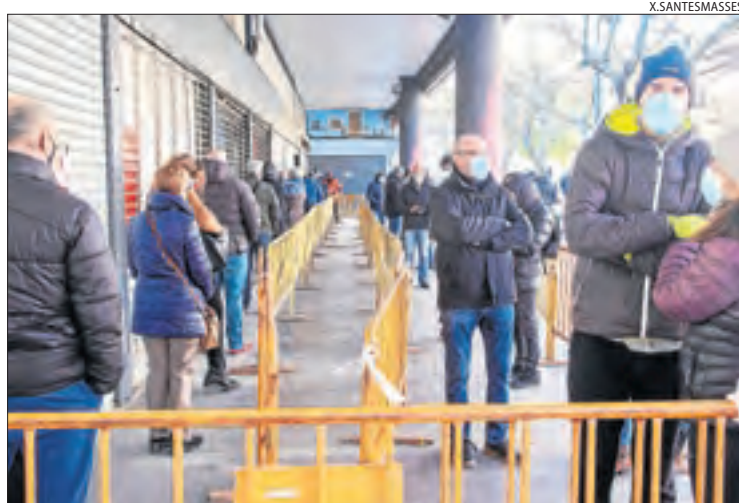
Cues a Tàrraga per sotmetre's a una prova.

Els segueixen les Garrigues, la Segarra i el Pallars Jussà, amb 5 cada una.