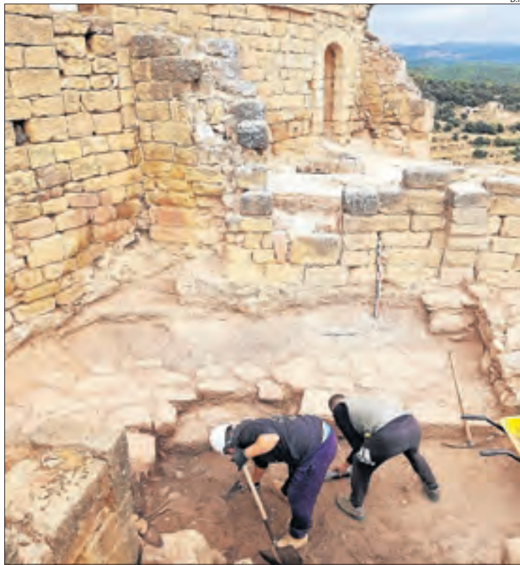
Primers treballs de restauració a la zona del castell.

una primera fase de restauració. La reconstrucció suposaria un cost de 260.000 euros i la inversió total prevista és de 549.890 euros. El consistori espera ajuts de la UE i crearà una fundació per aconseguir fons d'entitats bancàries i persones interessades.