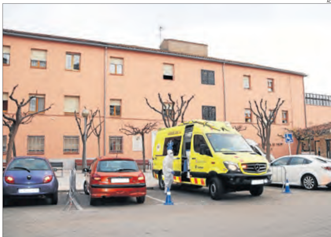
Una ambulància a l'exterior de la residència Fiella de Tremp dijous.