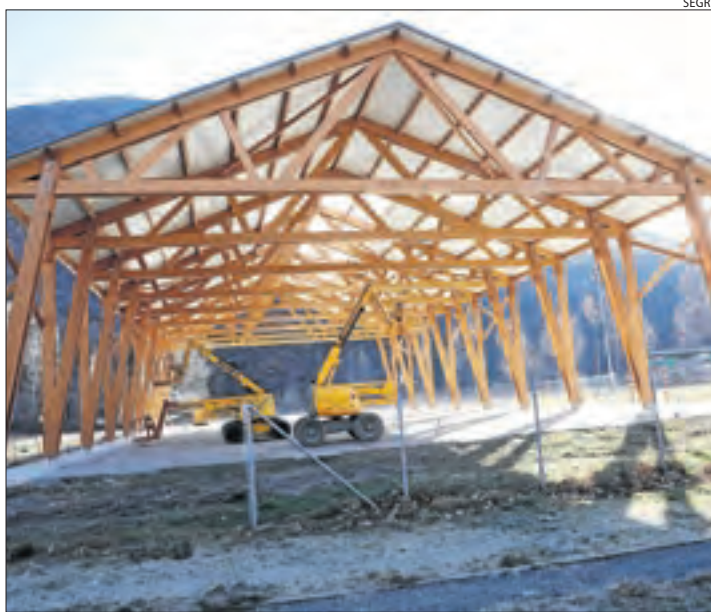
Plaques solars al poliesportiu de fusta. Imatge d'arxiu de la instal·lació esportiva on el consistori instal·larà panells solars.

El ple va aprovar el pressupost del novembre, que ascendeix a més d'1,8 milions d'euros