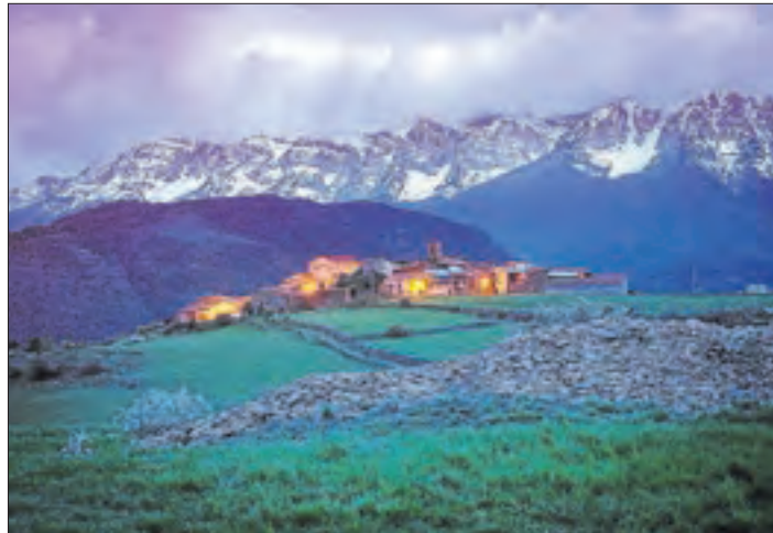
Vilanova de Banat. Una bucòlica imatge de la població del municipi d'Alàs i Cerc (Alt Urgell) obra de Joan Lluís Romero.