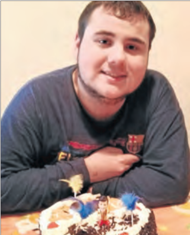
Et desitgem un fantàstic dia de l'aniversari. Ets el petit de la casa. Moltes felicitats!