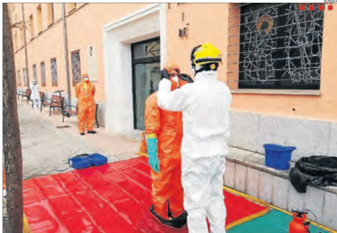
Els Bombers van dur a terme tasques de desinfecció diumenge passat.

dors. Això va fer que la conselleria de Salut intervingués la residència el cap de setmana passat i va posar al capdavant Gestió de Serveis Sanitaris (GSS). Ahir hi havia 100 usuaris contagiats, 9 a l'Hospital