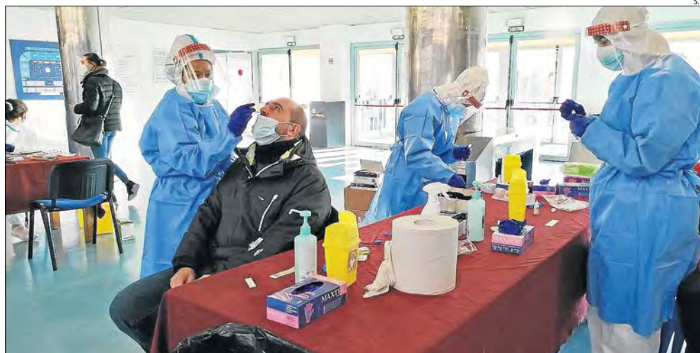
Nova jornada de cribratges massius al Barris Nord (a la imatge), a Tàrrrega i Balaguer.

Oasi || A Lleida hi ha 22 municipis que no han tingut ni un sol cas de coronavirus en nou mesos