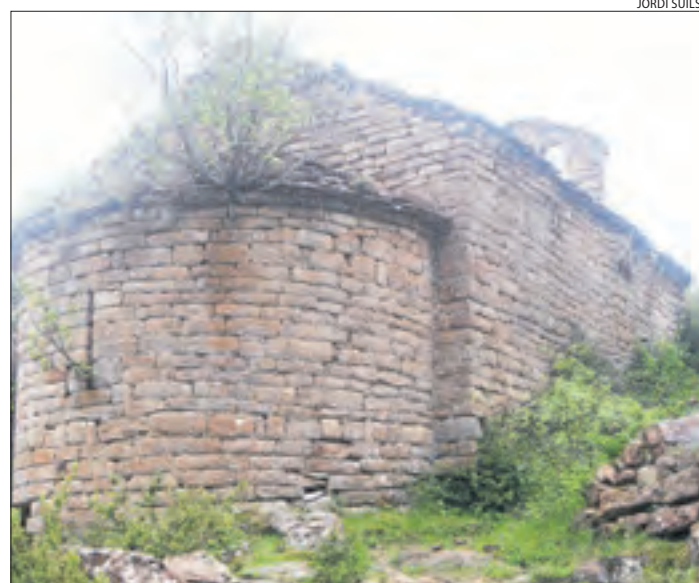
Sant Sadurn d'Esperan, on s'actuarà ben aviat.