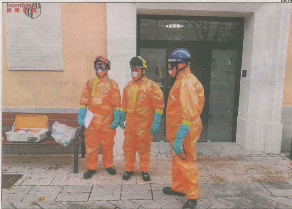
Els bombers van dur a terme treballs de desinfecció a la residència de Trempe diumenge.

LLEIDA | Trempe frena la desescalada a partir d'avui per l'auge de casos i tancarà equipaments per reduir la mobilitat. El risc de rebrot al municipi és de 1.111,89 i la velocitat de propagació se situa en 1,14. Segons el consistori, des de mitjans de novembre la situació epidemiològica és "complicada" i "les dades de contagis entre la població són dolentes". A això se li suma el brot a la residència, on els morts ja són disset després de quatre decessos més. Hi ha 104 positius al geriàtric i nou a l'hospital. Així, a partir d'avui i almenys fins al 14 de desembre, les classes de l'escola de música seran telemàtiques, se suspeneixen les activitats a La Lira, tanquen equipaments esportius i parcs infantils i la biblioteca només oferirà servei de préstec. L'alcaldessa, Pilar Cases, va explicar que la decisió es va prendre de forma consensuada i seguint indicacions de Salut. Va fer una crida que "la gent no surti de