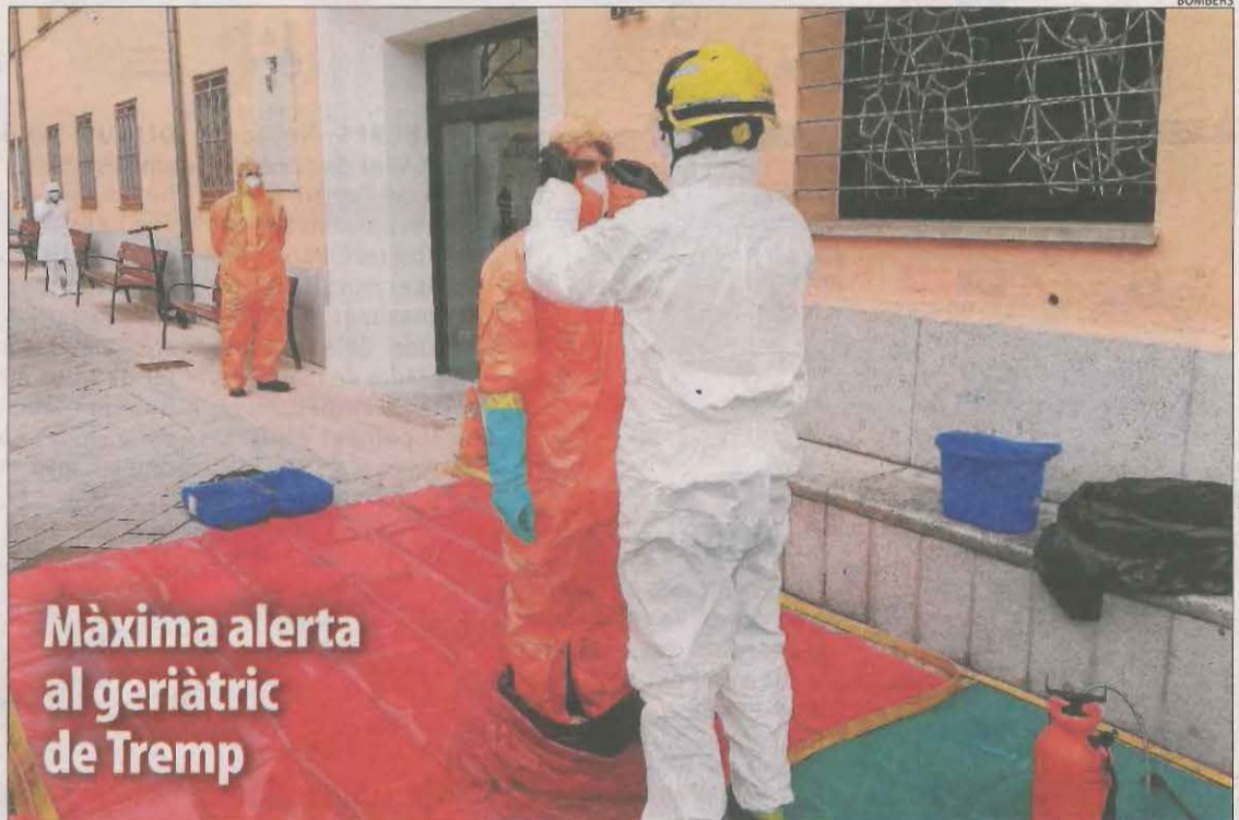
Màxima alerta al geriàtric de Tremp

Nadal || Límit de deu persones i s'estudia excloure els menors del còmput