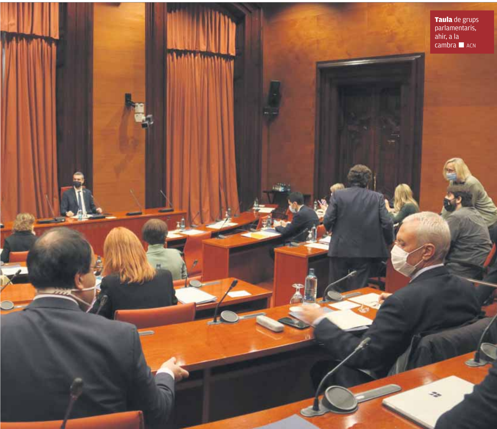
Taula de grups parlamentaris, ahir, a la cambra