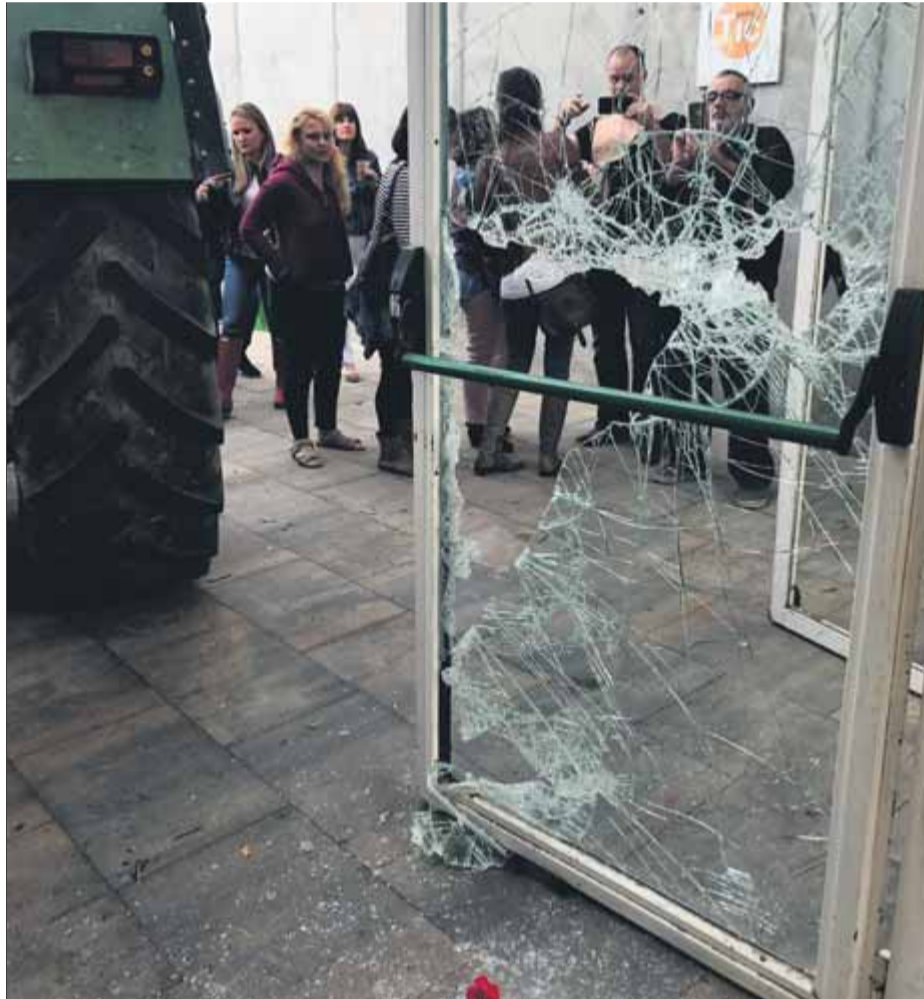
Estat de la porta d'entrada al pavelló de Sant Julià de Ramis, l'1-0