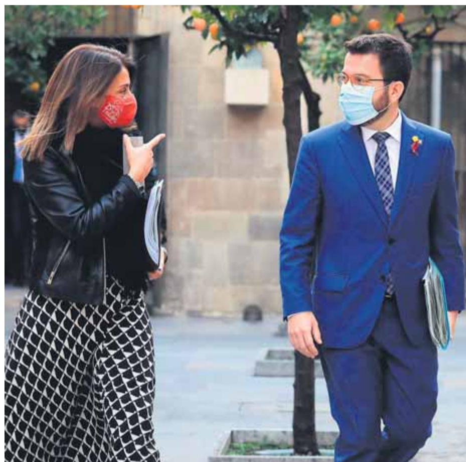
La consellera de la Presidència, Meritxell Budó, i el vicepresident, Pere Aragonès

i propostes de múltiples fonts, des d'informes del Consell de Garanties Estatutàries, de l'Institut Estudis de l'Autogovern o del Síndic de Greuges, fins a la mateixa direcció general de Processos Electorals de la conselleria d'Acció Exterior, han de determinar el format que tindrà la campanya electoral, les mesures sanitàries a prendre en els actes a l'aire lliure i en espais tancats i als espais de votació. Es dona per fet que no hi haurà els tradicionals grans mítings de campanya. La Junta Electoral Central ja ha anat donant el vistiplau a diverses iniciatives del govern per minimitzar la manipulació de material electoral in situ : s'han habilitat els carters perquè actuïn de dipositaris del sufragi de manera que es