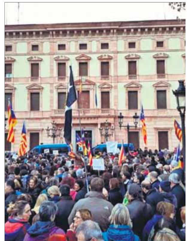
Protesta a Lleida contra la detenció de l'expresident Puigdemont, el març del 2018

responsabilitat patrimonial”. El lletrat va valorar que hi havia motius per presentar-hi recurs tot i reconèixer la politització de tot el que fa referència a l'1-0. Així, conscients de la dificultat del procés, l'Ajuntament va decidir obrir aquesta nova via a través del contencios administratiu, que a l'estiu es va admetre a tràmit, i avui se'n celebra la vista. ■