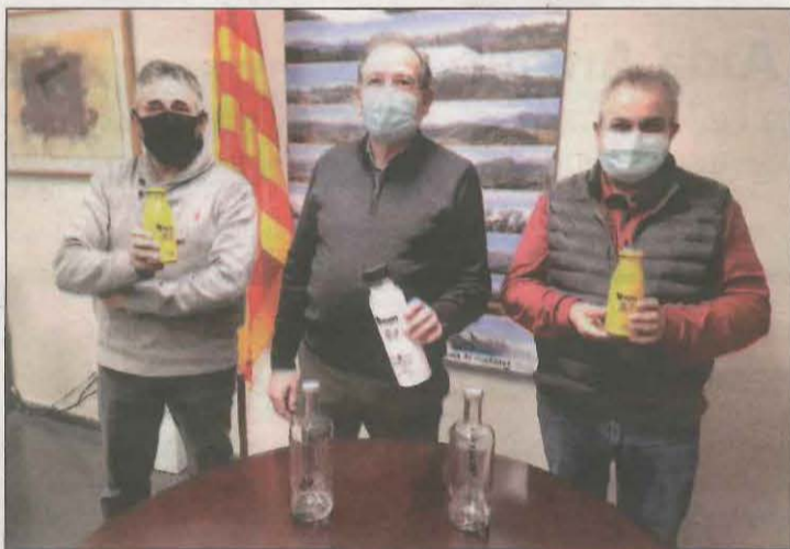
Suposarà una reducció del 40 per cent dels costos

L'objectiu d'aquesta actuació és mantenir i conservar les restes que encara perduren, de tal manera que permetin avançar en el seu estudi i puguin donar més informació sobre la torre i la resta del castell; per la qual cosa es planteja la refacció del capçat, per tal de cobrir la part superior de l'edifici i evitar l'entrada d'aigua. A la part exterior es consolidaran els paraments interiors i es perfilaran les obertures originals, se n'eliminaran els tapiats i es tapiaran les obertures fetes a la torre per a usos diferents.