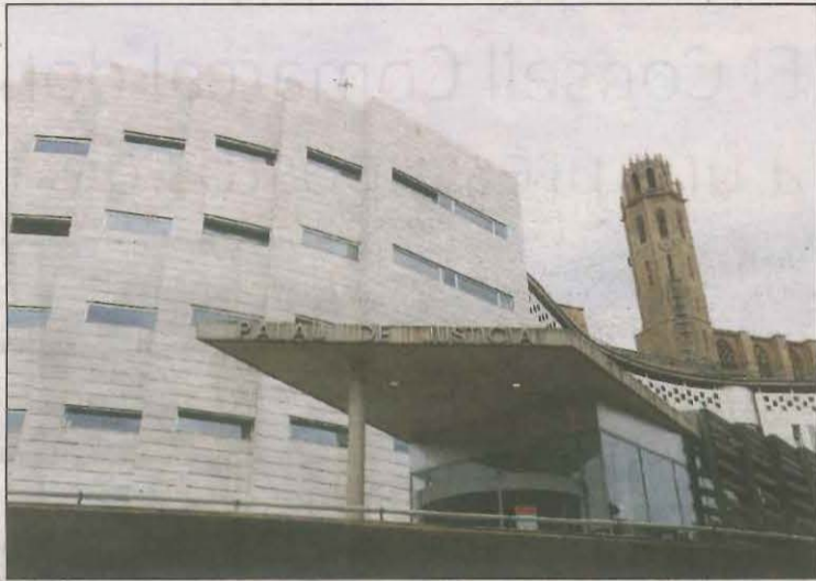
Imatge d'arxiu de la façana dels jutjats de Lleida

Cal recordar que va ser detingut juntament amb sis persones més (empresaris i treballadors de l'empresa MJ Gruas) per presumptes irregularitats relacionades amb contractes d'obra pública, que s'haurien descobert arran de la investigació de la causa principal del 'cas Boreas'. Quatre dies més tard, els Mossos en van detenir la filla després de retirar 20.000 euros d'una caixa de seguretat del BBVA. A més, van detenir dimarts de la setmana pas-