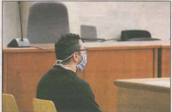
L'acusat, durant el judici a l'Audiència de Lleida

L'Audiència de Lleida ha condemnat a sis anys i sis mesos de presó un veí de Cervià de les Garrigues per un delictes de lesions agreujades per haver apunyalat amb un ganivet per l'esquena un home durant una baralla que va tenir lloc coincidint amb la festa del Carnaval del 2019 en aquest municipi de les Garrigues. El tribunal ha avalat l'atenuant de drogoaddicció, que havia sol·licitat la defensa de l'acusat durant