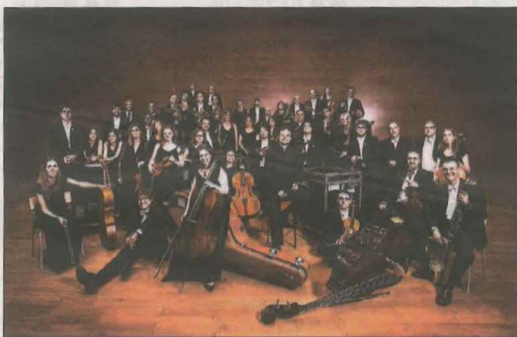
El concierto del domingo se podrá seguir por internet

El objetivo es ofrecer a la ciudadanía un acontecimiento musical de primer orden para encarar con esperanza los próximos meses. El concierto quiere enviar cada año un mensaje diferente, esta vez centrado en la covid-19, motivo por el cual el escenario será la capital del Pallars Jussà,