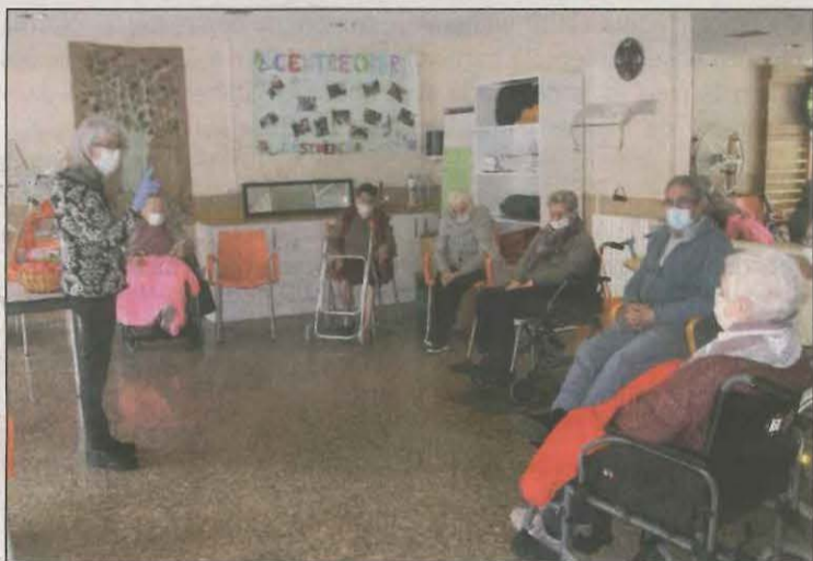
L'activitat es va celebrar amb grups reduïts de residents

Els usuaris de la residència de gent gran de l'Alta Ribagorça van poder gaudir ahir d'una matinal de lectura gràcies a l'activitat organitzada per la biblioteca del Pont de Suert. Tot i les dificultats del moment, l'acte es va celebrar amb grups reduïts i complint de manera escrupolosa totes les mesures sanitàries.