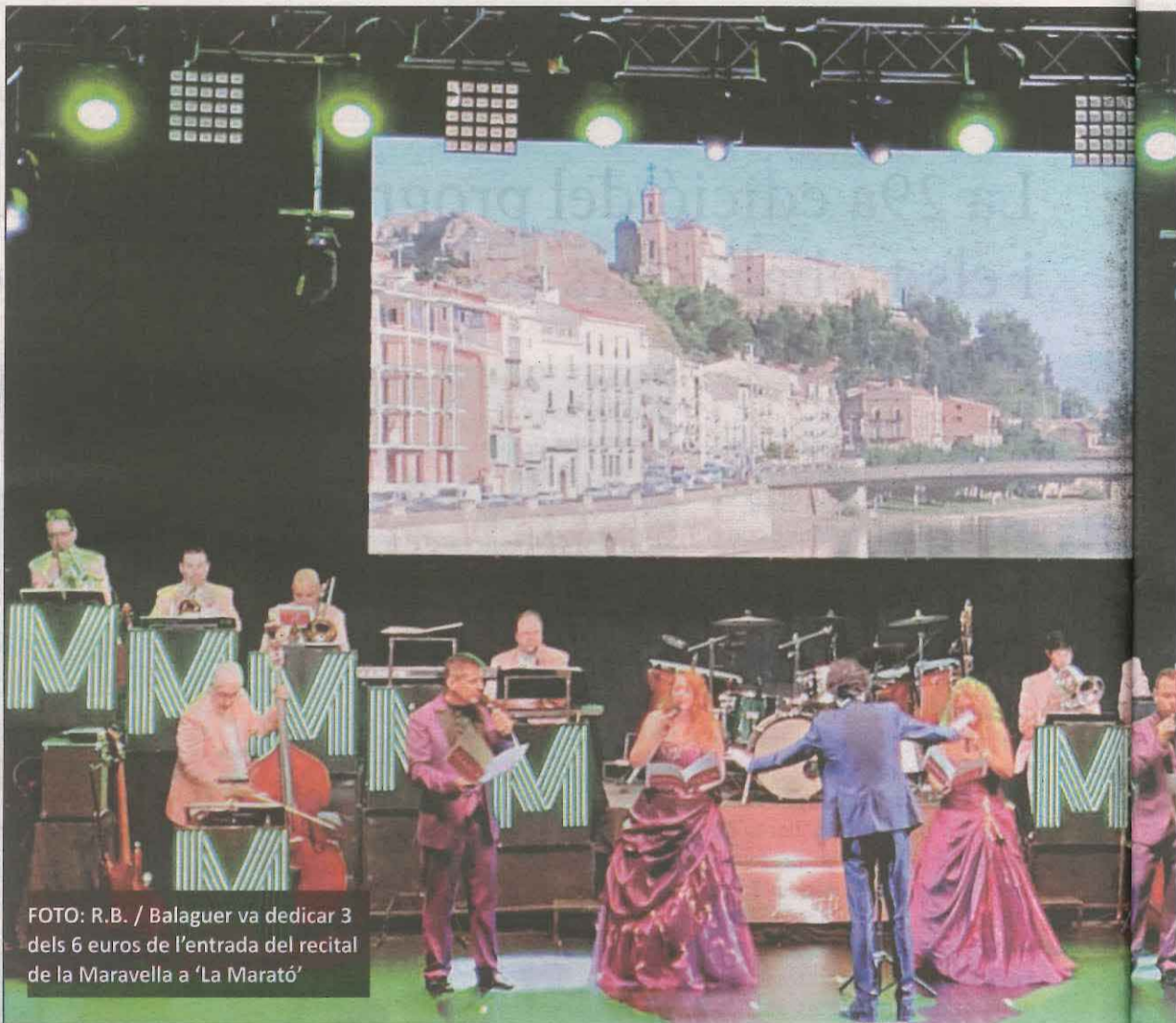
Balaguer va dedicar 3 dels 6 euros de l'entrada del recital de la Maravella a 'La Marató'

Per exemple, l'Associació FIDES de Ponent va fer un joc de preguntes sobre la plana de Lleida a través de WhatsApp. A Tàrraga s'havia programat un bingo i vermut solidari a la plaça de les Nacions Sense Estat que, finalment, es va fer a través d'Instagram per l'augment de casos a la ciutat. Pel que fa trobades presencials, Cervera va organitzar una caminada de 16,5 quilòmetres per les rodalies de la ciutat i al pavelló de l'Oli de les Borges Blanques es va projectar el documental 100 dies, que recull testimonis que van viure els gairebé cent dies que va durar l'estat d'alarma a diversos centres residencials. Enguany Balaguer va canviar les activitats que cada any organitzava a la plaça Mercadal per dues propostes: un Caga-Soca de Nadal adreçat als infants i un concert de l'Orquestra Maravella al Teatre Municipal. Una de les accions noves i destacades d'enguany però, va ser la venda de mascaretes solidàries i d'accessoris per mascaretes, com ara cintes i fundes. Aquest diumenge se'n van posar a la venda a Lleida, Balaguer,