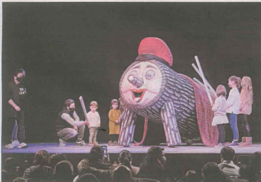
Una soca, amb una guardiola per 'La Marató', protagonista a Balaguer

raquetes de neu. Altres entitats, com és el cas de l'associació Veïns de la Vall Fosca i Amics de la Marató (Pallars Jussà) també es van decantar per la venda de mascaretes, que durant tot el diumenge es van poder adquirir a les botigues.