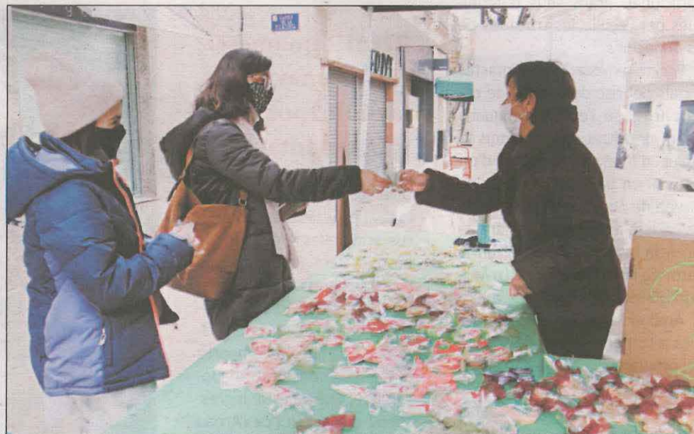
Mollerussa va fer una matinal d'activitats dedicades a 'La Marató' de TV3