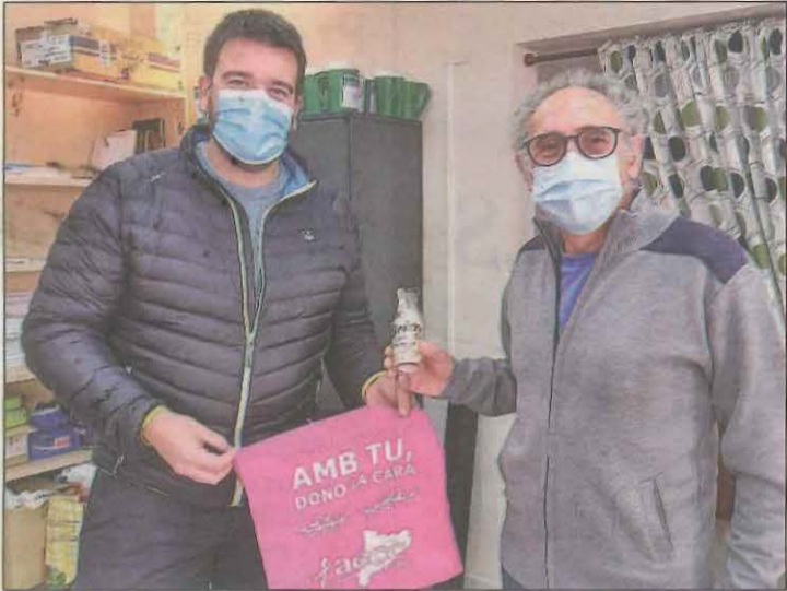
Lliurament d'un dels premis a un dels participants