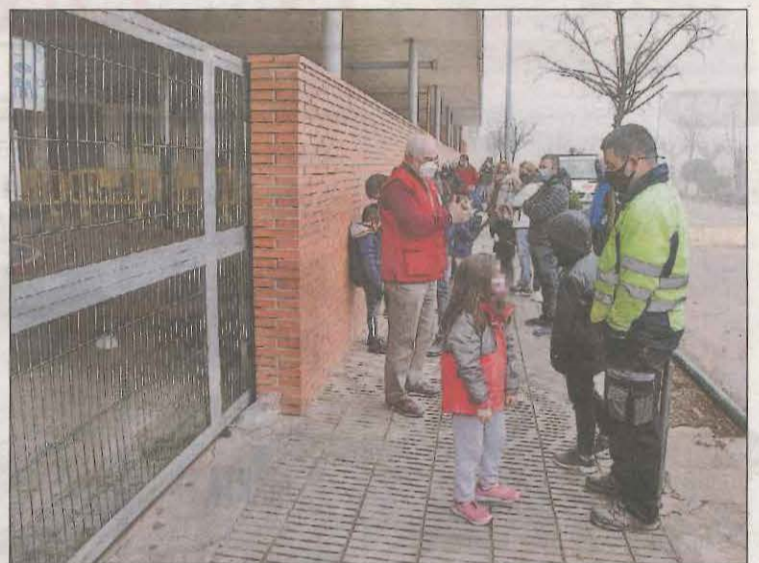
Colas ante la escuela El Sitjar para el cribaje de ayer

Los epidemiólogos prevén que el Covid-19 puede afectar a otros 400 vecinos de la localidad. El alcalde, Àlex Mases, afirma que la situación está mejorando y los contagios se están frenando "un poco". La mayoría de los establecimientos de restauración han cerrado.