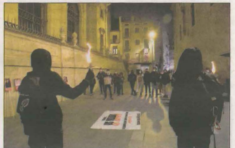
Els parlaments es van fer davant la Catedral

La Coordinadora Antirepressiva va organitzar ahir una Marxa de torxes a la ciutat per "exigir la llibertat de les persones que són a la presó per reivindicar els drets democràtics -com ara els presos polítics- i per lluitar i plantar cara a l'Estat espanyol". La concentració es va fer davant la Catedral.