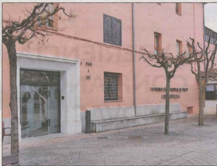
La residència de Tremp té ara la qualificació de taronja

D'altra banda La residència de la Fundació Jaume Fiella de Tremp ha sumat un mort més per covid-19, de manera que el total d'usuaris que han perdut la vida pel virus des de l'inici del brot és de 59. Segons dades de Departament de Salut, hi ha 18 residents positius de coronavirus, dels quals 6 han estat traslladats a l'Hospital Comarcal de Tremp,