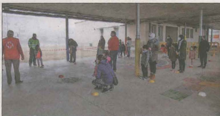
L'escola va acollir ahir els cribatges al seu alumnat

Segons assegura l'alcalde de Linyola, Àlex Mases la situació ha començat a "frenar una mica" després de la reobertura el dijous del consultori local amb 5 professionals del CAP de Mollerussa que ha realitzat proves a contactes estrèts de positius. Mases ha