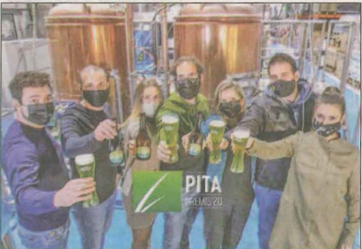
FOTO: Click&amp;Brew / Membres de l'Erm del Pallars i Click&amp;Brew

la cursa. També l'AECC Lleida va fer el lliurament dels premis del concurs fotogràfic de la cursa que es va realitzar a través de les xarxes socials, que consistien en productes cedits per empreses lleidatanes. Els diners recaptats es destinaran íntegrament a donar continuïtat a la gratuïtat de les prestacions i els serveis que ofereix l'AECC Lleida a pacients de càncer i familiars.