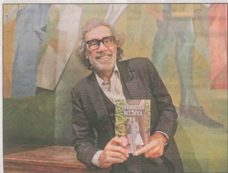
L'empresari lleidatà va estar ingressat a l'UCI

Saltó va explicar que l'objectiu de tot plegat "és detectar positius per aïllar-los el més ràpid possible" i "protegir els llocs de treball", ja que considera que aquesta és la manera "més efectiva" d'actuar mentre no arriba la vacuna. Tot i això, va recalcar que les proves donen una "certa tranquil·litat". "Donen tranquil·litat al moment de fer el test, però l'endemà ja no la tens". Alguns dels treballadors van afirmar que s'han fet la prova per "evitar riscos" i perquè els dona seguretat.