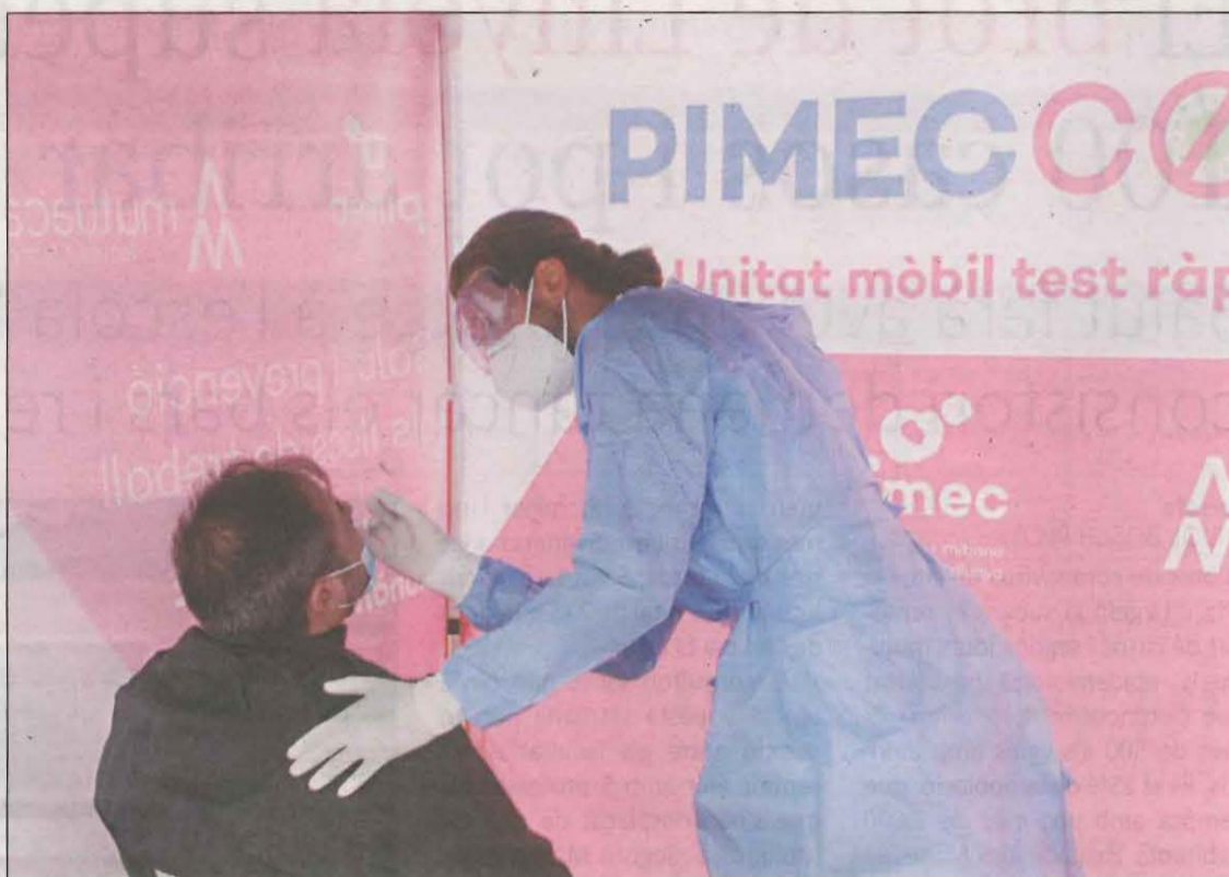
Un treballador d'una empresa del Polígon dels Frares de Lleida fent-se la prova

Es tracta de detectar el màxim nombre de persones contagiades, ja que n'hi ha que no presenten símptomes i poden, sense saber-ho, transmetre el virus a la seva família, amics i altres persones del seu entorn.