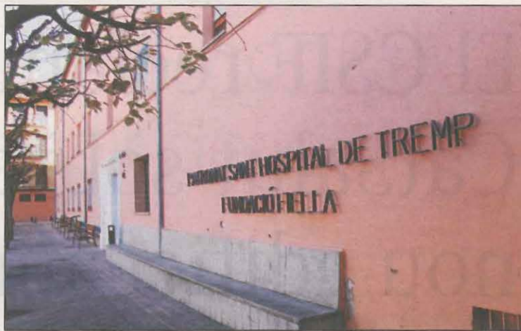
La xifra de defuncions es manté estable en 58 persones

Mentre, entre els treballadors del centre, la xifra ha baixat fins a 32, tres menys que fa 24 hores.