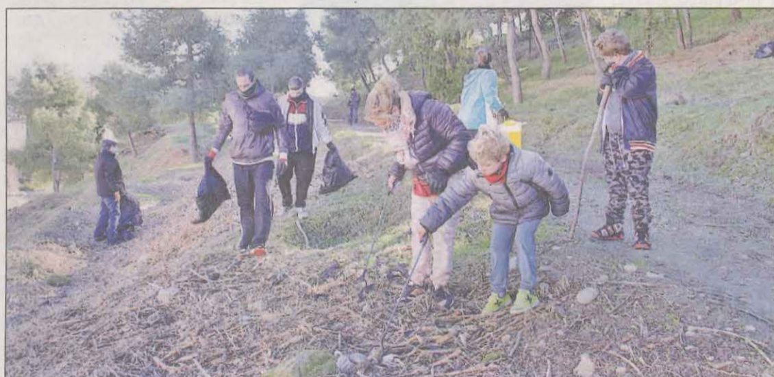
Familias enteras dedicaron la mañana de ayer a retirar residuos de la falda de Gardeny