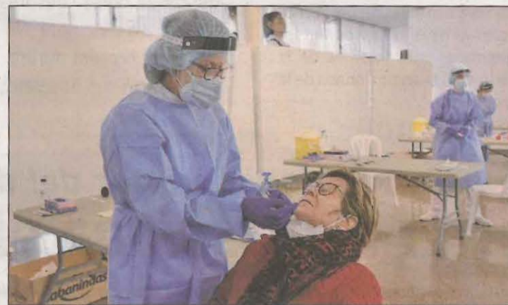
Es realitza durant aquest cap de setmana

De la mateixa manera, El Español apunta que a tot el món, ja tenen compromesos més de 500 milions d'unitats per a països com per exemple els Estats Units, el Canadà, Holanda, França, Alemanya, Finlàndia i Dinamarca, a més de Regne Unit. Amb aquesta quantitat, expliquen que per ser capaços de poder atendre a tota la demanda, l'empresa Becton Dickinson ha invertit un total d'1,5 milions d'euros en la creació d'una nova línia de producció i a reforçar l'actual plantilla de 600 treballadors. Així doncs, asseguren que podran fer front a tota la demanda perquè han establert una calendarització. A més, assegura que no estan deixant d'abastir farmàcies, que són també els seus principals clients.