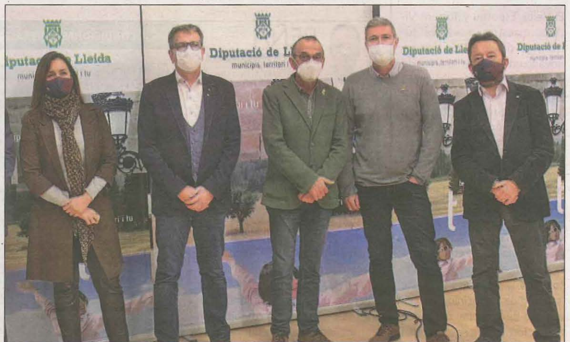
Las autoridades, ayer en la presentación de la iniciativa FutbolNet

un programa extraescolar gratuito, de dos días a la semana, que fomenta la integración social de niños y adolescentes en situación de alta vulnerabilidad. Se utilizará una metodología propia de la Fundació Barça, donde a través del deporte se da un apoyo integral en temas de educación.