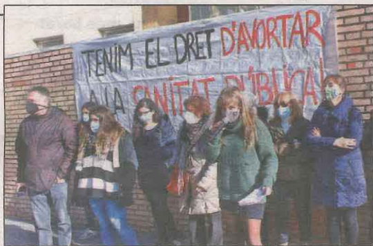
Imagen de la concentración

Representantes de la Xarxa Feminista Ponent i Pirineus se concentraron ayer ante la delegación del Departament de Salut en Lleida. LOCAL | PÁG. 11