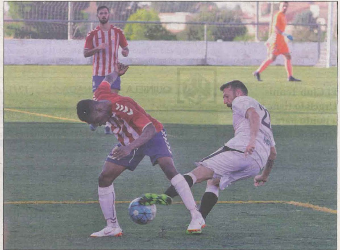
El fútbol territorial se resolverá con unas ligas acortadas

La adaptación de los planes de competición establece la reducción de las ligas amateurs y de base, de tal manera que las categorías con subgrupos pasarán a disputarse en una fase, y en el resto se jugará la competición a una única vuelta. La fecha de reanudación de las competiciones,