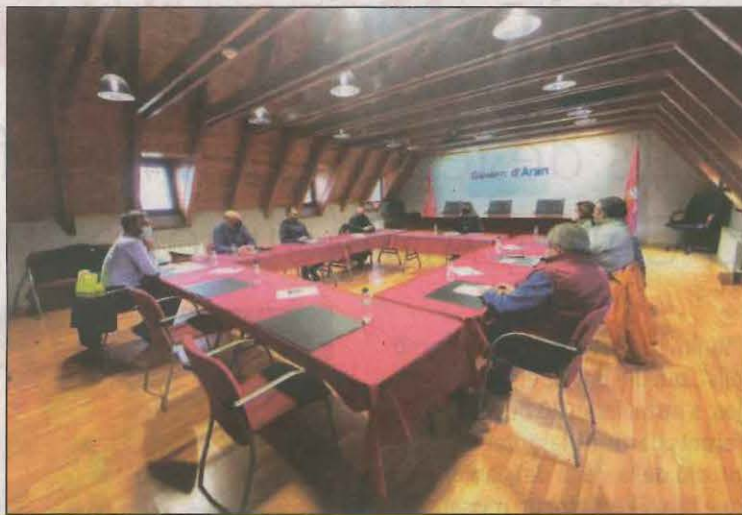
Reunió del Consell Generau, l'hostaleria i els Mossos

En una reunió entre el Consell Generau d'Aran, l'estació d'esquí Baqueira Beret, el Gremi d'Hostaleria i Mossos d'Esquadra s'ha acordat destinar un rastrejador de l'Espitau Val d'Aran específic per al sector turístic i destinar dos agents cívics a informar i conscienciar als establiments per a prevenir contagis. El rastrejador