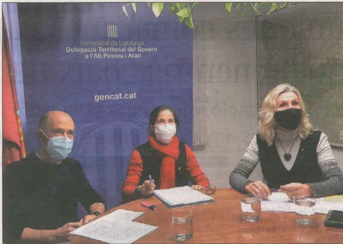
El Departament va explicar en roda de premsa les mesures que ha dut a terme a la residència

Des de l'inici, segons el relat de Farreny, es van detectar "greus mancances" en matèria de gestió de la informació, de creació de circuits, de sectorització dels pacients, així com una mala praxi en l'ús dels EPIs. El cert és que Salut va tardar nou dies a intervenir la residència, ara gestionada per Gestió de Serveis Sanitaris (GSS). Segons el Departament, la cronologia dels fets va ser la següent. El dia 20 es va fer un cribratge als residents i treballadors després del positiu detectat el dia anterior a un dels empleats. El 21 de novembre, Salut Pública va iniciar les visites diàries a la residència després de conèixer que en el primer cribratge van donar positiu 51 residents i 6 treballadors. Dos dies més tard, el 23 de novembre, es va comprovar que les indicacions no s'estaven complint i que