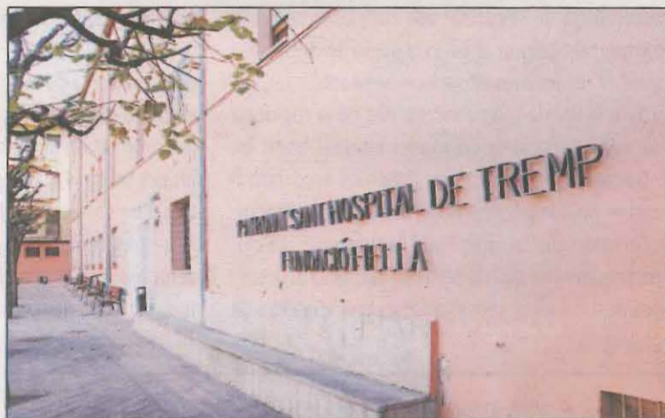
Exterior de la residència Fiella-Sant Hospital

Salut va acordar el passat 28 de novembre intervenir la residència de gent gran de Tremp per "estabilitzar" el brot de Covid-19,