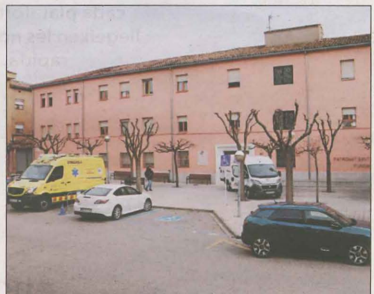
La residència Filella de la capital del Pallars Jussà

En total, al centre hi ha 100 usuaris positius, 3 menys que els registrats el passat divendres, i 41 professionals, 3 més que ahir. D'aquesta manera, el nombre de positius entre els residents segueix a la baixa, encara que, per contra, augmenta el nombre de casos entre els treballadors del centre. Això, el mateix dia que es compleix una setmana des que el