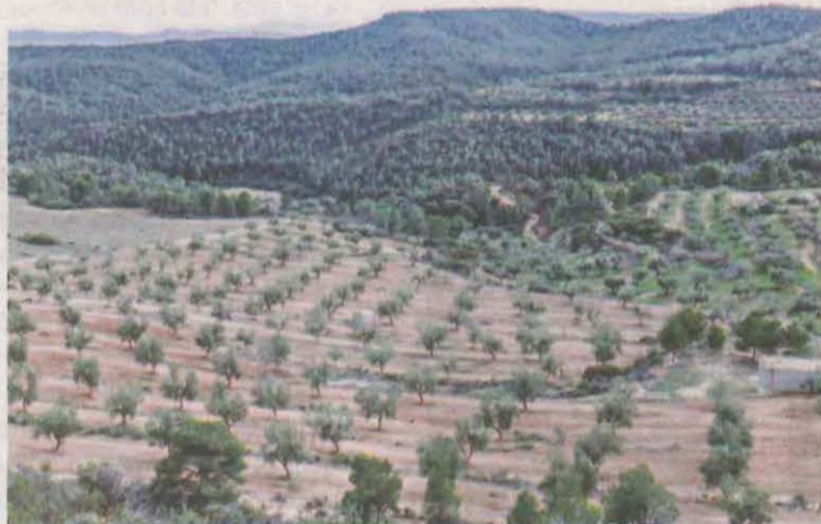
Un camp d'oliveres situat a la comarca de les Garrigues

El pla, elaborat amb els consells comarcals de les Garrigues, la Noguera, el Segrià, l'Urgell i el Pallars Jussà, té l'objectiu de difondre l'oferta existent com a destinació oleoturística de referència, implicar les empreses i les destinacions del territori vinculades al món de l'oli en un producte de territori i donar suport a la comercialització de les experiències oleoturístiques avalades de la destinació. En aquest sentit, s'ha creat un web específic que