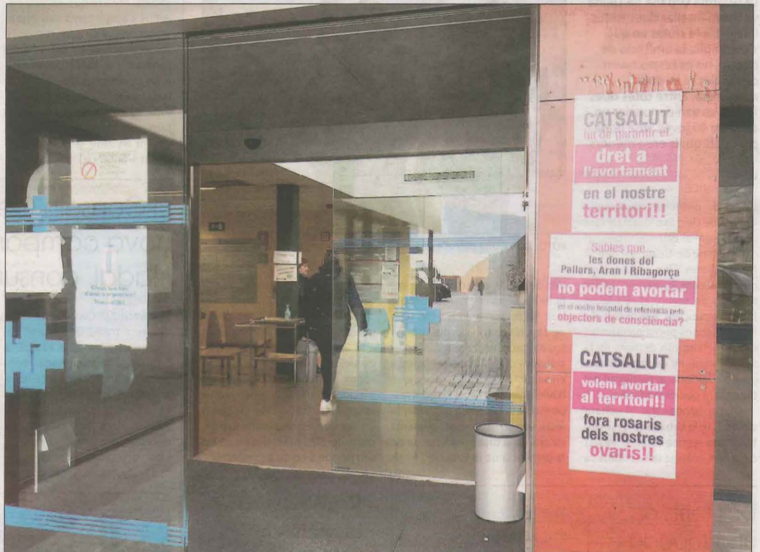
Imatge d'arxiu de l'encartellada que es va fer al CAP del Pallars per reclamar el dret de les dones a poder avortar lliurement

En concret, les dones que volen interrompre l'embaràs de forma voluntària poden fer-ho via farmacològica fins a les 9 setmanes de gestació. En aquest cas, se'ls hi facilita la píldora a l'Hospital Arnau de Vilanova, en un CAP de Lleida i als de Balaguer, a Mollerussa i a Tàrraga. No obstant això, un cop passades les 9 setmanes i fins a la setmana 14, si es vol interrompre l'embaràs s'ha de fer quirúrgicament i aquí és on