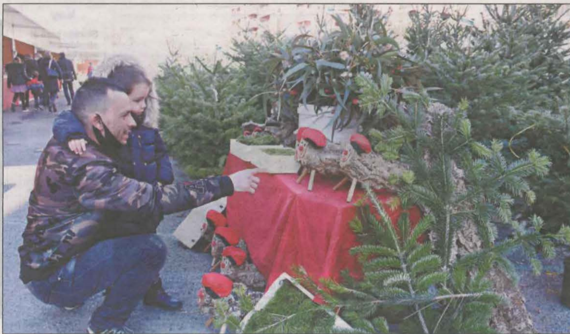
El mercado de Santa Lúcia de Lleida abrió ayer

CAMPAÑA DE LA TRUFA INCIERTA ANTE LA CRISIS DEL SECTOR HOSTELERO | PÁG.20