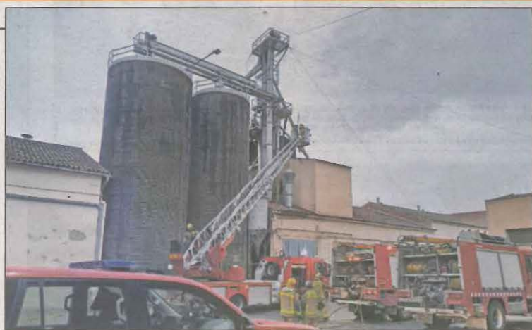
Imagen del trabajo de los bomberos en la cooperativa

No hubo heridos y los bomberos trabajaron durante casi toda la mañana con ocho dotaciones hasta lograr apagar el fuego. COMARQUES | PÁG. 19