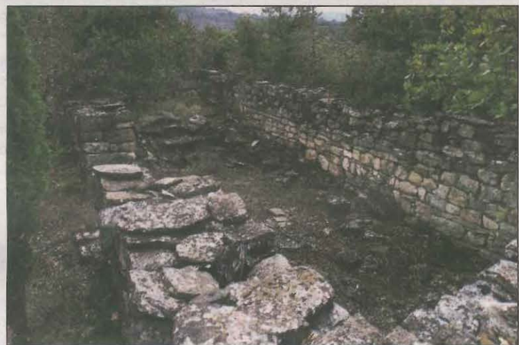
El jaciment es troba al terme de Gavet de la Conca

L'Ajuntament de Gavet de la Conca i el Laboratori d'Arqueologia Medieval de la Universitat de Barcelona ha reprès la recerca arqueològica al jaciment medieval del Castelló Sobirà de Sant Geruà o de Sant Miquel de la Vall. L'equip d'arqueòlegs es plantegen com a objectius la localització del carrer principal del poblat.