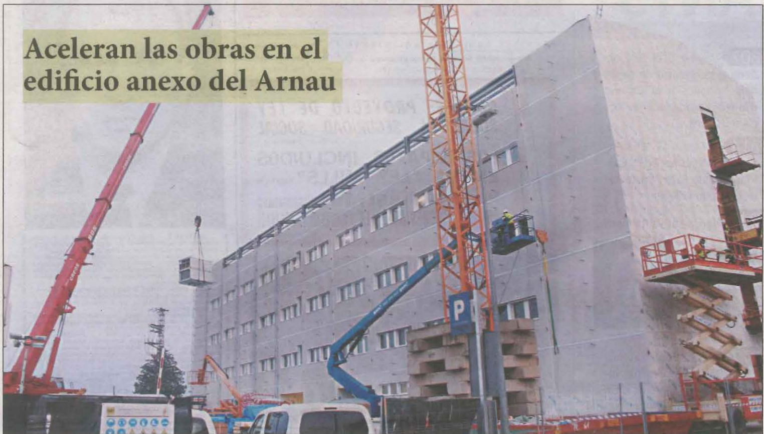
Los trabajos siguen a ritmo frenético tanto en el exterior como en el interior para que pueda estar listo después de Reyes