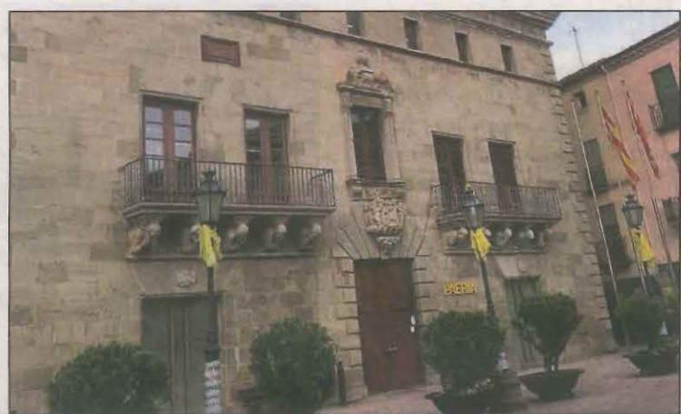
Aproven defensar l'alternança de les línies educatives

La moció també demanava mantenir viu el mandat del referèndum i no pactar amb forces no independentistes, punt en el