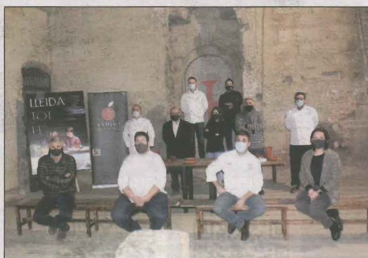
Vuit restaurants de la província participen en l'acció

En aquest sentit, volen afavorir l'experiència gastronòmica amb les jornades 'Sopars de Xef', que inclouen el disseny d'uns sopars de quatre plats molt personals amb ingredients locals i el maridatge de vins i caves de la zona. El preu dels menús serà de 40 euros i els sopars començaran