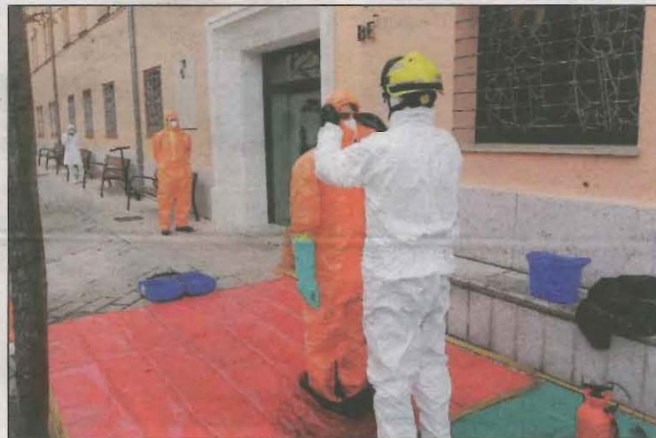
Els Bombers van revisar la residència el diumenge

D'aquesta manera, amb aquestes mesures més restricti-