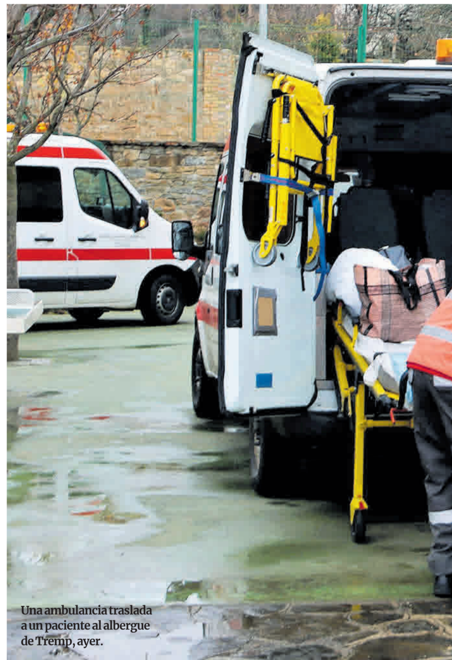
Una ambulancia traslada a un paciente al albergue de Tremp, ayer.

A pesar de que sigue habiendo una cuarentena de trabajadores confinados en sus casas (el 60% del total), algunos ya empiezan a volver al centro de trabajo tras superar la enfermedad. La residencia también ha contratado a más cuidadores procedentes del geriátrico de Guissona (Segarra), a los que no hace falta formar porque también sufrieron un brote importante de coronavirus durante la primera ola. «Al menos saben como colocarse las EPIS, y saben qué hay que hacer