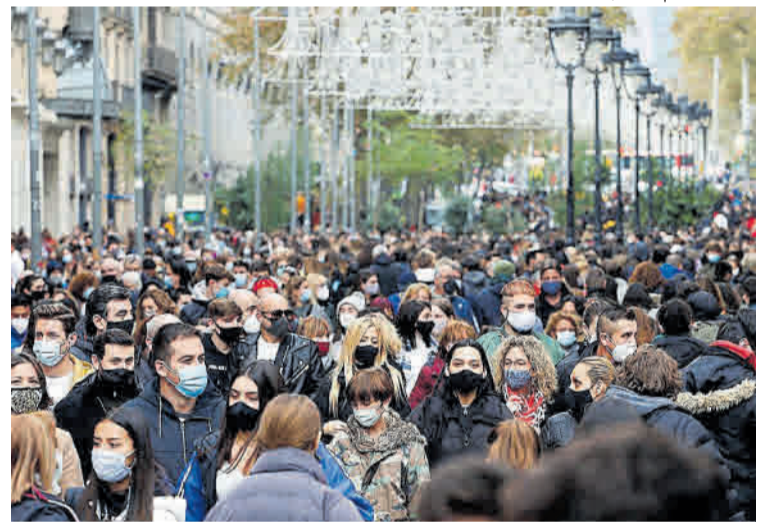
Multitud en el Portal de l'Àngel, ayer tarde.