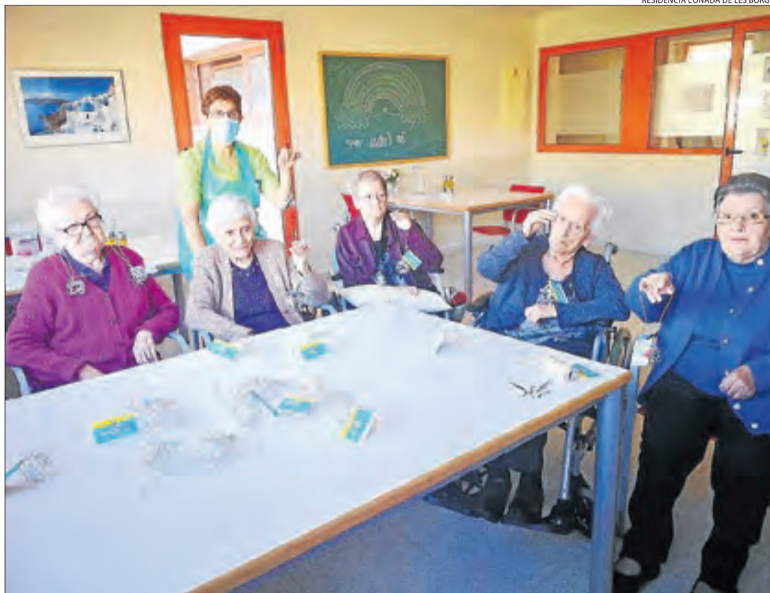
La residència de les Borges deixa enrere el brot. La residència per a persones grans de la capital de les Garrigues, gestionada per l'empresa L'Onada, va donar per superat a començaments d'aquest mateix mes el brot que s'hi va detectar a l'octubre. El geriàtric va tornar a poc a la normalitat.