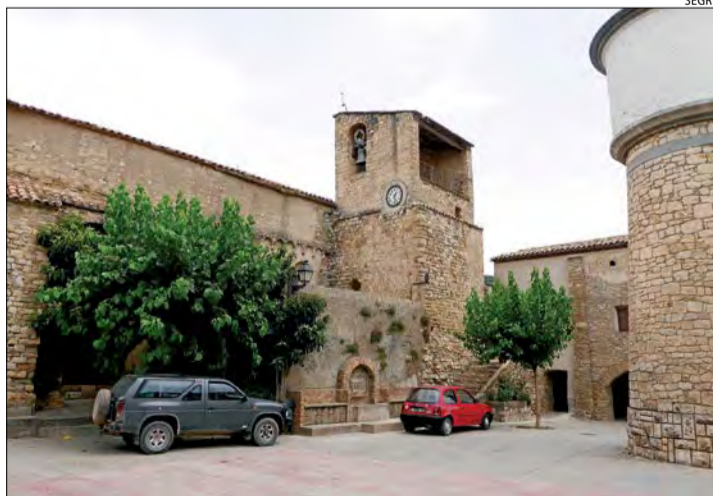
Plaça de l'Església al centre històric de Llimiana.

l'hostal sempre ha tingut dos finalitats. La primera és lúdica i social, ja que és el lloc de trobada dels veïns i els propietaris de segones residències;