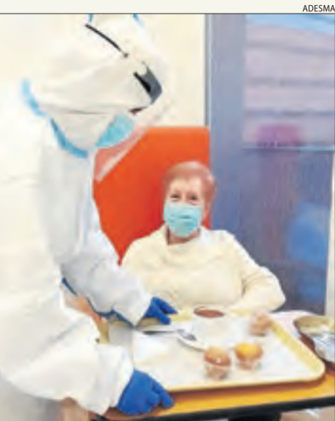
Una de les noves usuàries de la Sant Antoni de Pàdua de Lleida i que està aïllada.