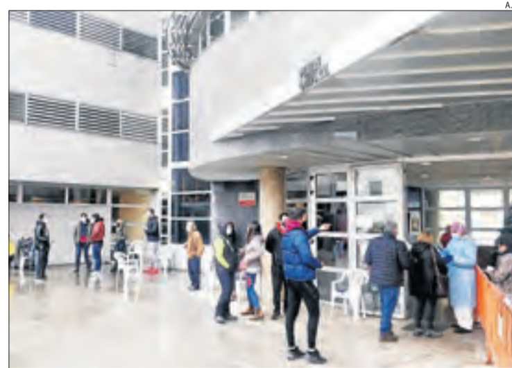
Les proves es van fer ahir al Centre de Cultura d'Almacelles.

havia més ofertes i descomptes. D'altra banda, la limitació d'aforament al 50 per cent als comerços va provocar cues per entrar en alguns.