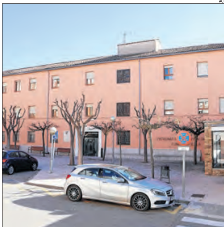
Imatge recent de la residència de la Fundació Fiella de Tremp.

La gravetat del brot obligarà a prendre mesures més enllà de la mateixa residència. Així,