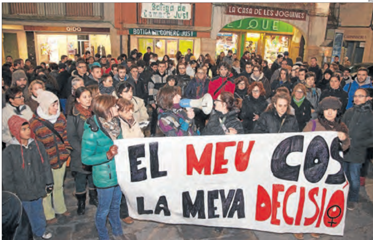
Imatge d'arxiu d'una protesta a Tàrrrega a favor de l'accés a la interrupció de la gestació lliure i gratuïta.

■ El 2018, un total de 482 dones catalanes es van haver de desplaçar fora de les seues comarques per poder interrompre voluntàriament la gestació, segons l'Observatori de Drets Sexuals i Reproductius.