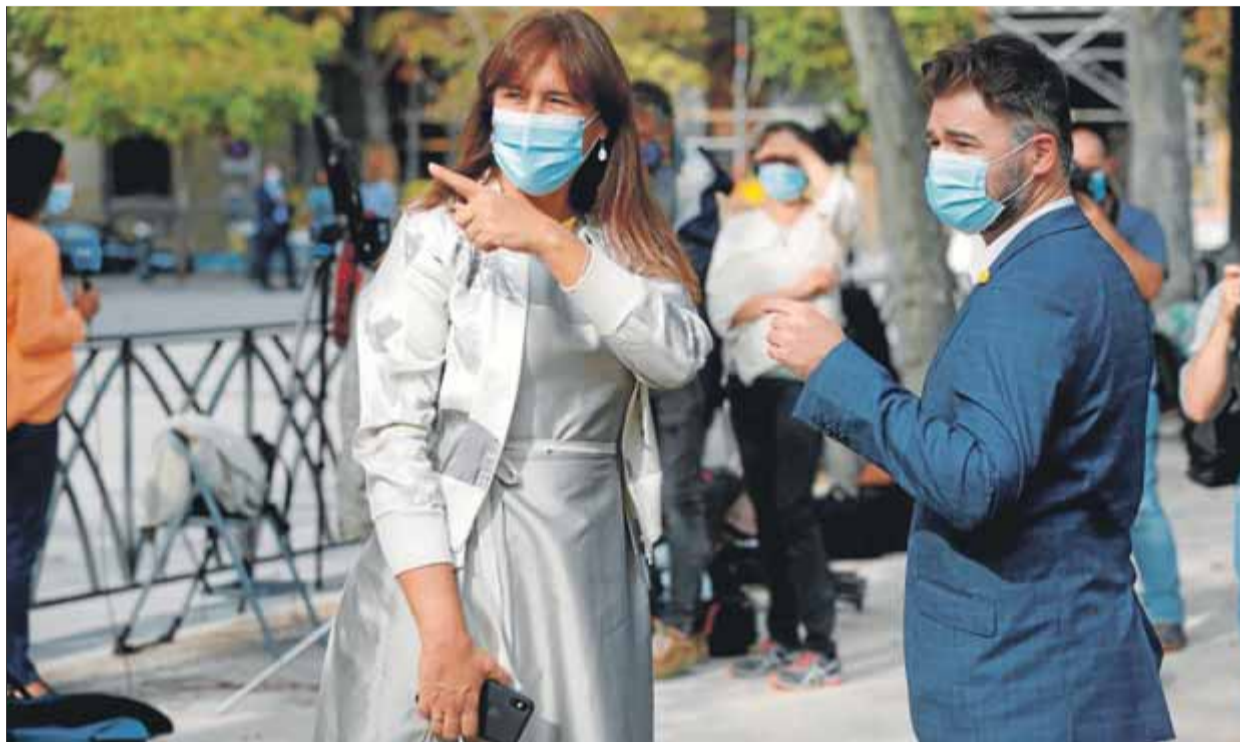
Borràs (JxCat) i Rufián (ERC) toparan dijous per la discrepància sobre l'aval al pressupost de Sánchez

discussió política com és Twitter, Quim Torra i la líder del PNC, Marta Pascal, verbalitzen l'antagonisme estratègic. "És impossible que el teu país sigui lliure i socialment just si votes el pressupost del país que et vol sotmès i asfixiat econòmicament", va avisar Torra el cap de setmana. "Només qui té el sou assegurat pot viure de la retòrica. L'obligació dels polítics és seure a la taula, negociar, aconseguir el millor per al país i arreglar els proble-