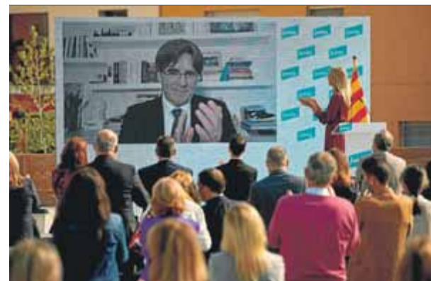
El líder de JxCat, Carles Puigdemont, en un acte a Cornellà del Terri en el tercer aniversari de l'1-O

El president de la Generalitat a l'exili i líder de Junts per Catalunya, Carles Puigdemont, té de temps fins demà passat per acabar de desfullar la margarida i comunicar al partit si vol ser el candidat a la presidència de la Generalitat a les eleccions del pròxim 14 de febrer, segons marquen els estatuts sotmesos a votació aquest cap de setmana (el resul-