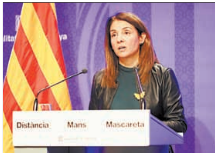
Budó destaca que és una eina "cabdal" per als consistoris

En el cas de la vegueria de Lleida, el PUOSC 2020 i 2024 destinarà 13,4 milions d'euros al Segrià; 15,5 milions a la Noguera; les Garrigues percebran 7,1 milions d'euros; l'Urgell, prop de 6,8 milions; la Segarra, uns 6 milions, i el Pla d'Urgell, 5,3 milions d'euros. A l'Alt Pirineu i Aran, l'Alt Urgell percebrà 8,7 milions d'euros; el Pallars Sobirà 7,9 milions; el Jus-