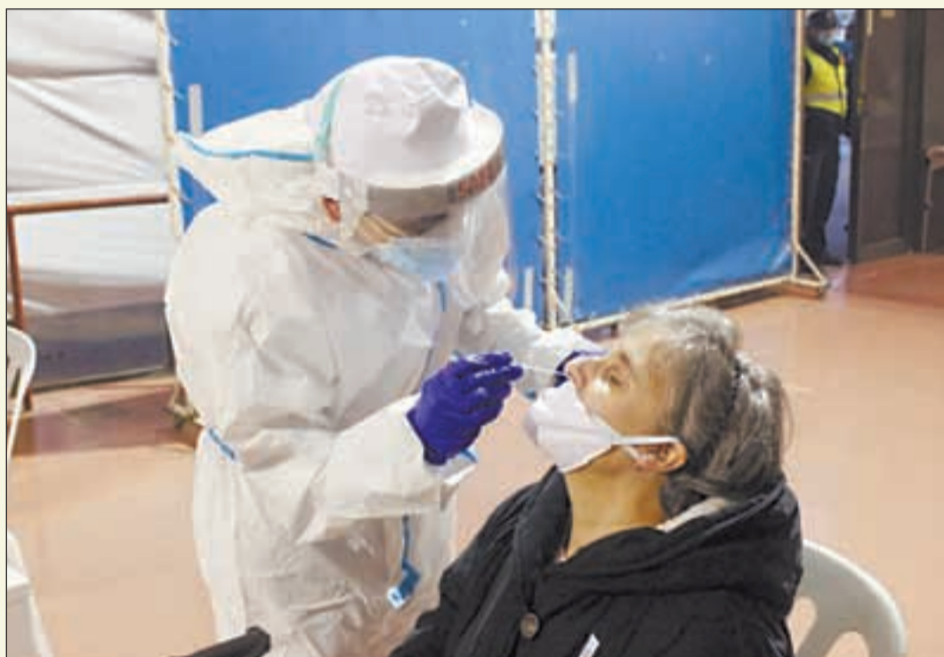
Una dona sotmetent-se a un test d'antígens al pavelló Onze de Setembre

–Senterada. El 3 de desembre, de 9h a 11:30h, al Consultori Lo-