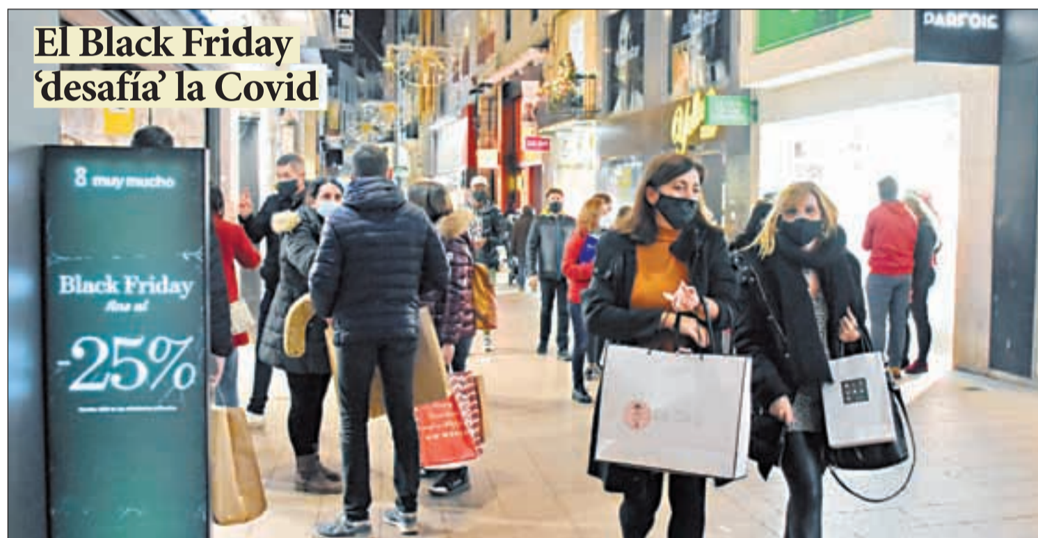
El Black Friday 'desafía' la Covid

La sensación del comercio fue positiva pese a que no fue una jornada con la afluencia registrada otros años LOCAL | PÁG.11