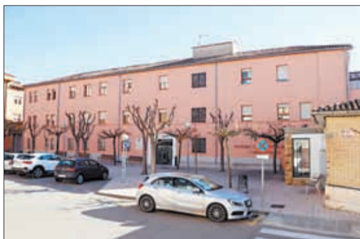
Imatge de la residència Fundació Fiella de Tremp

De les residències de la regió sanitària de Lleida, hi ha 2 casos actius a la residència Castrillón de Lleida, tots dos residents, i 5 positius a la residència de Bellví (Pla d'Urgell), dels quals 2 són residents i 3 treballadors. A la resi-