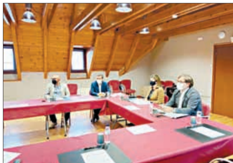
Imatge de la reunió de la Comissió d'Urbanisme

Des d'aleshores, el Govern ha aprovat diversos instruments de planificació territorial i urbanística que, entre d'altres, amplien els