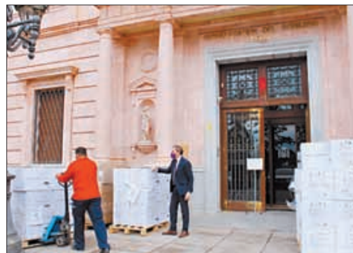
Se'n distribuiran un total de 172.000

Pel que fa a les residències de la regió sanitària de l'Alt Pirineu i Aran, hi ha 42 casos actius de coronavirus a la Llar Sant Josep, dels quals 28 són residents i 14 professionals, mentre que a la residència Serafí Casanovas de Sort, actualment hi ha 13 d'actius, 12 residents i 1 treballador.