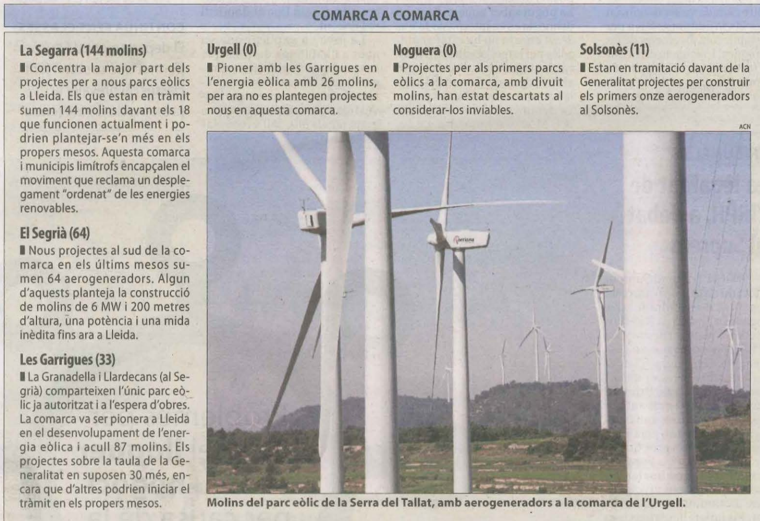
Molins del parc eòlic de la Serra del Tallat, amb aerogeneradors a la comarca de l'Urgell.

projectes per instal·lar aerogeneradors a la comarca de la Noguera, mentre que no se n'ha plantejat per ara cap a la comarca de l'Urgell, pionera juntament amb les Garrigues en la implantació de l'energia eòlica