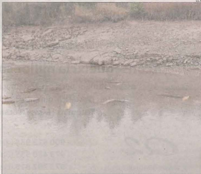
Peixos morts ahir a les ribes del canal de Seròs.

El Conselh també va aprovar una inversió de 250.000 euros per a la renovació de dos aparells mèdics a l'Espitau d'Aran, en concret, un a radiologia i un altre a anestesiologia.