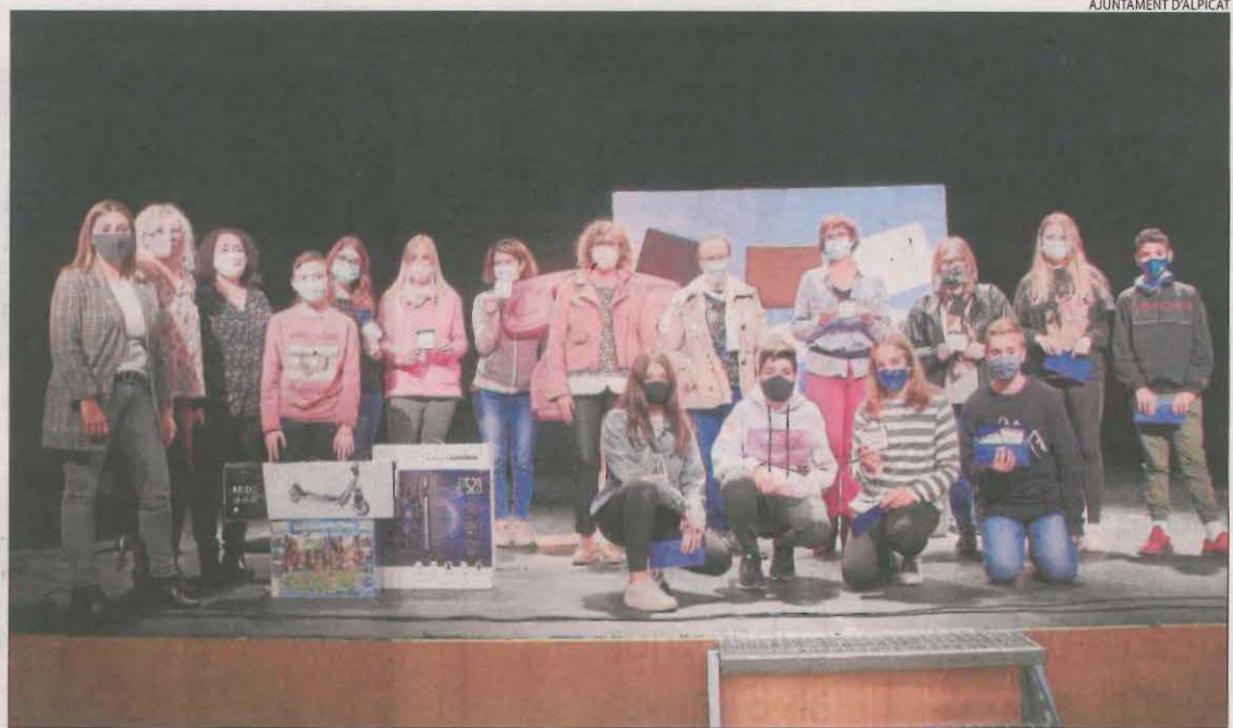
Guanyadors i organitzadors dels concursos BiblioTram i BiblioTrailers, dilluns a la sala La Unió.