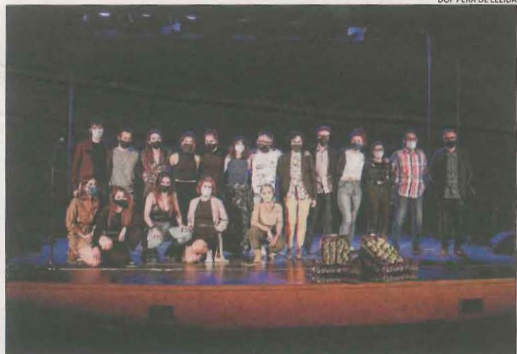
L'equip de rodatge de la websèrie, ahir durant la presentació.