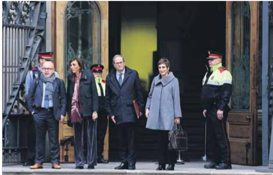
L'expresident Quim Torra, a les portes del TSJC el 18 de novembre del 2019, quan va ser jutjat per desobediència

s'encarregui d'investigar-lo i, si es dona el cas, portar-lo a judici. Seguint aquest raonament, en la mateixa interlocutòria també es desatén la petició que va fer en seu dia la defensa de Torra de practicar noves diligències sobre el cas, ja que el TSJC entén que això ho haurà