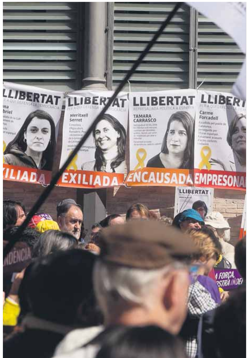
Acte de suport a les dones exiliades, encausades i a la presó, el 2019

A més, l'alt tribunal català hi sosté que Boya no tenia cap poder per decidir l'admissió o no a tràmit de les lleis de desconexió, a diferència dels quatre membres de la mesa, condemnats a vint mesos d'inhabilitació. La situació de Gabriel és idèntica a la de Boya, i el TSJC,