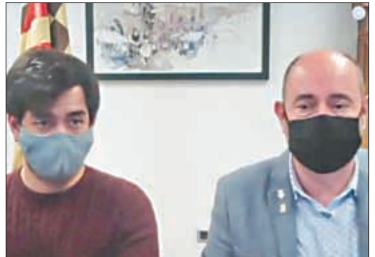
L'Ajuntament ja ha fet un primer cribatge

L'Ajuntament de Balaguer ha rebut 115 propostes per part de la ciutadania per tal de que formin part dels nous pressupostos participatius del consistori. Les 115 propostes presentades per la ciutadania; han estructurat en 12 àmbits diferents: Afers Socials i Participació, Cultura, Obres i Serveis, Educació, Comunicació, Infància, Esports, Sostenibilitat, Turisme, Urbanisme, Festes i Medi Natural. Durant l'acte de presentació se n'han exposat algunes: la construcció d'una minideixalleria, la compra d'habitatsges per destinar-los a ús