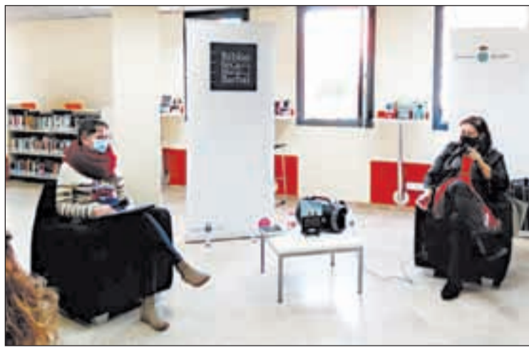
La biblioteca de Tremp va acollir la presentació del llibre