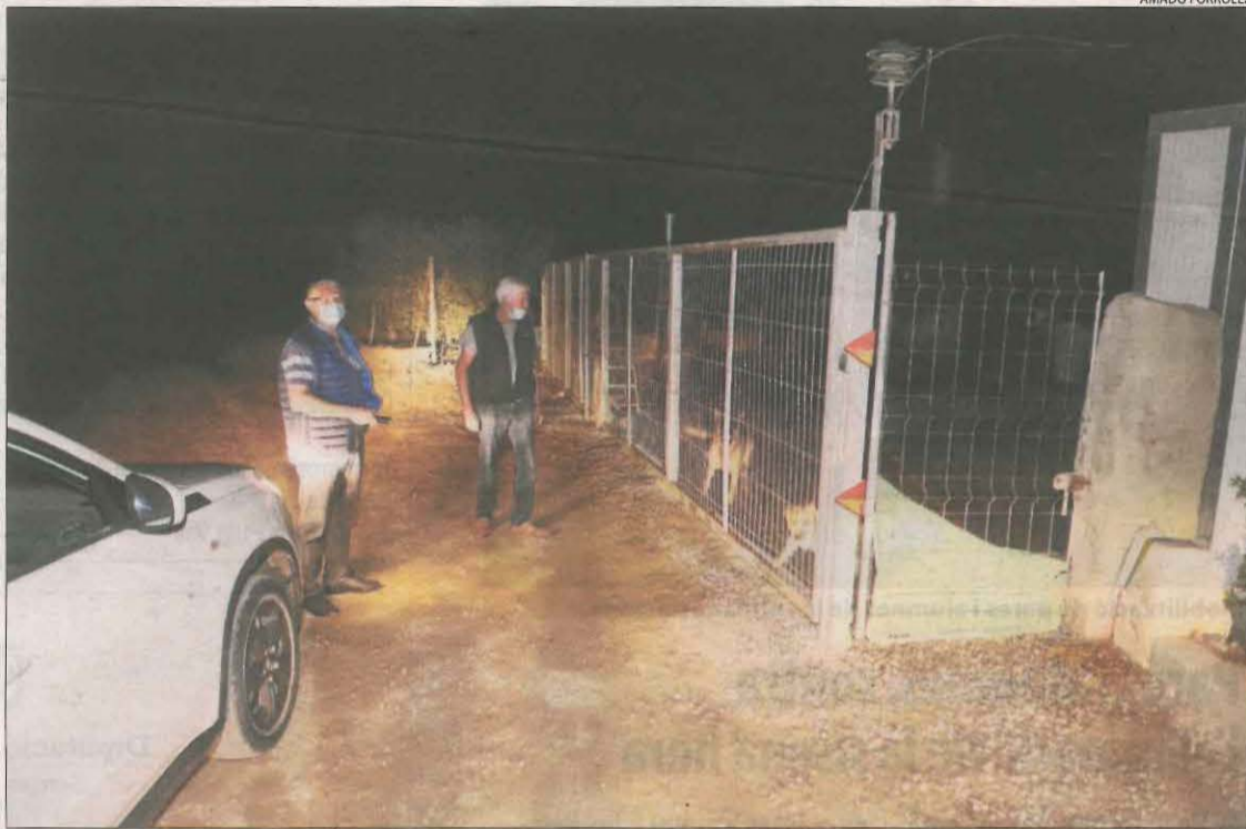
Els veïns de Sucs van començar ahir a la nit a patricular amb els seus vehicles.

Al voltant de 65 veïns s'han ofert voluntaris per participar en les vigilàncies nocturnes