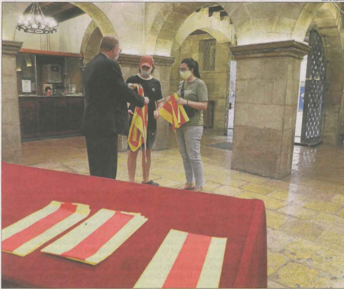
L'ajuntament de Lleida va repartir ahir senyeres de cara a la Diada de demà.

Pel que fa als actes institucionals, la majoria d'ajuntaments mantindran demà les ofrenes o altres convocatòries tradicionals però prescindiran de les activitats amb més públic. A Lleida se celebrarà avui un acte de Generalitat, Diputació i Paeria a les 20.00 hores a la Seu Vella sense públic que es retransmetrà per streaming i es repetirà per Lleida TV. Al Pirineu, serà a Oliana i comptarà amb la consellera Ester Capella.