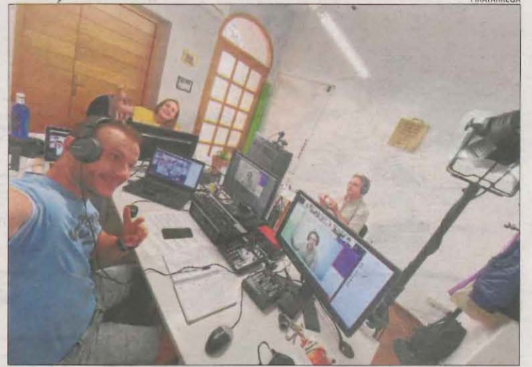
Part de l'equip de FiraTàrrega, a ple rendiment.

Entre les activitats de la jornada d'ahir hi va haver presentacions d'espectacles en format de pitching de cinc companyies que volen projectar-se al mer-