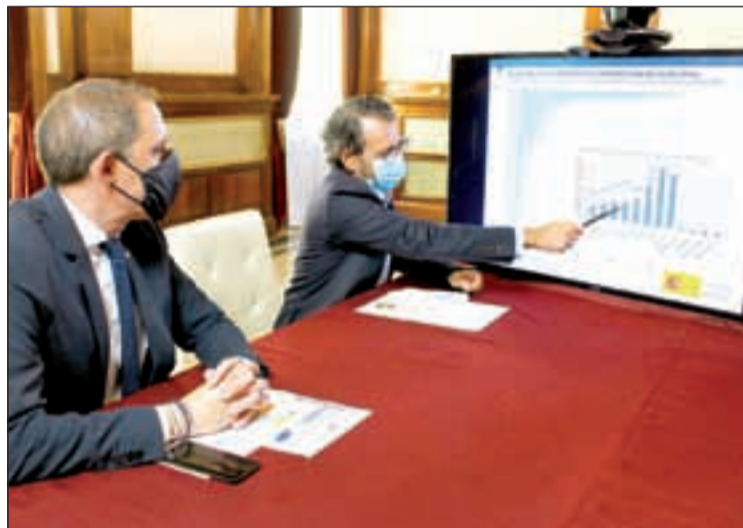
El subdelegat del govern analitzant el balanç