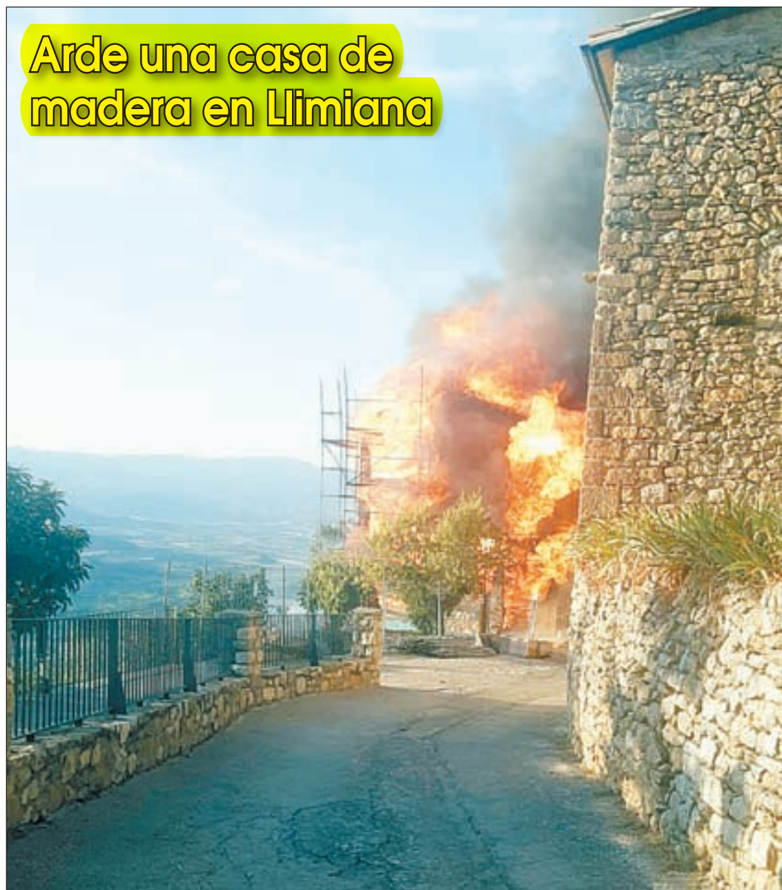
Un incendio calcinó ayer una casa en construcción en Llimiana