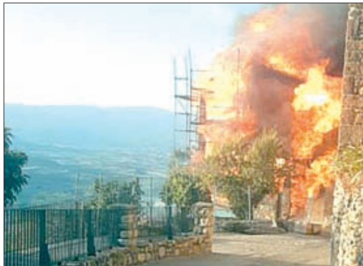
Moment en què la casa cremava totalment