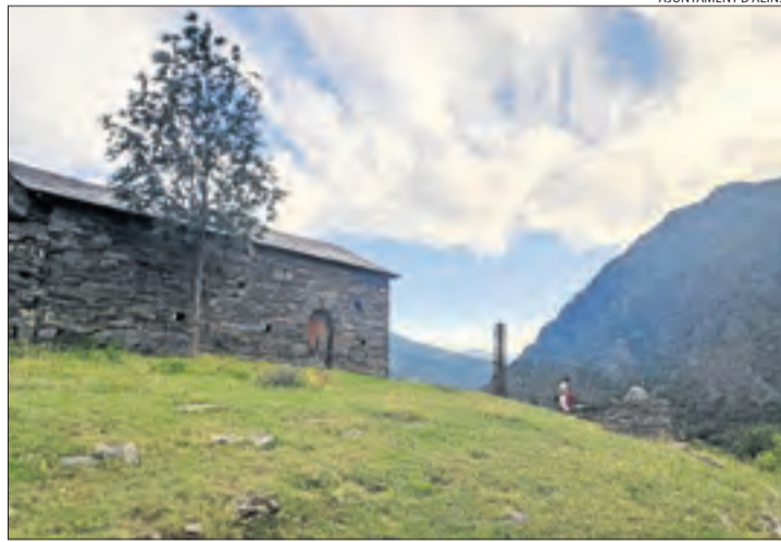
Un dels immobles la titularitat dels quals estudia Alins.

BARCELONA | El síndic de greuges va obrir ahir una actuació d'ofici per fer un seguiment sobre les actuacions que ha dut a terme fins al moment el departament de Justícia de la Generalitat sobre les immatriculacions de l'Església. Així mateix, també va reclamar al departament l'informe sobre les inscripcions efectuades pels diferents bisbats catalans des de l'any 1998 i que el Parlament ja va demanar el juliol de l'any passat. En aquest sentit, la sindicatura va recordar que la resolució establí que el Govern l'havia de redactar "en el terme improrrogable de sis mesos", des de l'aprovació de l'esmentada resolució, un termini que va expirar el gener d'aquest any. Així, el síndic va indicar que tant l'executiu català com l'espanyol tenen pendent encara l'elaboració d'un estudi específic sobre aquestes inscripcions per part de