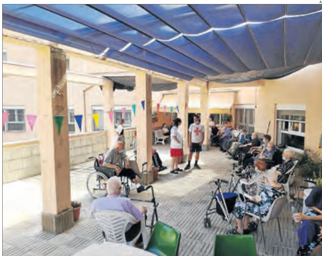
Imatge dels usuaris de la residència d'Àger, que ja ha tornat a rebre visites dels familiars.

Tampoc reben visites el geriàtric públic de Juneda o els dos de Cervera.