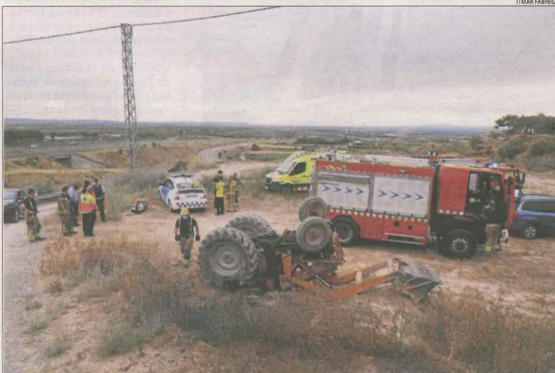
Un veí d'Almacelles de 83 anys va morir dimarts al bolcar amb el tractor, a la imatge.

dels tractors. Expliquen aspectes tècnics i de seguretat. Sobre l'edat de les víctimes, Ribot explica que "és difícil explicar a una persona que ha anat tota la vida a la finca agrícola i portant tractor que no ho faci més, però ha de tenir en compte que no té les mateixes condicions d'agilitat o els