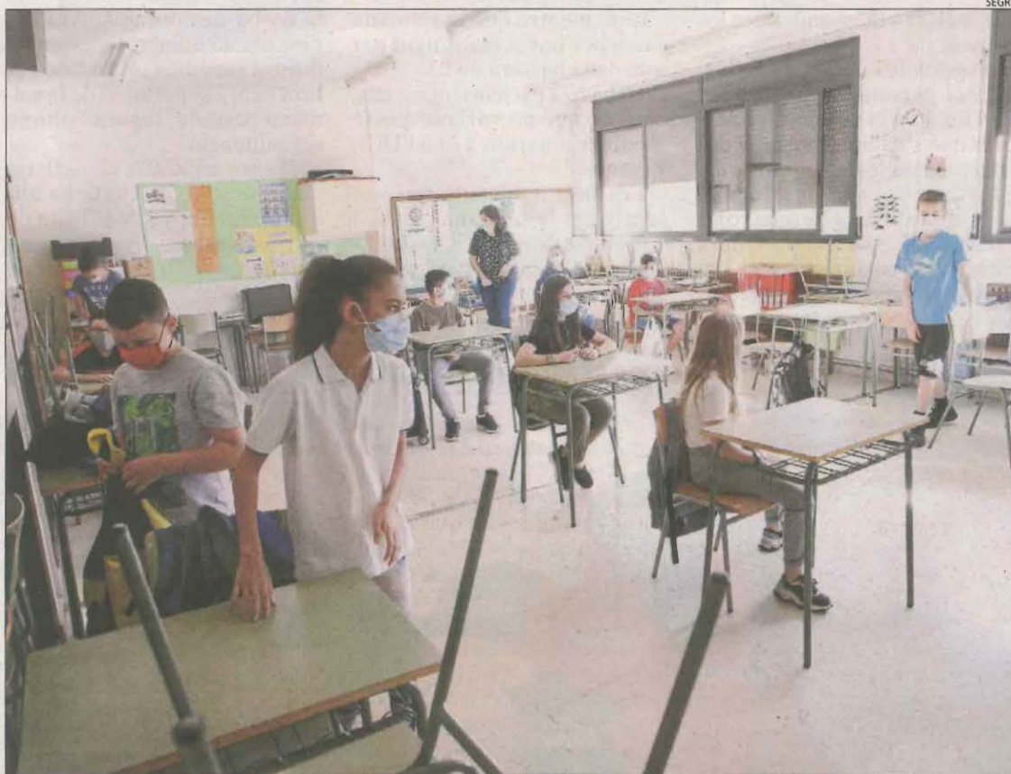
Escolars amb mascareta en una aula el mes de juny passat, durant la reobertura dels centres.

Mentrestant, el sindicat USTEC-STEs estudia si convoca vaga o recorren als tribunals