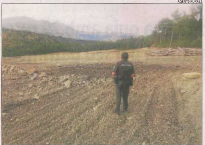
Denúncia dels Rurals a Isona ■ Els Agents Rurals han denunciat el responsable d'una rompuda forestal a Isona i Conca Dellà al comprovar que s'havia excedit en tres hectàrees de la superfície autoritzada.

l'hospital de Vielha. Poc després, a les 11.18 hores, un home es va donar un cop al cap als afores d'Espot en direcció Sant Maurici. Després de ser atès in situ , va ser evacuat a l'hospital del Pallars de Tremp. Les intervencions de muntanya, com rescats i recerques de persones desorientades, s'han disparat aquest mes d'agost al Pirineu de Lleida. Els Bombers fan una mitjana de dos sortides al dia.