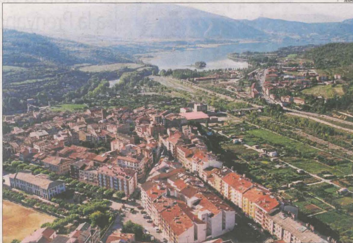
La Pobla de Segur amb el pantà de Sant Antoni al fons.

Les crides a estalviar aigua contrasten amb el fet que els pantans estan plens després de mesos d'intenses pluges. Malgrat que les reserves són abundants, les captacions de cabal, els bombatges que el traslladen i els dipòsits que l'emmagat-