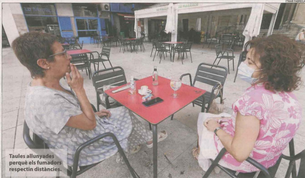
Taules allunyades perquè els fumadors respectin distàncies.

Són les que tenen un brot de coronavirus encara sense controlar, mentre que els altres 68 geriàtrics d'aquesta zona de Lleida podran tornar a obrir les portes als familiars. Els dotze centres de la regió sanitària del Pirineu són considerats "verds", per la qual cosa també rebran visites de nou.