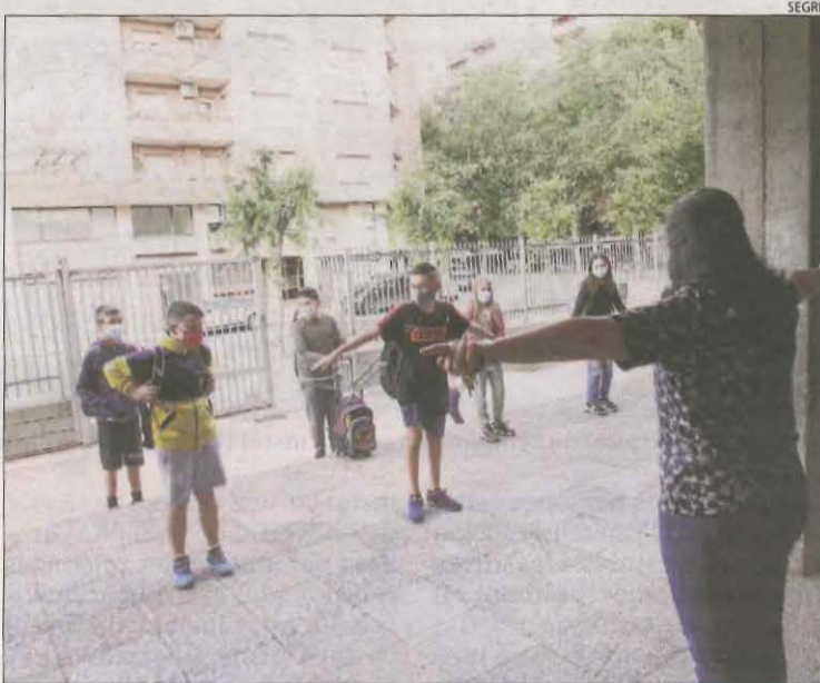
Alumnes amb mascareta a l'entrada d'un col·legi al juny.