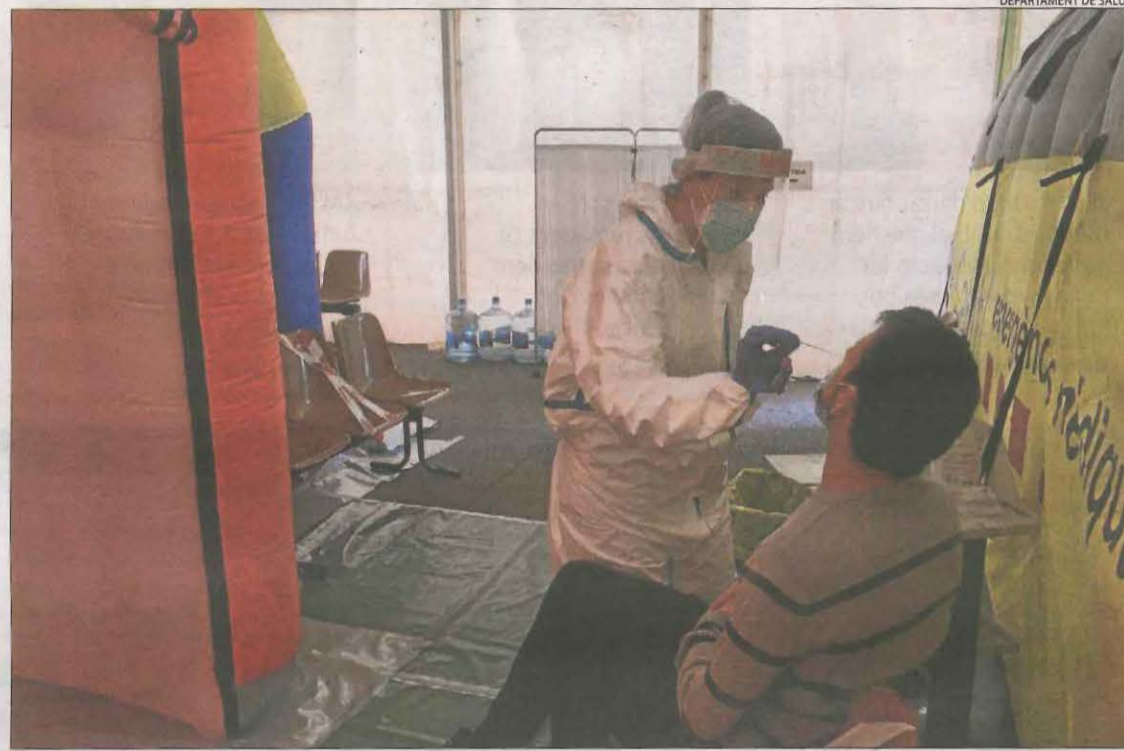
Una sanitària pren una mostra a un pacient al CUAP de Prat de la Riba per a una PCR.

A diferència de la primera onada de la pandèmia, ara Salut està optant per dur a terme cribratges massius en diferents punts de Catalunya amb l'objectiu de detectar casos asimptomàtics. De fet, demà té previst fer tests a Albosa (vegeu la pàgina 5).